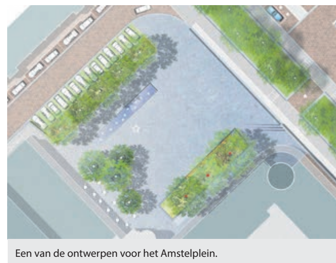
Een van de ontwerpen voor het Amstelplein.