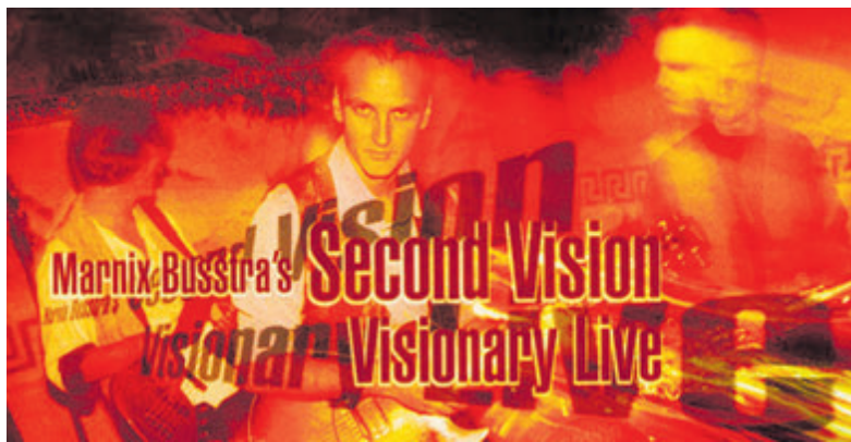
Albumhoes Visionary Live at Bacchus.

naar huis kunnen als herinnering aan een mooie middag. Tussen door speelt het illustere trio even samen om er vast in te komen. Vanaf kwart voor drie is de zaal open voor publiek en half vier wordt het licht gedempt en verschijnt het trio op het podium zodat deze fantastische energie gevende middag kan beginnen!