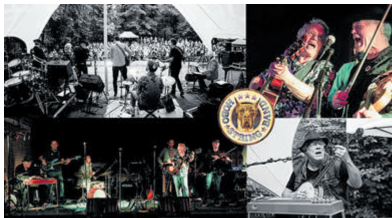
Optredens van de Hobo String Band het afgelopen jaar.