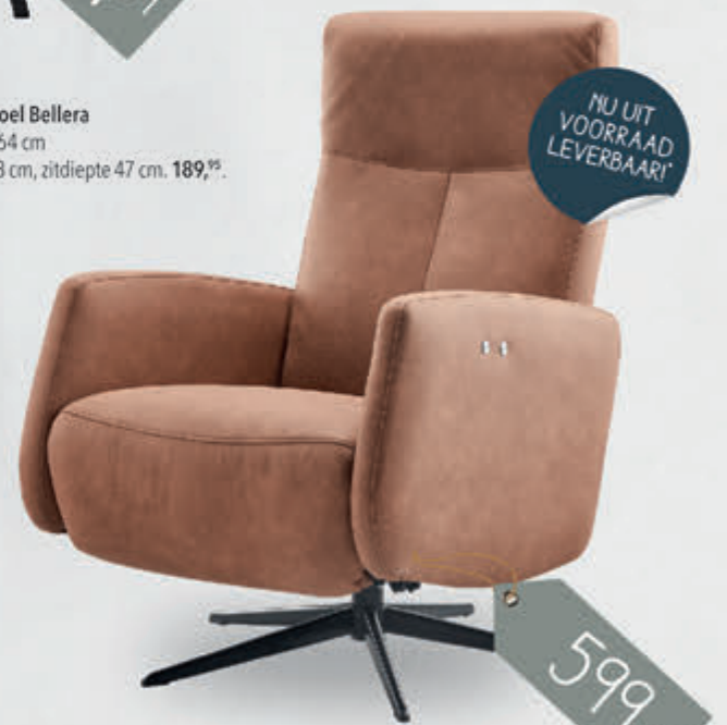
Relaxfauteuil Perfini in stof Python H105x867xD82cm handmatig verstelbaar 599,-, elektrisch verstelbaar 799,-