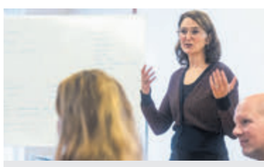
Thema-avonden FlorAalsmeer over de lokale politiek.

De avonden zijn toegankelijk voor inwoners die interesse hebben in de lokale politiek. Op 29 januari is dat in de Historische Tuin Aalsmeer en op 12 februari in Dorpshuis Het Podium te Kudelstaart. Vooraf aanmelden is verplicht. Dit kan per mail: lokaleraad@floraalsmeer.nl of via de website: www.floraalsmeer.nl