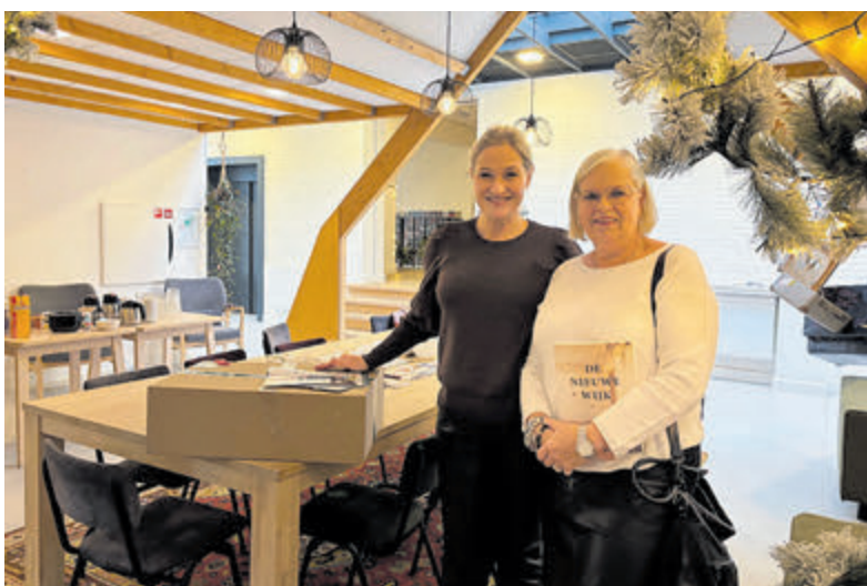
De zussen Verwer steunen elkaar in moeilijke tijden.