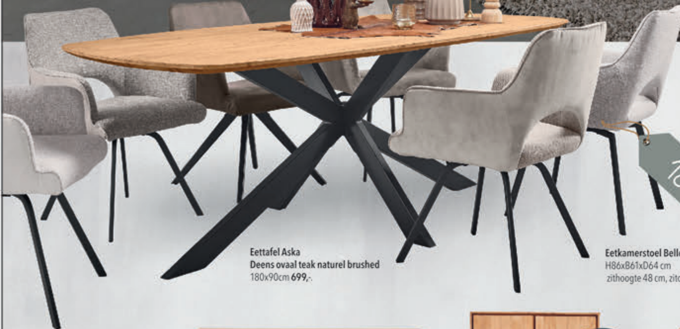
Eettafel Aska Deens ovaal teak naturel brushed 180x90cm 699,-

Hoekbank Mascato 84x356x219cm vanaf 1979,- afgebeeld incl. opties 2954,-. Hoofdsteen Devano 1199,-. Salontafel Aska in Teak hout 180x880cm met 1 lade 329,-. Viperkleed Torresani in vele maten & kleuren: B200xL290cm 599,-, B160xL230cm 399,-.