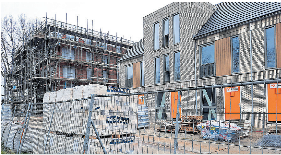
Nieuwbouw in de wijk Hornmeer, appartementen en woningen langs de Dreef.