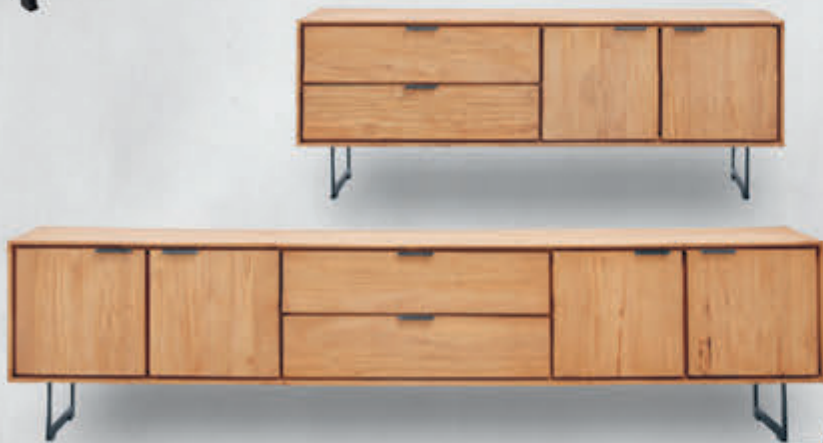
TV-meubel Aska in Teak hout: Groot H59x823x42cm 749,- Klein H59x815x42cm 549,-