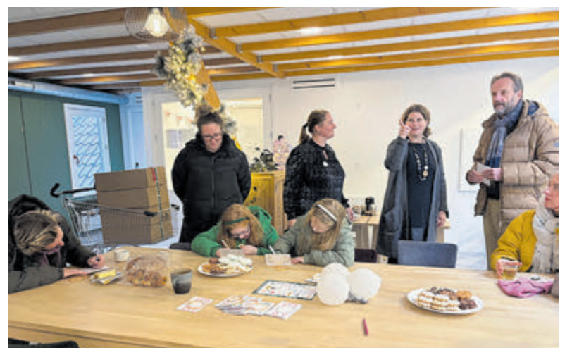
Nina en Vera schrijven een kaartje voor hun vader.

Het echtpaar Alberts komt net binnen, ze wonen in Harderwijk maar lezen nog altijd de Nieuwe Meerbode; hun pakket is bestemd voor hun dochter in Aalsmeer die al negentien jaar voor haar zoon met een beperking zorgt. Het is een kleine greep uit al die leuke ontmoetingen die donderdagmiddag, met blijde mensen die op pad gaan om een mooi pakket cadeau te geven aan iemand die hen lief is. Met een persoonlijke boodschap en vol lekkere dingen en bijzondere verrassingen.