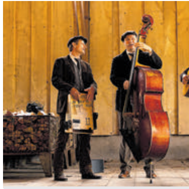
Het Bronco Brothers Trio treedt zondag op bij Bob.

Achter de nog gesloten deuren wordt er gewerkt aan licht en geluid, de tafels en stoelen op de juiste plek gezet, de tafels gedekt met de gewassen en gestreken kleedjes, de waxine lichtjes aangestoken en de rozen klaar gelegd die na afloop mee