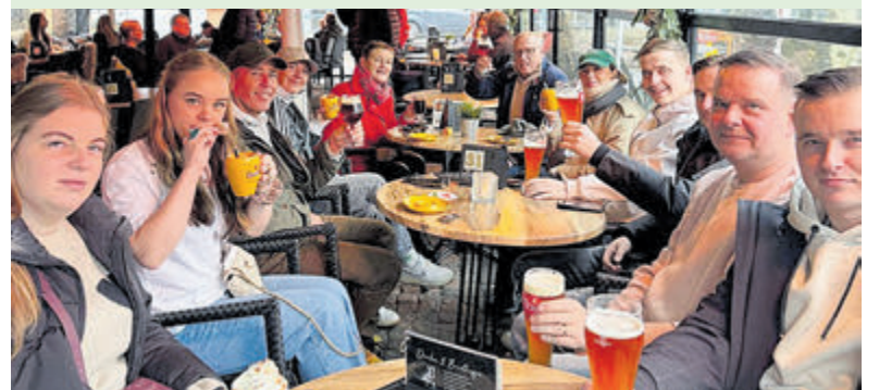
Stadswandeling met drankje op terras in Kampen.

zaterdag 4 januari. Het interview door presentator Jan van Veen is te beluisteren op zowel Radio als TV Aalsmeer tussen 12.00 en 13.00 uur. TV Aalsmeer is bij abonnees van CAIWAY te vinden op kanaal 12 en bij gebruikers van KPN/XS4ALL/Telfort op kanaal 1389. Meer informatie: www.radioaalsmeer.nl