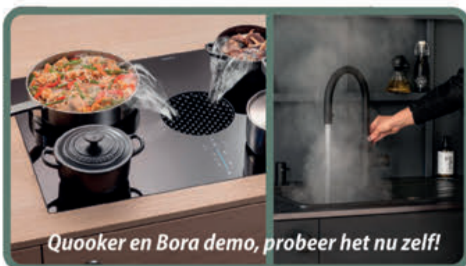
Quooker en Bora demo, probeer het nu zelf!