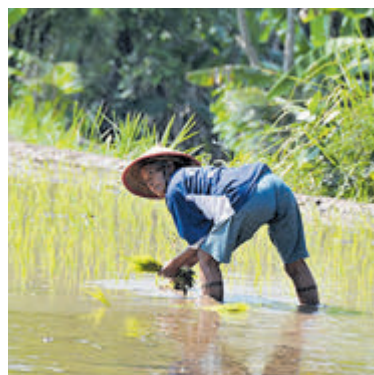
Lezing over Indonesië bij Groei & Bloei.

land Indonesië. De dia-lezing 'Gordel van smaragd' begint om 20.00 uur in Buurthuis Hornmeer aan de Dreef 1. Belangstellenden zijn van harte welkom, de toegang is gratis.