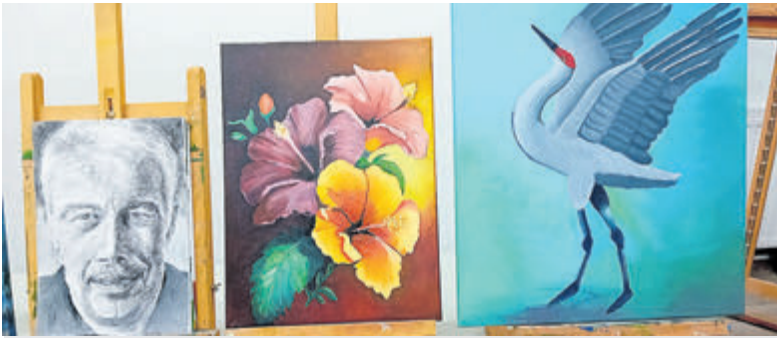
Diverse cursussen en workshops bij De Werkschuit.

genomen worden aan de cursus Vrij tekenen en schilderen van Miranda. Deze cursus bestaat uit tien lessen en wordt zowel op maandag als op dinsdagavond gegeven. Bij Miranda leren cursisten hoe ze hun eigen meesterwerk kunnen maken. Plezier in het schilderen en tekenen staat bij deze cursus voorop. Tijdens de les is er individuele begeleiding. De cursus is voor beginners en gevorderden. Een stilleven, zelfportret of landschap kunnen uitgangspunten voor een schilderij of tekening zijn. Ook is er de mogelijkheid om vanuit de eigen interesse een onderwerp te bepalen. Kijk voor het cursusaanbod op www.werkschuit-aalsmeer.nl . Voor informatie en inlichtingen kan een e-mail gestuurd worden naar: stichtingde-werkschuitaalsmeer@outlook.com