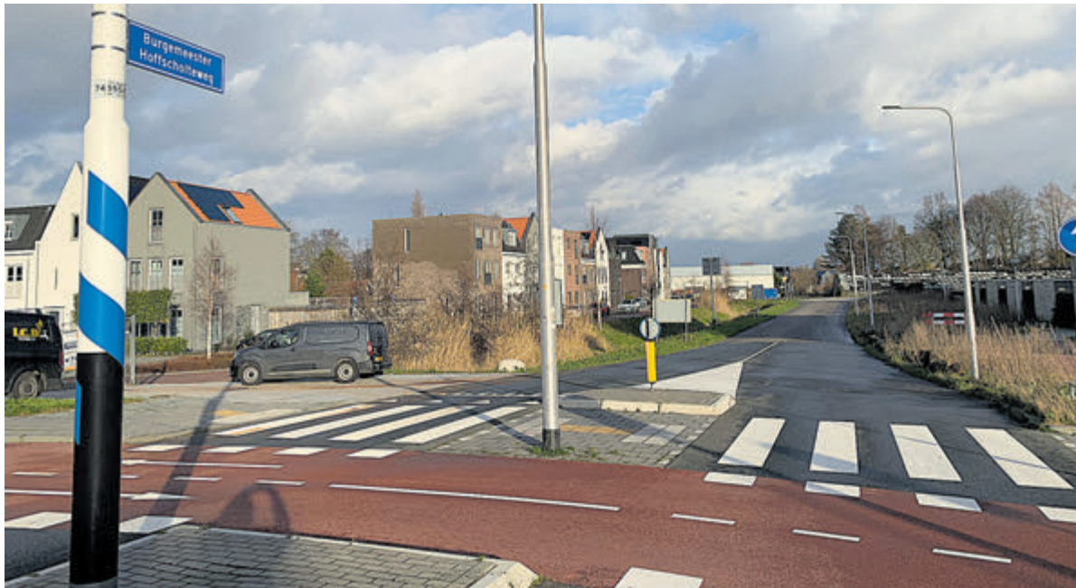
Burgemeester Hoffscholtweg: Overeenstemming bereikt, een mooie doorbraak na jaren!