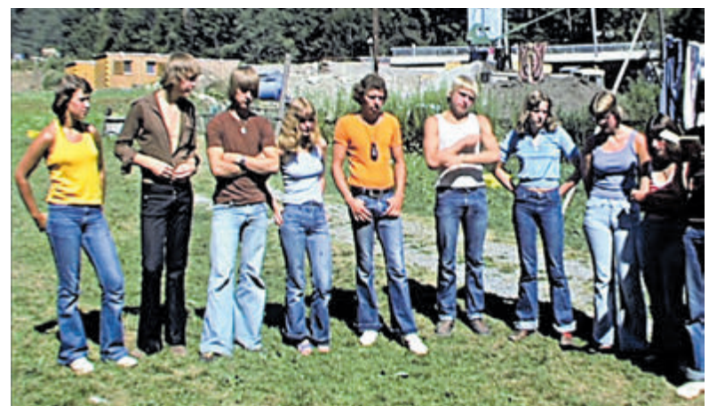
Cirkelgang, op Bindingkamp.