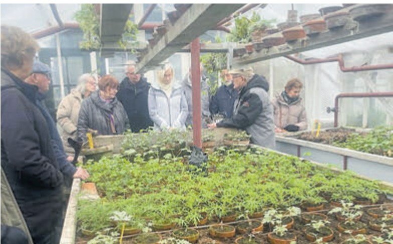
Snertwandeling over de Historische Tuin.

Zaterdag 25 januari organiseert het museum de jaarlijkse workshop fruitbomen enten. Deskundigen van de Tuin laten deze middag zien hoe appels en peren worden geënt. Na een theoretisch deel met uitleg en instructies gaan deelnemers onder begeleiding zelf aan de slag. Het slijpen van de messen krijgt de nodige aandacht tijdens de workshop. Dit precieze werkje blijkt in de praktijk lastiger dan gedacht. Voor iedere cursist zijn er voldoende onderstammen aanwezig. Deelnemers hebben ook de mogelijkheid om hun bestaande appel- of perenboom te enten. Dit kan nuttig zijn als de boom in een matige of slechte conditie verkeert. Neem in dat geval meerdere takken van éénjarig gegroeid hout mee naar de workshop. De workshop begint om 13.30 uur en duurt tot ongeveer 16.00 uur. Kosten zijn 17,50 euro inclusief koffie of thee. Plaatsen reserveren voor één van de twee of beide activiteiten kan via: https://www.historischetuinaalsmeer.nl/bezoek/agenda