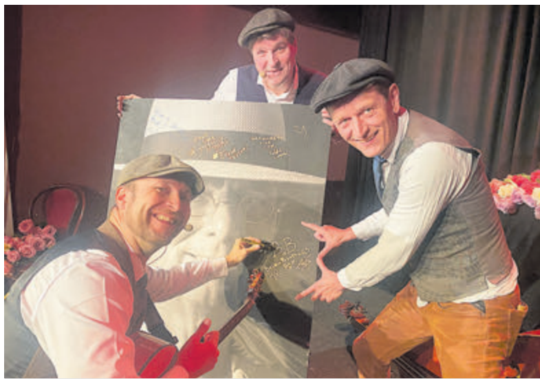
Succesvol optreden van Bronco Brothers bij Zondag bij Bob.