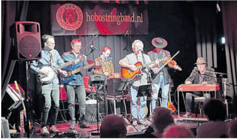
Een uitverkocht 'huis' voor de Hobo String Band.