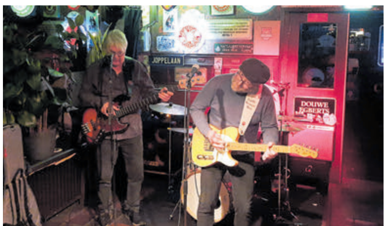
Happy boogie woogie en blues van Little Boogie Boy blues band.