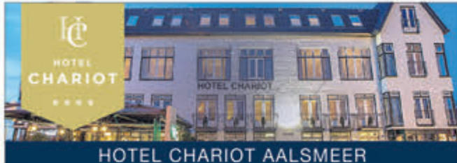
HOTEL CHARIOT AALSMEER