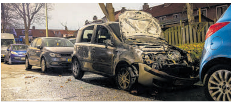
Auto uitgebrand in de Geraniumstraat.

De laatste melding voor de brandweer was om 03.10 uur. In de Geraniumstraat stond een auto in de brand. De brandweer was snel ter plaatse en wist te voorkomen dat het vuur oversloeg naar nabij geparkeerde auto's, maar het brandende voertuig raakte zwaar beschadigd oftewel total loss. De gemeente Aalsmeer bedankt alle medewerkers van politie, handhaving, brandweer en ambulance voor hun inzet voor de veiligheid van alle inwoners deze avond. Ook wenst de gemeente iedereen een voorspoedig 2025.