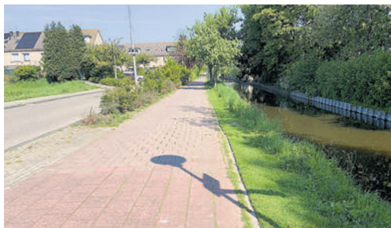
Start verbetering fietspad bij Baanvak.

De zendmast aan de Braziliëlaan is één van de onderwerpen die aan de orde komen in de beeldvormende vergadering van de commissie Ruimte op dinsdag 14 januari. Tijdens deze eerste vergadering in 2025 wordt ook gesproken over de Gebiedsvisie Kudelstaart, de uitgangspuntennotitie Schinkelpolder en de projectnota Bilderdammerweg 6-30 (nieuwbouw 26 huurappartementen en 8 koopwoningen voor vooral starters en senioren). De vergadering wordt besloten met informatie over regionale samenwerking. De commissie Ruimte komt vanaf 20.00 uur bijeen in de raadzaal in het Raadhuis tot, volgens planning, kwart voor elf. Belangstellenden zijn welkom.