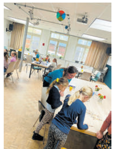
Veel gezelligheid tijdens creatieve activiteiten bij Beau'tje.

ding te stimuleren. Deelname aan Beau'tje is gratis. Meer weten of inschrijven? Ga naar www.debinding.nl/activiteiten/beautje/ of neem contact op via beau@debinding.nl .