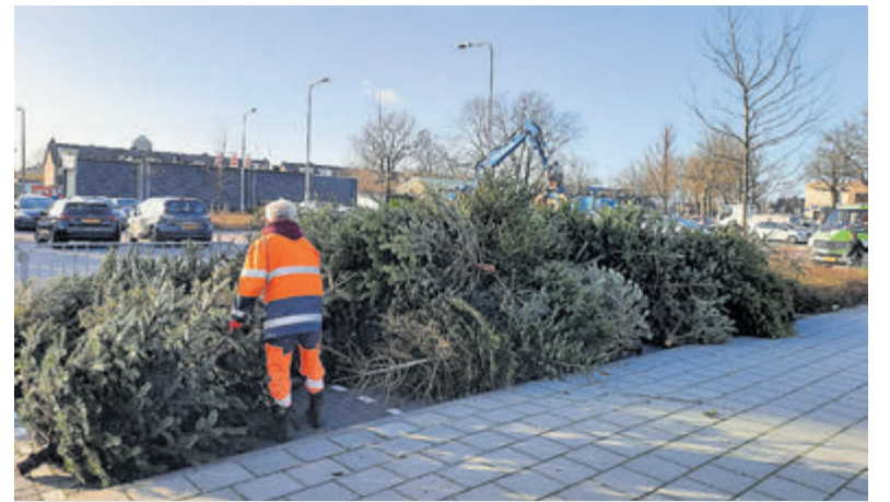
Kerstbomen inleveren kan ook vandaag nog.

testen. Helaas, verkeerd moment en de verkeerde plek. De bestuurder kreeg van de politie een volgteken gevolgd door een uitleg wat hij had misdaan. Gezien de snelheidsovertreding van meer dan honderd procent is besloten het voertuig in beslag te nemen. Daarnaast is het rijbewijs van de bestuurder ingevorderd. De officier van justitie zal zich buiten over deze zaak en de strafeis beslissen. Tevens zal de officier bepalen of de bestuurder zijn rijbewijs en/of voertuig terugkrijgt.