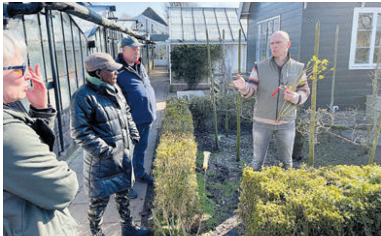
Workshop fruitbomen enten in de Historische Tuin.