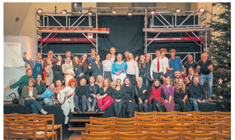
Deelnemers aan kerstspel 'Liefde in de steigers'.