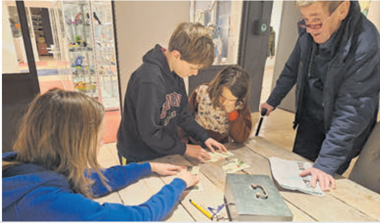
Speuren naar afbeeldingen en antwoorden.