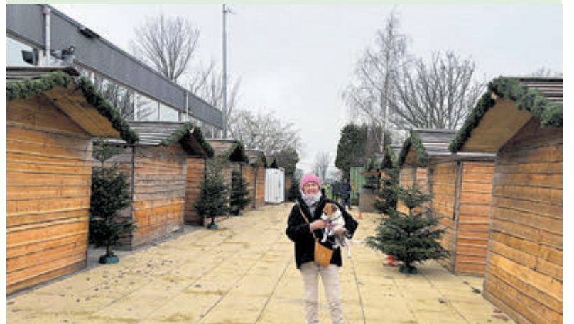
Bezoek Westeinder Winter Village.