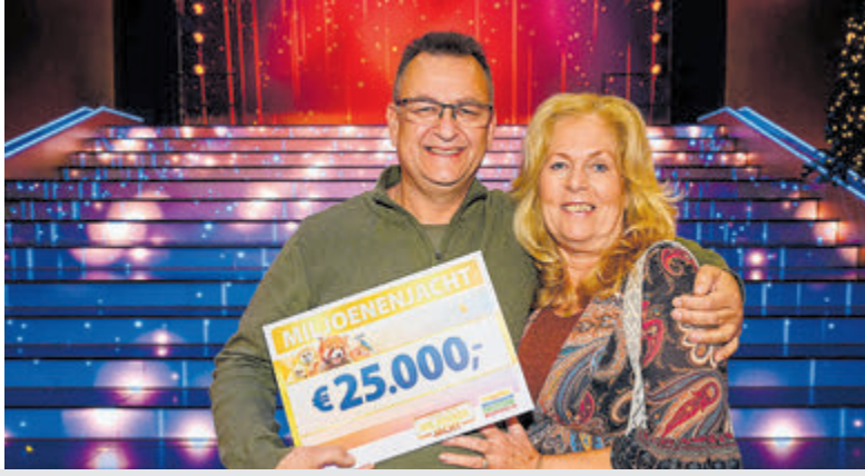
Het Rijsenhoutse echtpaar is blij met de prijs van 25.000 euro.