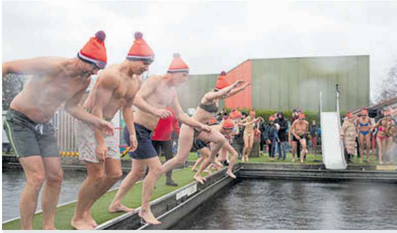
Nieuwjaarsplons in het Oosterbad.