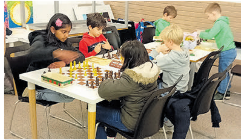
Animo voor het jeugdschaken bij AAS is groeiende.

Later in de middag werd in de veilingzaal de film '75 jaar Bindingkampen' vertoond, die door een aantal belangstellenden met veel plezier en herkenning werd bekeken.