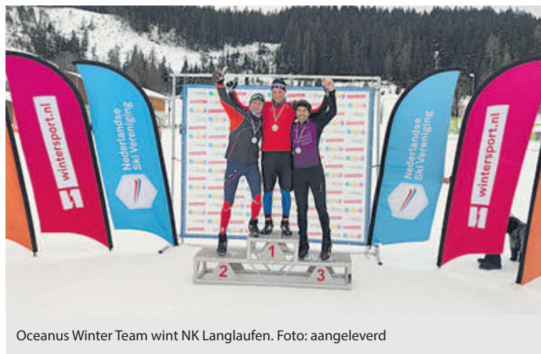
Oceanus Winter Team wint NK Langlaufen.