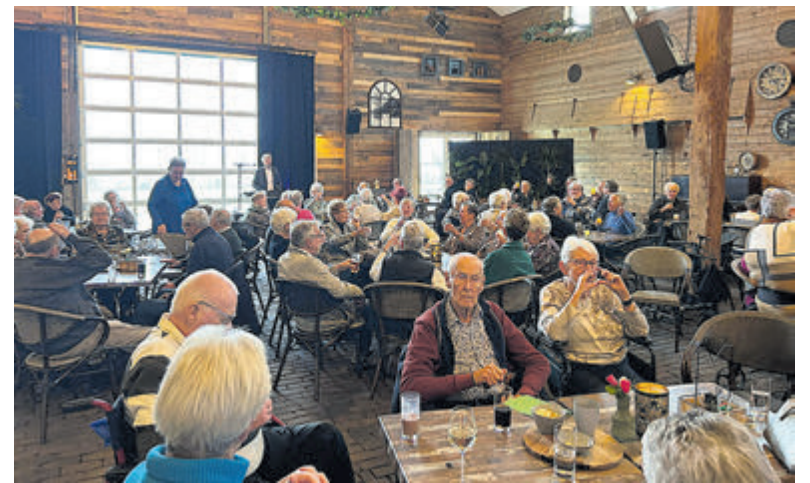
Gezellig nieuwjaarsfeest met De Zonnebloem.

- De kerken en gemeenten verzorgen voor Radio Aalsmeer uitzendingen op dinsdagavond. Kabel 99.0 en ether 105.9.