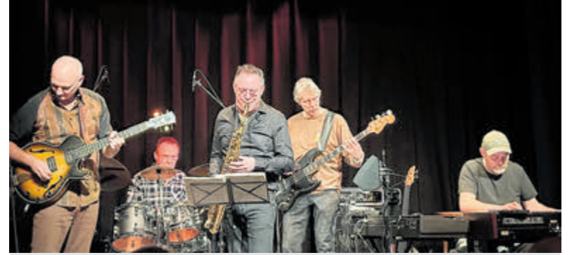
Second Vision: een mix van nostalgie en vernieuwing.

Onder het genot van stapels bitterballen werden goede voornemens gedeeld en nieuwe ideeën geboren. De avond werd afgesloten met een gevoel van optimisme en verbinding. Met een flinke dosis inspiratie ging iedereen met een goed gevoel huiswaarts, klaar om van 2025 een jaar vol daadkracht en betrokkenheid te maken.