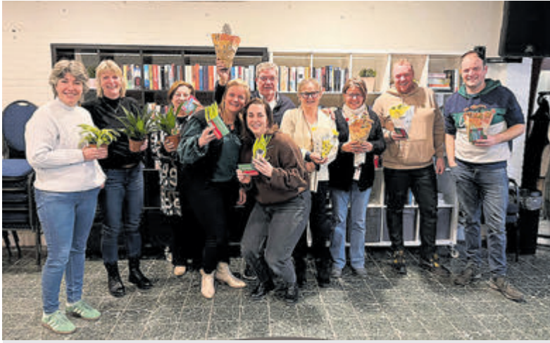
De winnaars van de Keez-avond in Buurthuis Hornmeer.