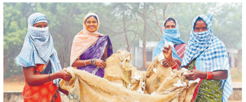
Katoen vrouwen in Afrika.

Wist je dat maar liefst 80% van al het eten dat in de wereld gegeten wordt, afkomstig is van kleinschalige boeren? Dat is best wel heel veel! Dus, om de aarde gezond te houden voor de volgende generaties, moet er samengewerkt worden met bedrijven om ervoor te zorgen dat ze eerlijk betalen en dat alles in de keten open en eerlijk verloopt. Zo kunnen boeren fatsoenlijk leven en werken en kan de planeet beschermd worden voor toekomstige generaties. Kijk voor meer informatie op de website: www.fairtradegemeenteaalsmeer.nl