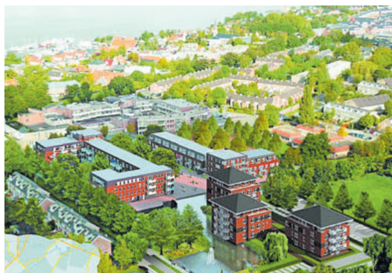
Impressie Gebiedsvisie Kudelstaart.

Kudelstaart – De Dorpsraad Kudelstaart organiseert een extra bewonersoverleg over de Gebiedsvisie Kudelstaart op maandagavond 27 januari. De Gebiedsvisie Kudelstaart moet richting geven aan de ontwikkelingen in het dorp voor de komende 10 tot 20 jaar. De visie startte als een Centrumvisie, maar werd werkende weg verbreed tot een Gebiedsvisie. Het moet duidelijkheid geven aan de ontwikkelingen in het Centrum ten aanzien van de school, Proosdijhal, tweede supermarkt, bibliotheek, etc. Daarnaast gaat de visie in op de toekomst van de glastuinbouw en de recreatieve voorzieningen in Kudelstaart. De verantwoordelijk ambtenaar en één van de opstellers van de Gebiedsvisie zullen aanwezig zijn om een toelichting te geven en vragen te beantwoorden. De avond begint om 20.00 uur en wordt zoals gebruikelijk in Dorpshuis 't Podium aan de Kudelstaartseweg gehouden.