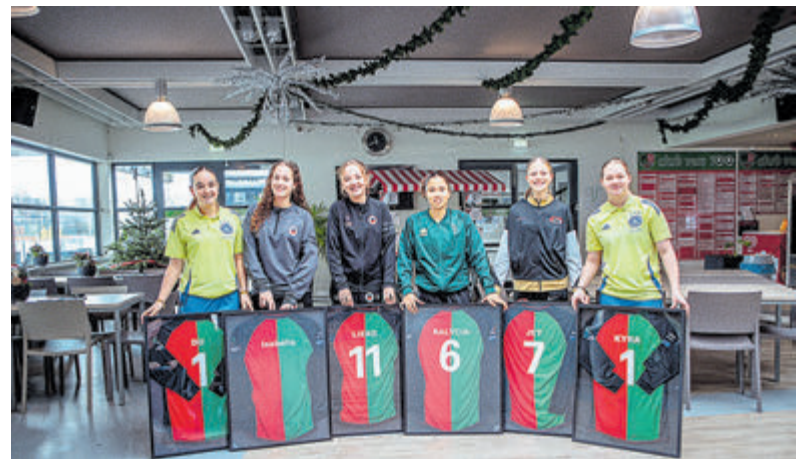
Succesvolle FCA meiden in het zonnetje gezet.