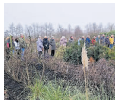
'Snertwandeling' op de Historische Tuin.

club. Om dit te vieren, ontvingen zij een speciale verrassing: een ingelijst FC Aalsmeer shirt. Daarnaast werden zij gefotografeerd in hun nieuwe cluboutfits en het vertrouwde FC Aalsmeer tenue. Deze foto's krijgen een ereplaats op een speciaal ontworpen wand in de clubruimte. Een kunstwerk dat een blijvende herinnering zal vormen aan hun succes. Het bestuur en jeugdbestuur van FC Aalsmeer is enorm trots op de prestaties van haar talenten en wensen ze uiteraard heel veel succes bij hun nieuwe clubs!