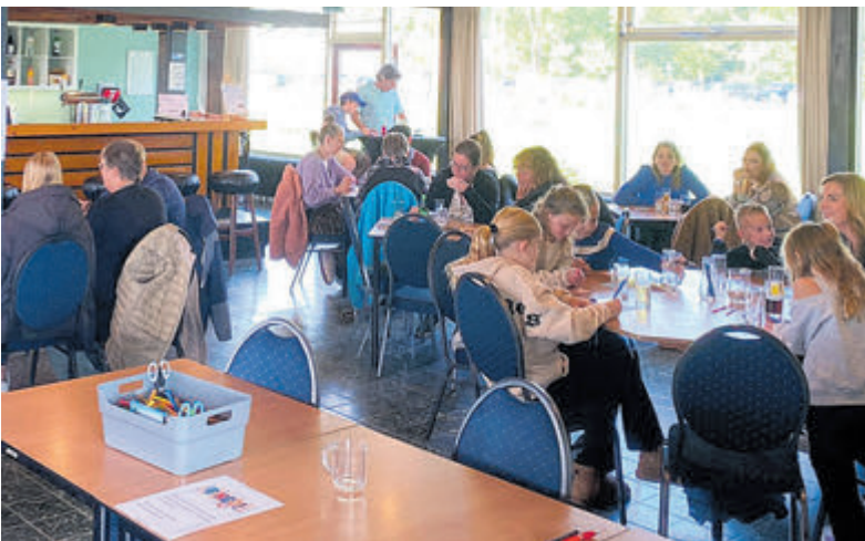
Gezellige drukte tijdens de vorige spelletjesmiddag.

Aalsmeer - Op zondag 2 februari organiseert Buurthuis Hornmeer aan de Dreef een gezellige familiebingo voor jong en oud. De deuren gaan