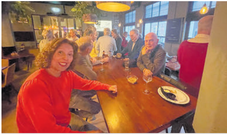
Nieuwjaarsbijeenkomst Taalpunt Aalsmeer.

Aalsmeer - Op zondag 26 januari organiseert de Aalsmeerse CAMA Gemeente weer een maaltijddienst. De zon wordt in huis gehaald met het thema Griekenland. Om 16:00 uur begint een korte samenkomst met zang, gebed en een korte overdenking. Daarna gaan de aanwezigen lekker met elkaar eten. Iedere belangstellende is van harte welkom vanaf 15.45 uur in zalencentrum t Baken aan de Sportlaan 86.