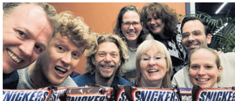
De Aalsmeerse gelegenheidsformatie Snickers.