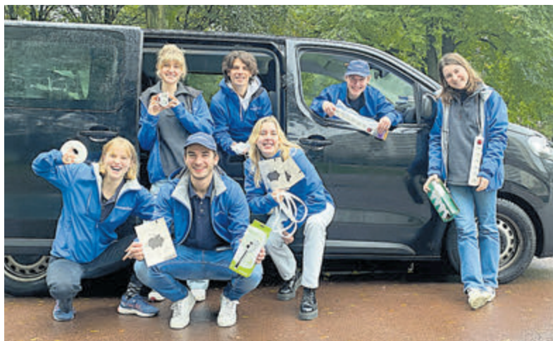
De energiefixers voor huurders in Aalsmeer en Kudelstaart.

Aalsmeer - De energieprijzen zijn de afgelopen jaren flink gestegen en dat is te merken aan de energierekening. In Aalsmeer en Kudelstaart zijn energiefixers actief. Zij komen thuis bij huurders om kosteloos energiebesparende producten te installeren en geven tips om gas en stroom te besparen. Met kleine aanpassingen in huis of door dingen iets anders aan te pakken, kunnen huurders veel besparen. Huurders kunnen bijvoorbeeld zelf de thermostaat een graad lager zetten of de stekker uit het stopcontact trekken na gebruik. Dat is goed voor de portemonnee, het wooncomfort en het milieu. De energiefixers van het Regionaal Energieloket komen bij huurders langs voor aanpassingen in huis. Zij richten zich op huurwoningen met een slecht(er) energielabel. Energiefixers is een project van de gemeente Aalsmeer