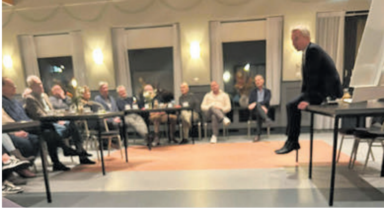
Inspirerende woorden en ontmoetingen tijdens receptie VVD.