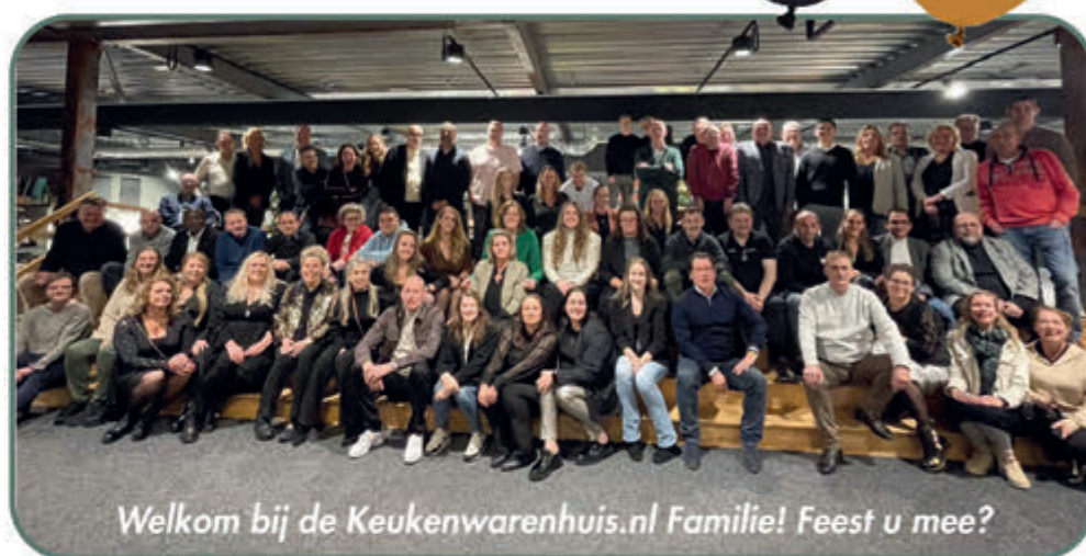
Welkom bij de Keukenwarenhuis.nl Familie! Feest u mee?

Met trots nodigen wij u graag uit om deze week op ons jubileumfeest te komen. Profiteer nu van onze jubileum acties, in de grootste keukenshowrooms van Nederland, met de allernieuwste keukenmodellen met keukens voor ieder budget in alle kleuren. Nu ook zelfs duizend luxe keukens welke binnen 7 dagen leverbaar zijn!