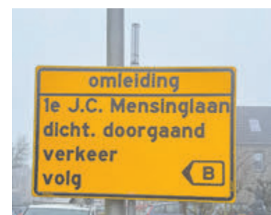
Omleidingsborden vanwege werkzaamheden.

verkeersdoorstroming tijdens de werkzaamheden te verbeteren, is de Hortensialaan tijdelijk ingericht als een tweerichtingsweg. Nood- en hulpdiensten kunnen alle locaties bereiken.