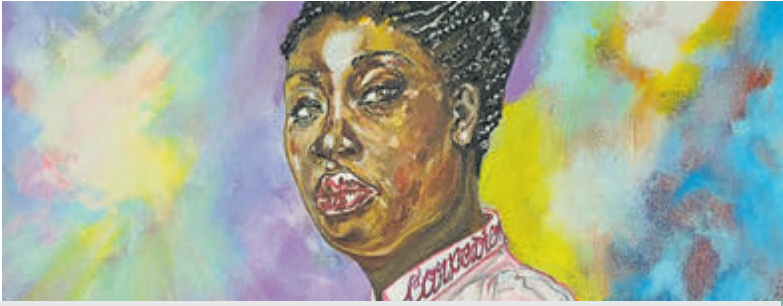
Schilderij van kunstenaar Steven Partiman.