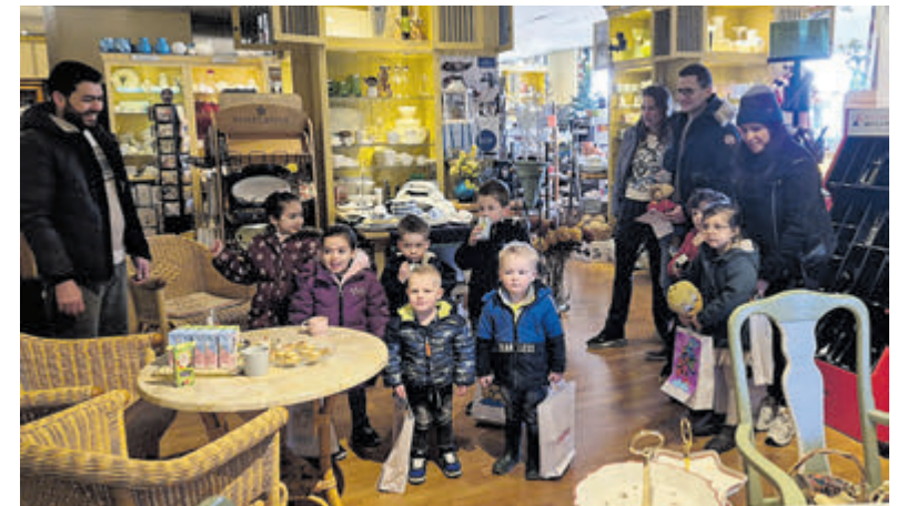
De winnaars van de kleurwedstrijd.

aanbeholden. Daarna was het tijd voor de uitreiking van de prijzen per leeftijdscategorie. De jongste deelnemer was 2 jaar en de oudste was 7 jaar. Er waren veel mooie tekeningen ingeleverd, iedereen had z'n uiterste best gedaan. Na ontvangst van de prijzen werd er nog een groepsfoto van de winnaars gemaakt.