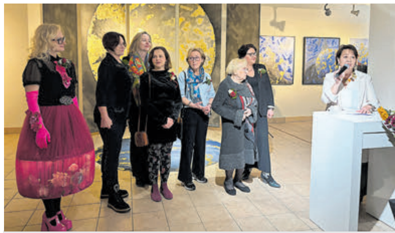
De kunstenaars van Polska Pasja.