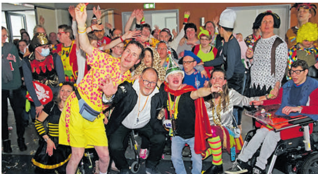
Onbeperkt carnaval vieren met Stichting Dag van je Leven en De Pretpeurders.

aangemoedigd origineel verkleed te komen, want wie weet winnen ze wel een prijsje. Deze middag treedt Zingende DJ Dennis Wijnhout op en zijn Fieps & Katootje er ook gezellig bij. De middag begint om 12.41 uur, eindigt om 14.41 uur en de toegang en de hapjes en drankjes zijn gratis. Meld je aan bij de begeleiding van Ons Tweede Thuis, via mail clientenactiviteiten@onstweedethuis.nl of stuur, wanneer je niet aangesloten bent bij Ons Tweede Thuis, een mail naar info@stichtingdagvanjeleven.nl . Voor vragen kan gebeld worden naar 06-28444951. Neem vooral ook je ouders, familie, vrienden en begeleiders mee naar dit vast weer heel gezellige Carnavalsfeestje.