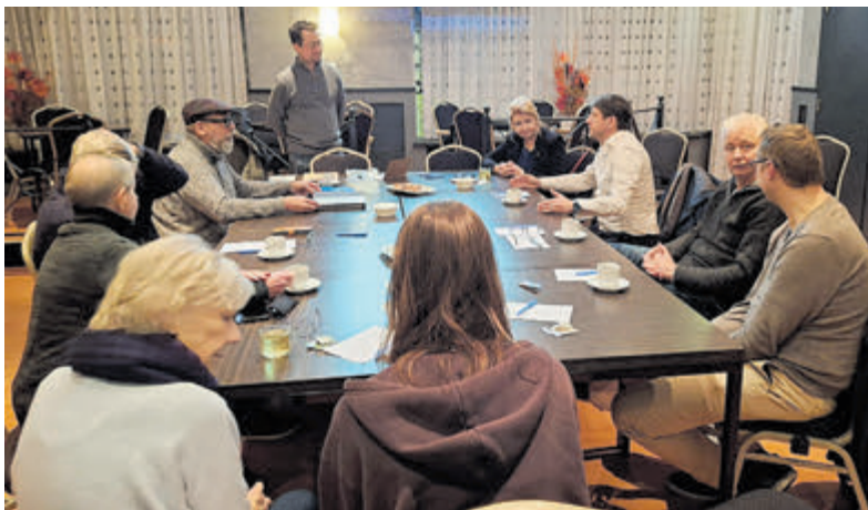
Thema-avond 'lokale politiek'.

ontstonden. Veel vragen over 'hoe het nou werkt' in de politiek zijn beantwoord en door middel van een puzzel werd duidelijk wie wat doet en wat de rol van de gemeenteraad, de griffier en het college is ten opzichte van elkaar. Onder het genot van een drankje werd nog ruim nagepraat en alle deelnemers vertrokken met een vervolgoopdracht huiswaarts. Op woensdag 12 februari is de tweede avond, waar meer op de inhoud van de lokale politiek wordt ingegaan aan de hand van voorbeelden die de deelnemers zelf aandragen. Wat is een raadsvoorstel? Wat zijn kaders? Wat doe je wel en wat doe je niet als gemeenteraad? Deze avond vindt plaats in de Historische Tuin. Niet opgegeven maar zou je toch mee willen doen? Er zijn nog enkele plaatsen vrij! Meer informatie bij FlorAalsmeer via: lokaleeraad@floraalsmeer.nl . Na aanmelding wordt zo spoedig mogelijk contact opgenomen.