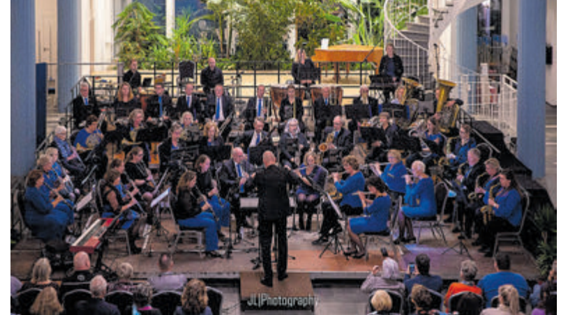
Aalsmeers Harmonie in de burgerzaal.