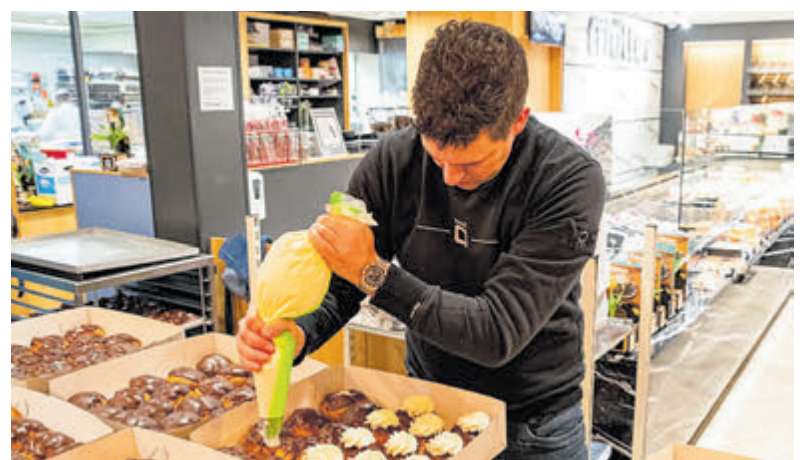
Moorkoppen maken in de bakkerij aan de Stationsweg.

om mindervalide sporters (financieel) te steunen. Bestellen als bedrijf is nog mogelijk en natuurlijk kunnen particulieren ook trakteren en doneren of zelf genieten van deze overheerlijke, dagelijks vers gemaakte, lekkernij. De MmMorekop actie duurt tot en met zaterdagmiddag 8 februari. De moorkoppen zijn te koop (en te bestellen) in de winkel en via www.mullerbanket.nl .