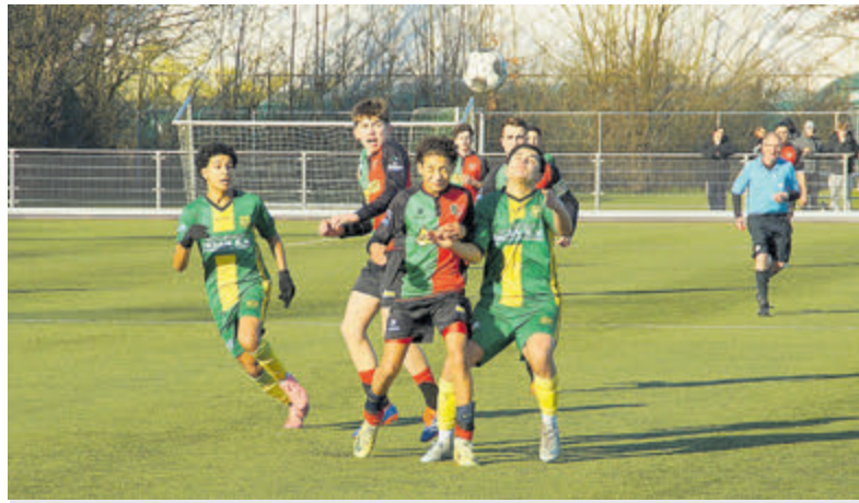
FCA-speler Aaronn en tegenstander koppen liever met hun ogen dicht. Tekst en foto: Ruud Meijer

Super Handball League Voor Heren 1 begint aanstaande zaterdag 8 februari de tweede periode van de Super Handball League. Aalsmeer gaat naar Wezel in België om het vanaf 20.15 uur op de te nemen tegen Visé.