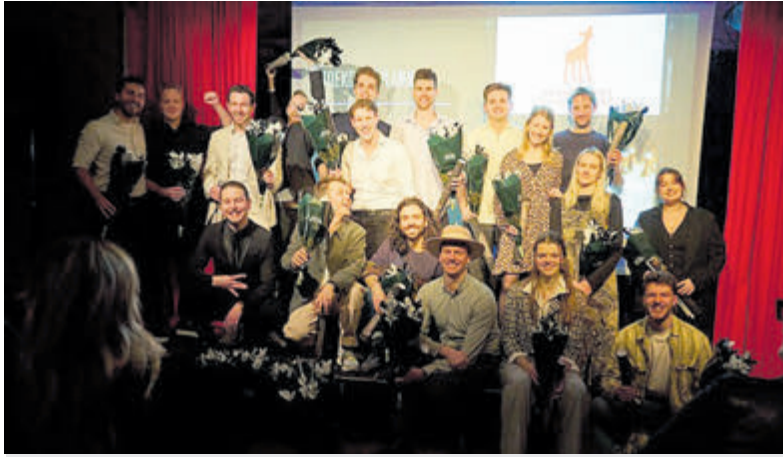
De filmcrew van De Grootmeester.