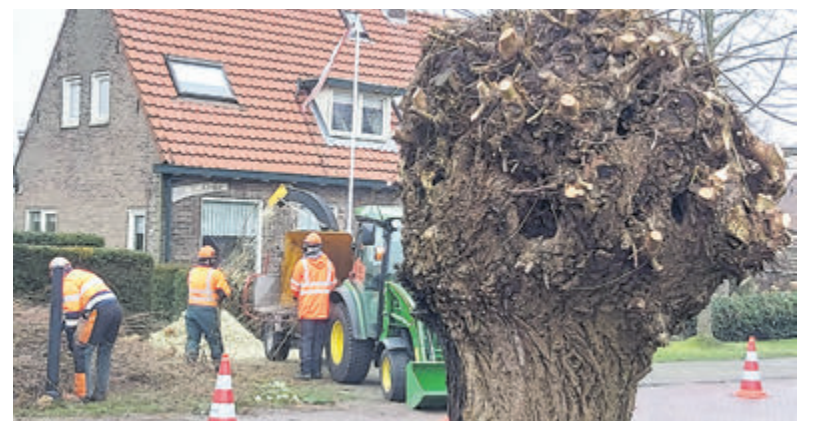
Meerlanden versnipperd de wilgentakken.

"Het is prachtig om te zien hoe onze wijnactie niet alleen mensen samenbrengt, maar ook bijdraagt aan een doel dat zo belangrijk is voor Aalsmeer", aldus Arend Bon. Het hospice is relatief nieuw in de regio en voorziet in een duidelijke behoefte, met al een wachtlijst sinds de opening in 2024.