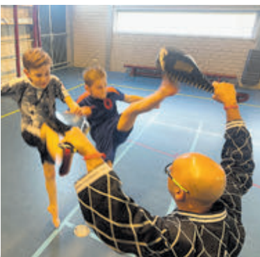
Kickboksen en taekwondo bij Chung Do Kwan.

Kinderen die nieuwsgierig zijn of de mix van kickboksen en taekwondo bij hen passen, kunnen twee gratis proeflessen volgen. De kernwaarden van Chung Do Kwan zijn helder: "Vechtsport is meer dan techniek en conditie, het is een middel om zelfvertrouwen, discipline en doorzet-