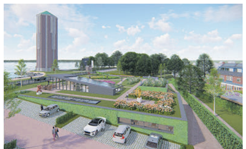
Impressie van het museum na de verbouwing en opwaardering.