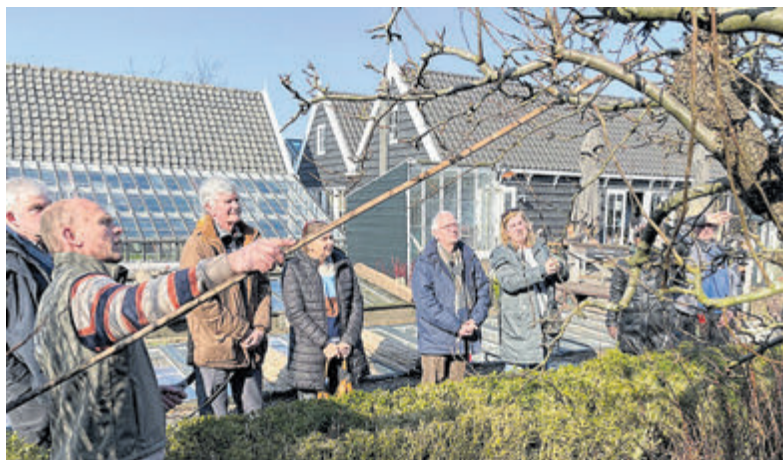
Snoeicursus en snertwandeling op de Historische Tuin.

viteitencommissie van de Binding (het BEAU). Deze commissie bestaat uit een groep enthousiaste vrijwilligers die activiteiten organiseert voor kinderen, jongeren, en (jong)volwassenen in Aalsmeer om sociale verbinding te stimuleren. Deelname aan BEAU'tje is gratis. Meer weten of inschrijven? Ga naar www.debinding.nl/activiteiten/beautje/ of neem contact op via beau@debinding.nl .