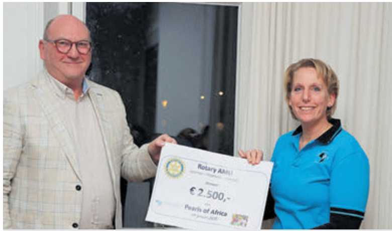
Cheque voor stichting Pearls of Africa van Rotary AMU.