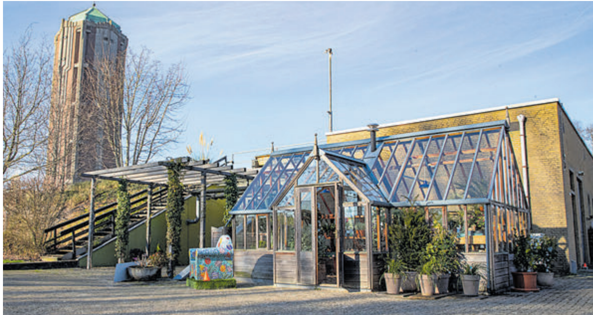
Het Flower Art Museum in de waterkelder aan de Kudelstaartseweg.