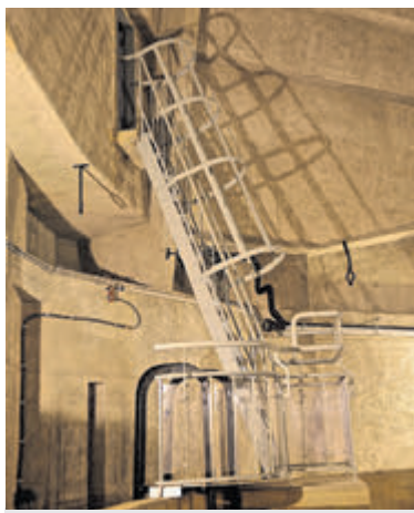
De trappen naar de top in de watertoren.

bezoek van groepen voor de escape activiteit van Turf. De ruimte van de begane grond en de eerste verdieping kunnen gewoon gebruikt worden tijdens de broedperiode. Kijk voor meer informatie op www.aalsmeer-watertoren.nl .