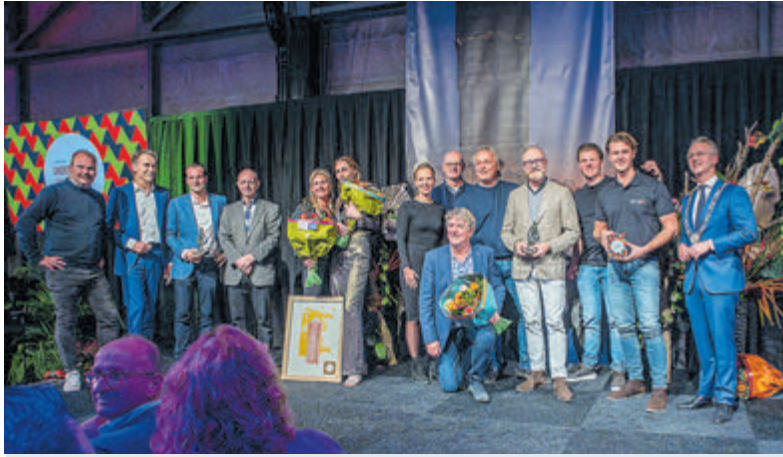
Alle winnaars in 2023.