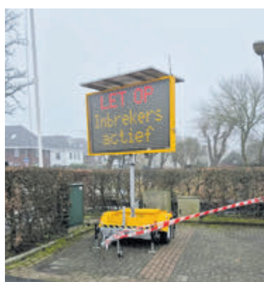
Waarschuwbord gemeente: Inbrekers, let op!

auto altijd op slot, deuren en ramen, en parkeer als dit mogelijk is de auto op een goed verlichte plek, bij voorkeur in het zicht van omliggende woningen. Vreemde of verdachte situaties kunnen, graag zelfs, gemeld worden via www.meldmisdaadanoniem.nl of bel de politie via 0800-8844 (bij spoed 112). Op de website van de politie ( politie.nl ) meer informatie en tips om inbraken te voorkomen.