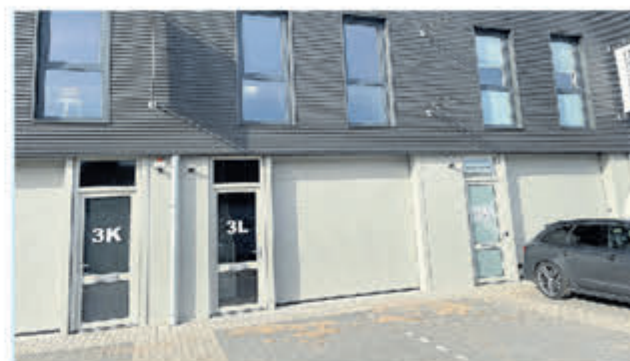
Zuid-Afrikaweg 3L Aalsmeer Bedrijfsunit