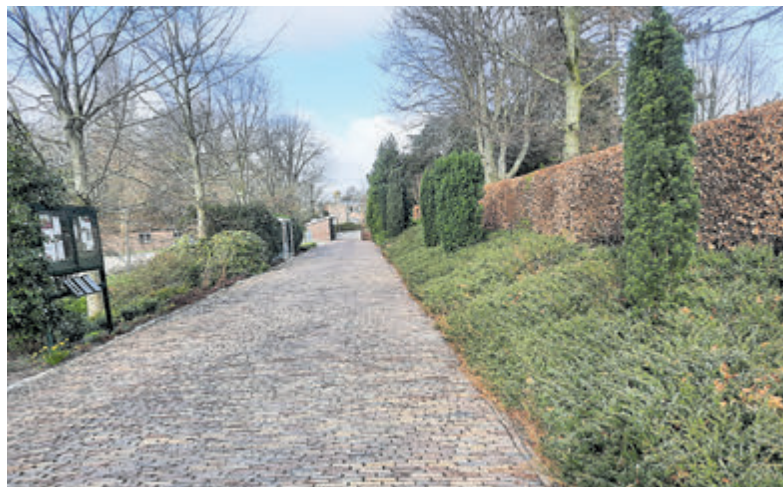
De algemene begraafplaats Aalsmeer aan de Ophelialaan.