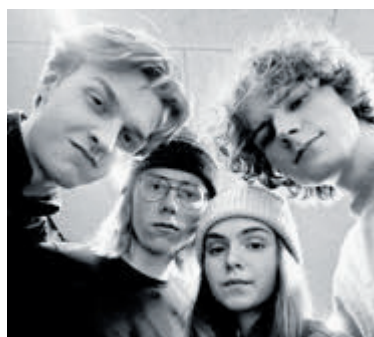
Indie rockband Kaseto, een van de vier bands in N201 zaterdag.