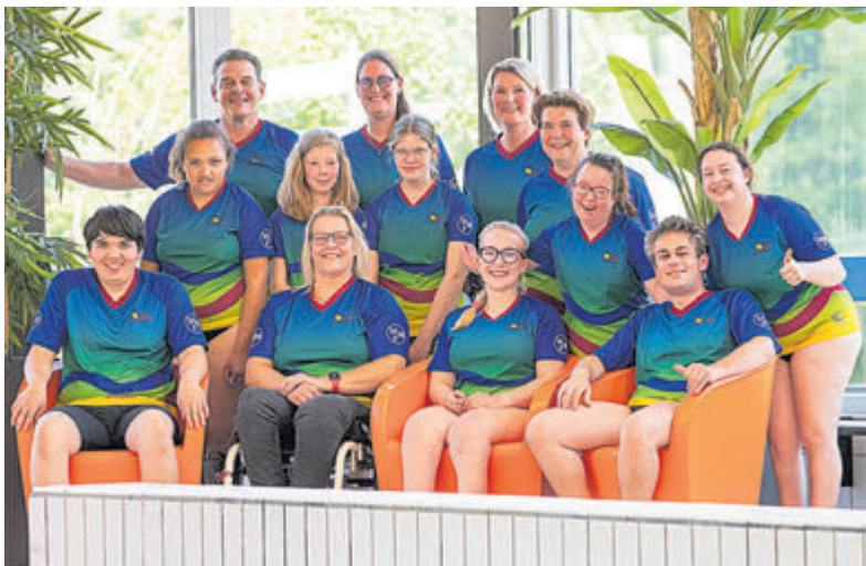
Het complete zwemteam van Stichting Meer Armslag Aalsmeer, klaar voor de jubileumeditie van de 'Lenie van der Meer Bokaal'.

einde van de wedstrijd wordt een klassement opgemaakt en worden de prijzen uitgereikt. Tot slot worden de beste zwemmers (dames en heren) bekroond met de Lenie van der Meer Bokaal. Door de gezwommen tijden om te zetten naar FINA- of IPC-punten kan de beste zwemmer worden aangewezen, ongeacht of er sprake is van een beperking. Lenie van der Meer was de oprichter en drijvende kracht achter Stichting Meer Armslag. Sinds haar overlijden in mei 2013 wordt deze wedstrijd jaarlijks georganiseerd om haar gedachtegoed levend te houden. Stichting Meer Armslag zet zich in voor de financiële ondersteuning van zwemmers met een beperking en maakt het mogelijk dat zij hun sport kunnen blijven beoefenen. Naast de zwemmers die Stichting Meer Armslag ondersteunt, hebben ook diverse andere zwemverenigingen zich ingeschreven. Het belooft opnieuw een spannende en sportieve middag te worden. Iedereen is van harte welkom om de zwemmers aan te moedigen! De wedstrijd vindt plaats in zwembad De Waterlelie en begint om 14.00 uur. Meer informatie over Stichting Meer Armslag en de wedstrijd is te vinden op de website: www.meerarmslag.nl .