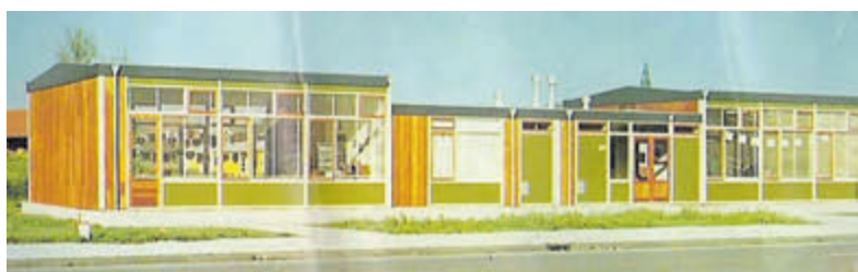
Het oude schoolgebouw van de jarige OBS Kudelstaart.

tevens de opening van het nieuwe seizoen op de Tuin. Tijdens het Seringenweekend wordt in het museum een 'showroom' ingericht met vele bloeiende soorten, afkomstig van kwekers uit Aalsmeer en van de Tuin zelf. Dit is zeker een prachtig gezicht! Ook zijn er dit weekend onder andere rondleidingen, demonstraties seringen enten en (historische) films over de seringenteelt. Zolang de voorraad strekt zijn er ook bossen bloeiende seringen te koop. Natuurlijk is er op de Historische Tuin nog meer te zien, een wandeling door de kassen en tuin is in elk seizoen een mooie ervaring. Het museum is tijdens het Seringenweekend dagelijks open van 10.00 tot 16.30 uur. De normale entreprijzen zijn van toepassing, Museumkaarthouders en donateurs hebben vrij entree. De Historische Tuin is gevestigd aan het Praamlein in het Centrum. Meer informatie: www.historischetuinaalsmeer.nl .