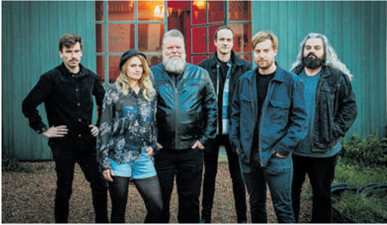
De Belgische band The 925 komt rocken in Bacchus.