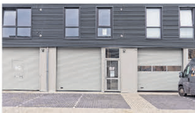
Zuid-Afrikaweg 8 F Aalsmeer Bedrijfsunit