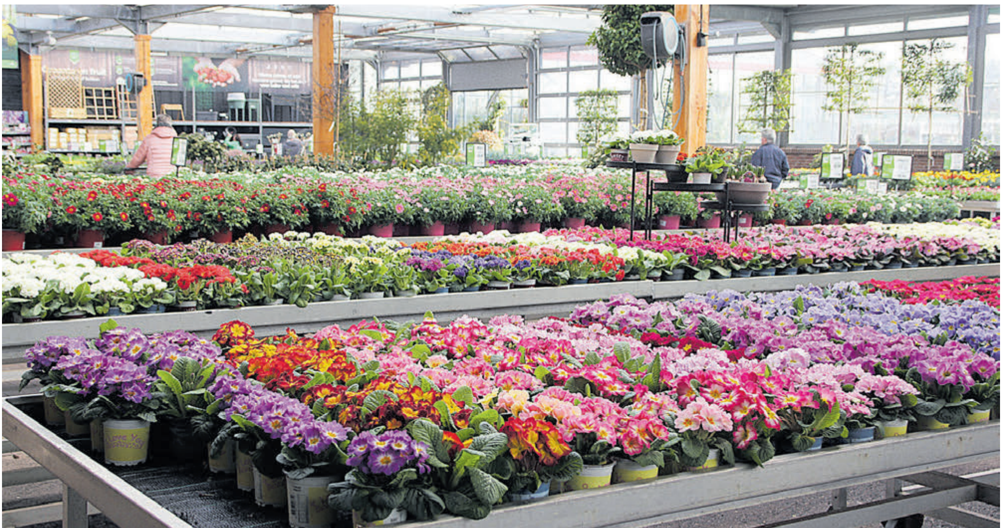
Kleuren brengen vrolijkheid in huis en tuin