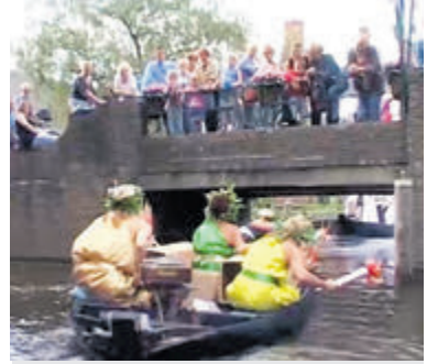
Pramenrace in 2004, de achttiende editie.

Aalsmeer - De film van de maand april is een samengestelde film. Allereerst de film 'Praag Olympics' uit 2004 en als tweede 'Afzwemmen in de VIBA' uit 1969. 'Praag Olympics' gaat over de achttiende pramenrace en is gefilmd door Jaap Romeijn en Jan M. Jongkind. De race wordt uitgebreid in beeld gebracht, te beginnen bij de medische controle, de warming-up en het buffet. Vervolgens is de start aan de Pontweg te zien en de race zelf door de Aalsmeerse wateren. En natuurlijk worden de diverse opdrachten onderweg ook vastgelegd. Afgesloten wordt met de prijsuitreiking op het Praamplein. Er komen veel mensen in beeld die hebben meegedaan of de Pramenrace hebben gevolgd vanaf de wal of het water. 'Afzwemmen in de Viba' is de tweede film. Hierin worden Jaap en Janny van der Geest gevolgd op hun fiets van Uiterweg 16 naar het zwembad aan de voet van de watertoren. Vader Guus filmt alles tot aan het afzwemmen. De film is beschikbaar gesteld door Janny van der Geest. Dick P. van der Zwaard heeft beide films opgenomen in het filmarchief van Stichting Historisch Aalsmeer. Totale duur is 40 minuten. Oud Aalsmeer vertoont iedere maand een historische film op de website www.stichtingoudaalsmeer.nl en aan het bekijken zijn geen kosten verbonden.