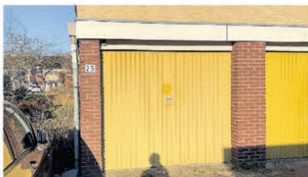
Haydnstraat 23N Aalsmeer Garagebox