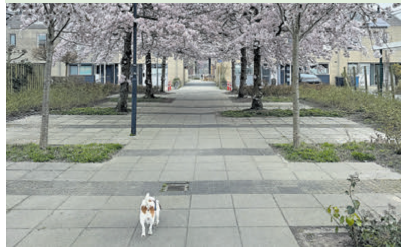
Bloesempark in Kudelstaart, Teun wist het te waarderen.