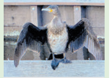
Aalscholver op oude steigerbalk.