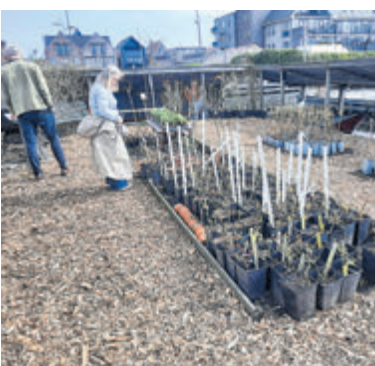
Tekst en foto: Jacqueline Kristelijns

Aalsmeer - De Historische Tuin hield afgelopen zaterdag 22 maart haar jaarlijkse verkoopdag en qua weer was een