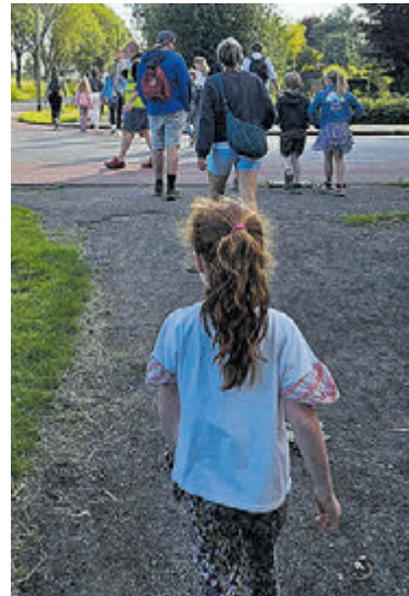
Wandelen door Aalsmeer tijdens de Avond Vierdaagse.