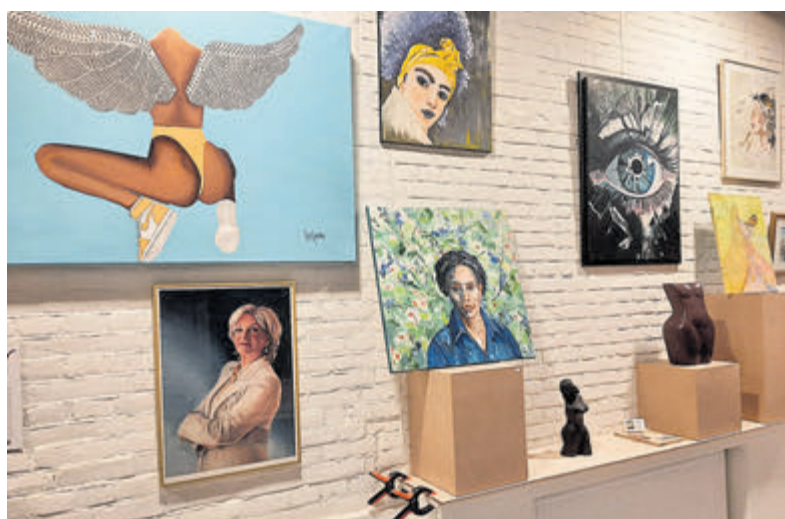
Deel van de expositie ‘Vrouw: in beeld gevangen’.

De focus in de pilotvestiging in Kudelstaart ligt op boeken voor kinderen van 0 tot 4 jaar, met een kleine collectie voor 4 tot 10 jaar. Daarnaast kunnen alle bewoners boeken uit de volledige collectie van Bibliotheek Amstelland reserveren via de website en deze ophalen in Kudelstaart. Wie liever zelf tussen de boeken wil snuffelen, is welkom in de bibliotheek in De Oude Veiling in de Marktstraat in het Centrum van Aalsmeer.