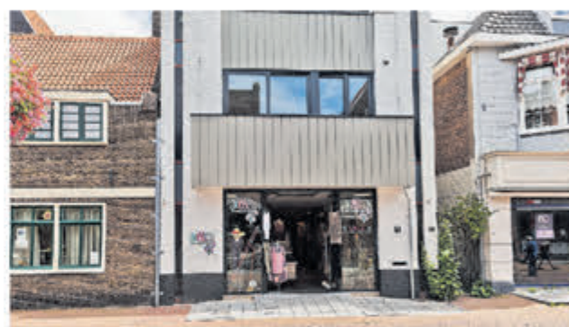
Zijdstraat 61 Aalsmeer Winkelruimte