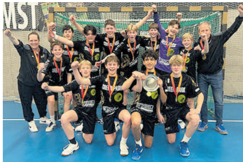
De toppers van HC1 van HV Aalsmeer. Nederlands kampioen!