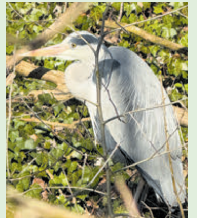
Reiger, verscholen tussen takken.