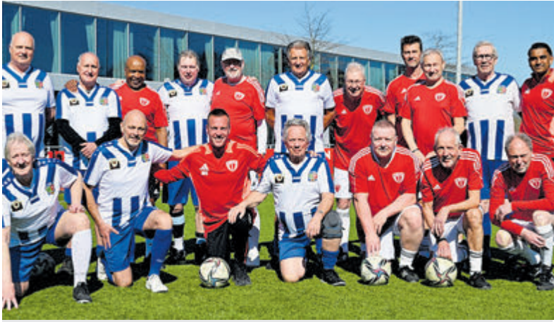
De walking footballers van FC Aalsmeer en Only Friends.