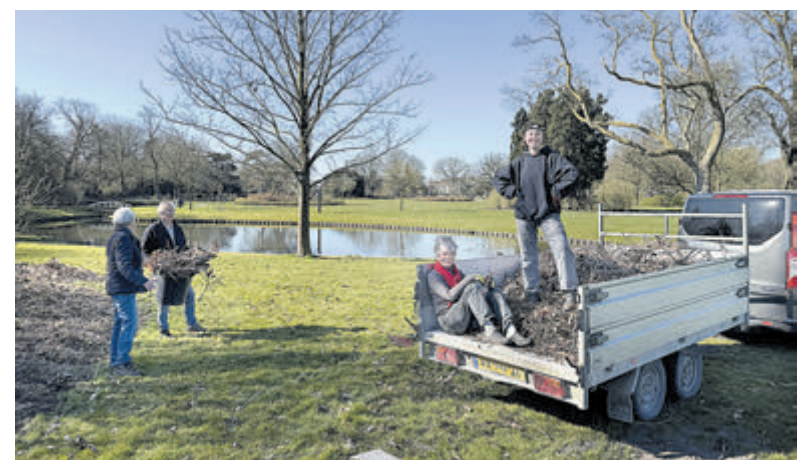
De oudste en jongste mochten even uitrusten op weer een volle aanhangwagen tijdens de voorjaarsbeurt voor het Seringenpark.

worden. Kruiwagens vol grond werden naar de plantvakken gereden en daar verdeeld. Aan het eind van de twee dagen was alles keurig aangeharkt en waren de bankjes en zelfs de vuilnisbakjes schoongeboend. De Stichting Behoud Seringenpark Aalsmeer en hovenier Harmen zijn de harde werkers dan ook heel dankbaar voor hun inzet. Het is mooi om te zien dat jong en oud zich willen inzetten zodat bezoekers weer kunnen genieten van 'hun' park.