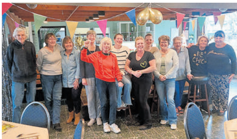
De initiatiefnemers en vrijwilligers van Buurtmaaltijd Hornmeer.