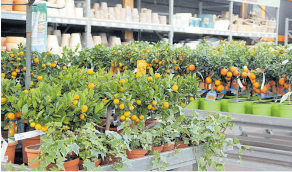
De mini sinaasappelboompjes geven een maxi opbrengst

De vogels fluiten, de bollen schieten uit de grond. Er is geen houden meer aan. Het voorjaar dient zich aan. Laat maar komen. Wereldtuin Global Garden is er klaar voor. Het nieuwe seizoen wordt verwelkomd van 29 maart tot en met 6 april.