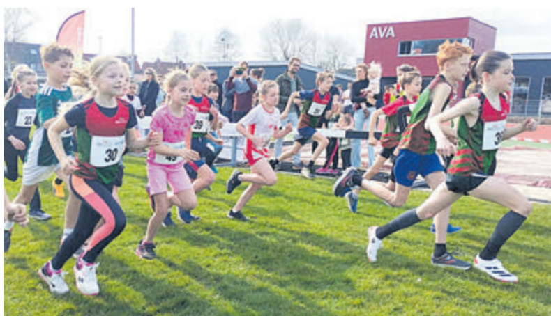
De tweede serie van de AVA Cross vlak na de start.