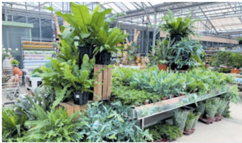
Varentafels bij Raadschelders.