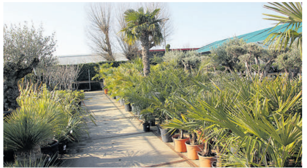
Mediterrane groeiers voor het Nederlandse klimaat

Voor meer informatie over de start van het nieuwe seizoen: www.globalgarden.nl .