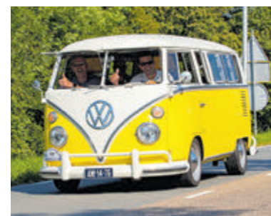
Een oldtimer Volkswagenbus bij Aalsmeer Roest Niet.

niet te organiseren." Eikelenboom gaat verder: "Gelukkig is het nieuwe parkeerterrein zo goed als zeker voor 1 juni klaar om dit jaarlijkse evenement weer te faciliteren. Wij hebben er in ieder geval al heel veel zin in om alle oldtimers en hun trotse eigenaars welkom te mogen heten en wel op een mooie, vlakke locatie!" De inschrijving voor de 120 kilometer lange toerit 'Aalsmeer Roest Niet' start in de tweede week van april. Op de site www.aalsmeerroestniet.nl is verdere informatie betreffende deelname en inschrijving te vinden.