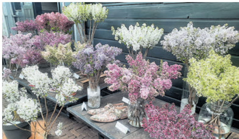
Seringenweekend in de Historische Tuin.

precisielandbouw en duurzame energie zorgen voor een efficiënte oogst en kan friet van eigen bodem geproefd worden. Bij Firma Duijnsveld en HPD Potplanten wekken duizenden zonnepanelen energie op, terwijl regenwater en biologische gewasbescherming bijdragen aan een duurzame paprikateelt en rozenkweek. Ubink en Raadschelders Varens laten zien hoe ze moderne kassen cactussen, varens en andere planten optimaal laten groeien. En bij JS Creations zijn er bijzondere plantenarrangementen te bewonderen. Voor kinderen zijn er volop activiteiten: schminken, glittertattoos, een interactief veilingspel, spellen en workshops zoals plantjes zaaien en plantenbakjes maken. Een bijzondere kans om de veelzijdigheid van deze groene regio te beleven. Er is een officiële opening van Kom in de Kas Aalsmeer zaterdag om 9.00 bij Raadschelders Varens, bezoekers zijn dan ook van harte welkom. Kom in de Kas (gratis) bezoeken kan deze 5 april tot 16.00 uur. De bedrijven die deelnemen zijn herkenbaar aan de Kom in de Kas vlaggen en zijn gevestigd aan de Hoofdweg en Mijnsherenweg in Kudelstaart en Achterweg in De Kwakel.