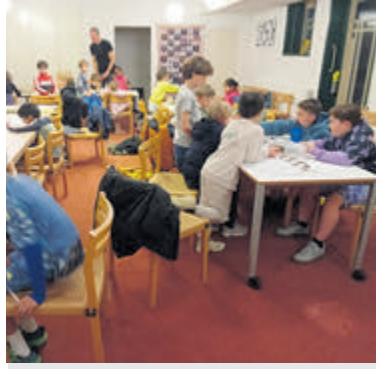
Gezellige drukte bij het jeugdschaken van AAS op vrijdag.