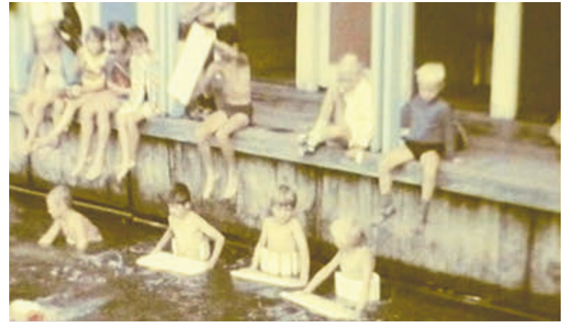
Afzwemmen in de Viba, het zwembad nabij de watertoren.

De film wordt ook tweemaal op TV Aalsmeer uitgezonden. Vrijdag 11 april is de eerste vertoning vanaf 11.00 uur. Een dag later, zaterdag 12 april, is de film nogmaals te zien vanaf 13.00 uur. De uitzendingen worden vooraf gegaan door een inleidend interview met een medewerker van Oud Aalsmeer op zaterdag 5 april door presentator Jan van Veen is te beluisteren op zowel Radio als TV Aalsmeer tussen 12.00 en 13.00 uur. TV Aalsmeer is bij abonnees van Caiway te vinden op kanaal 12 en bij gebruikers van KPN/XS4ALL/Telfort op kanaal 1389. Meer informatie: www.radioaalsmeer.nl De film van de maand is verder te zien in de veilingzaal van de Historische Tuin op zondag 20 april om 15.00 uur.