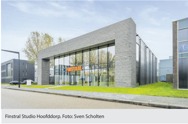
Finstral Studio Hoofddorp.