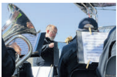
Flora tijdens een cultureel evenement.

variatie. Wees welkom! Vanaf 19.30 uur staan de deuren open en het concert begint om 20.00 uur. Kaarten à 15 euro per persoon inclusief pauzedrankje zijn verkrijgbaar via de website www.muziekverenigingflora.com of (indien nog voorradig) te koop aan de deur. Kinderen tot 12 jaar hebben gratis toegang.