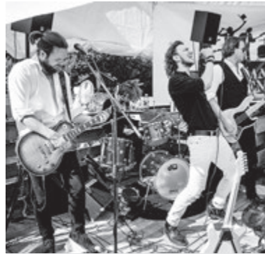
Voorprogramma wordt verzorgd door Dynamic Gentlemen.