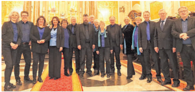
Het vocaal ensemble Corde Vocali geeft a capella-concert.