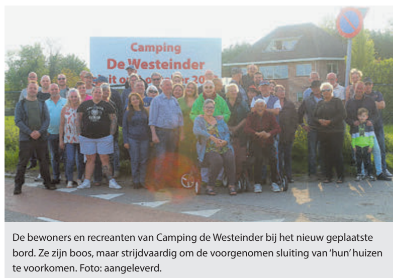
De bewoners en recreanten van Camping de Westeinder bij het nieuw geplaatste bord. Ze zijn boos, maar strijdvaardig om de voorgenomen sluiting van 'hun' huizen te voorkomen.