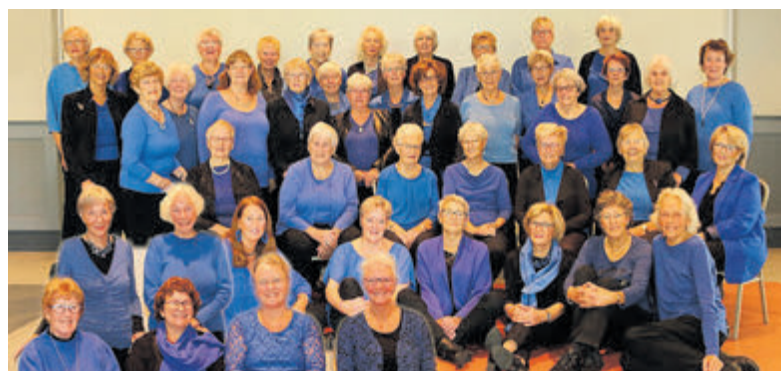
De leden van Vrouwenkoor Vivace.

Nieuwe leden zijn van harte welkom, misschien iets voor u/jou? Kom vrijblijvend eens meezingen of luisteren tijdens een repetitie-ochtend in het Kudelstaartse Dorpshuis.