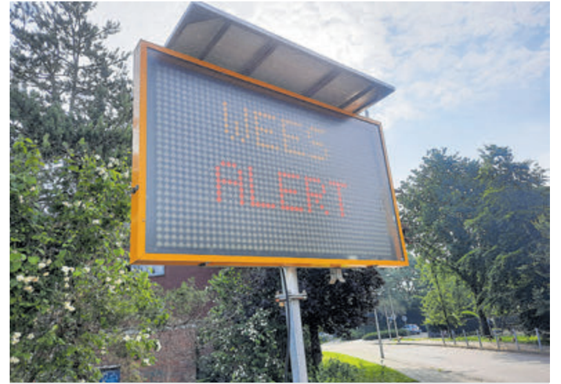
Het waarschuwingsbord bij de Gerberastraat.