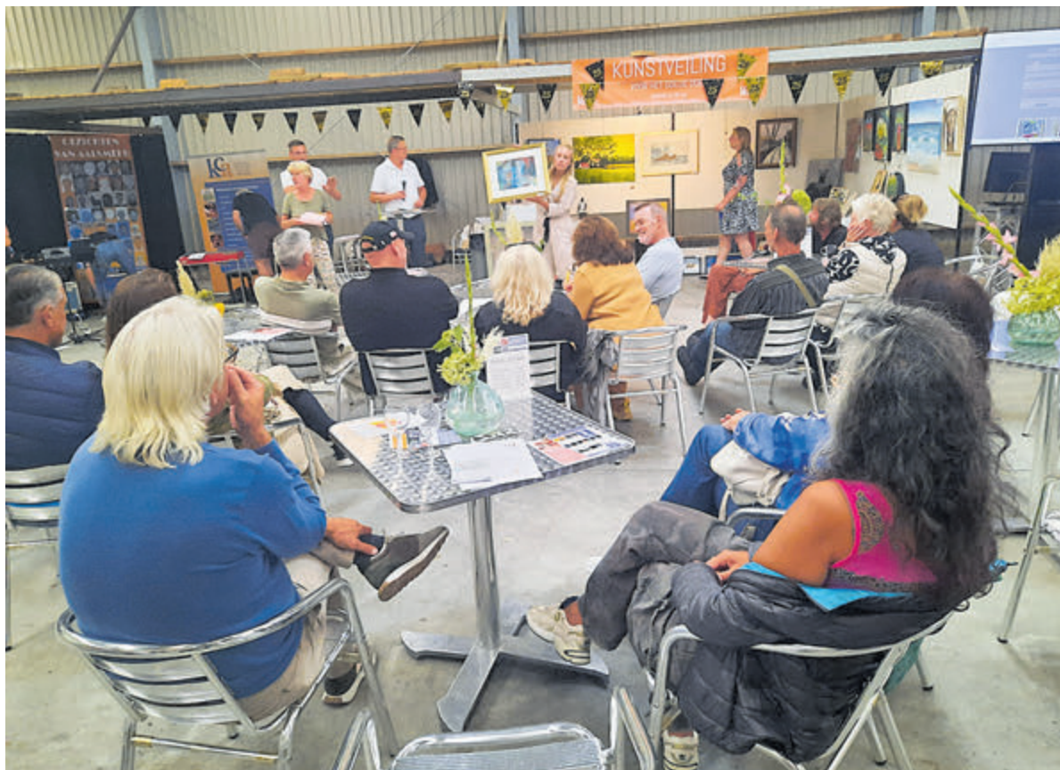
De Kunstroute start en eindigt al vele jaren in de loods van Jachthaven Otto aan de Uiterweg. Dit jaar vindt bij de aanvang de uitreiking van de Cultuurprijs plaats, vorig jaar (2023) was hier een kunstveiling ter afsluiting.