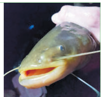
Meervallen in Westeinder zijn beschermd. Onzin, zegt Maarten.