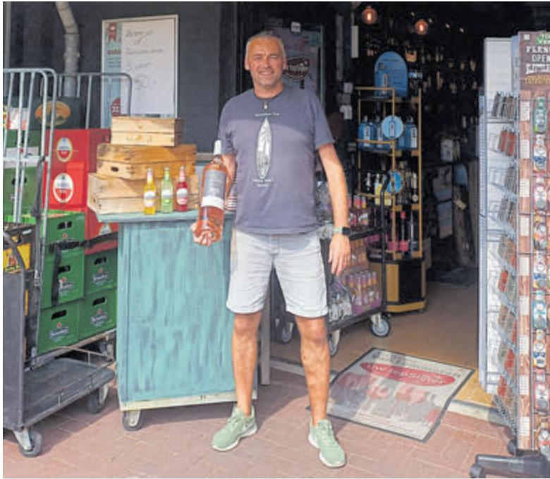
Slijterij Van Lammeren nu ook Bloemenzegelwinkelier.