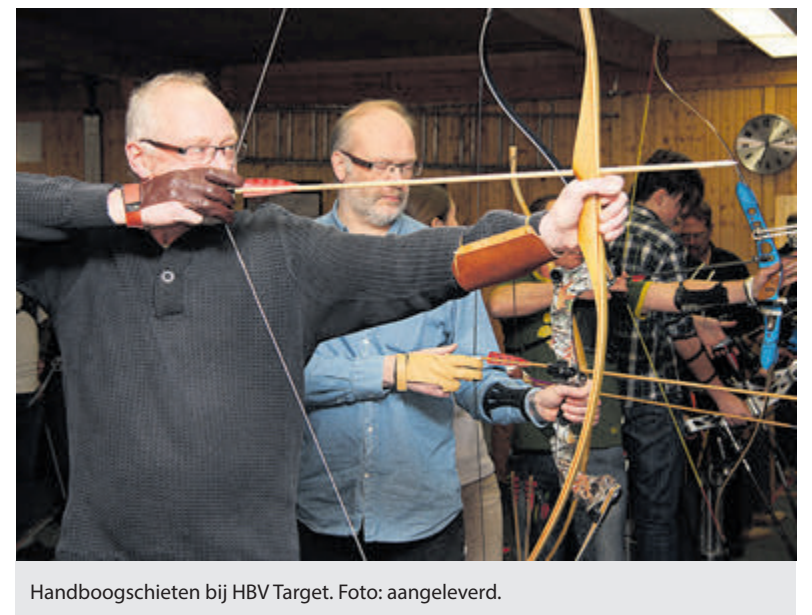
Handboogschieten bij HBV Target.