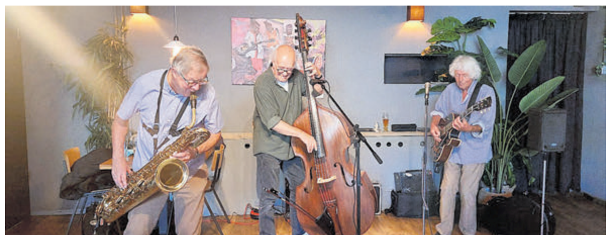
Trio Petit komt optreden bij My Generation.