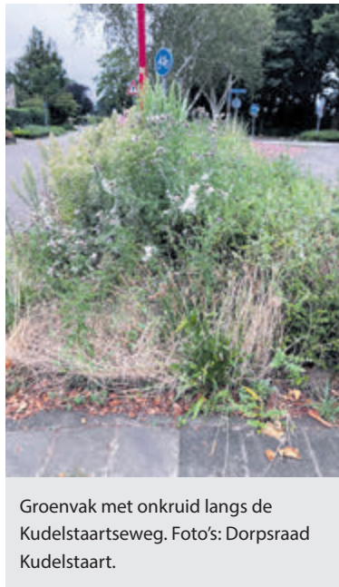
Groenvak met onkruid langs de Kudelstaartseweg.

Deze werkzaamheden moeten worden uitgevoerd voordat Waternet kan starten met het versterken van de dijk langs de Kudelstaartseweg door middel van het slaan van damwandprofielen. De werkzaamheden voor het leggen van kabels en leidingen waren in april afgerond en sinds die tijd werd er geen onderhoud uitgevoerd aan deze plantvakken, hetgeen betekende dat het onkruid er een halve meter hoog stond, een armoedig gezicht. Nadat de Dorpsraad hier al aandacht voor had gevraagd en er ook vragen werden gesteld in de gemeenteraad is deze week het Aalsmeerse bedrijf Van Wieringen gestart met het onkruidvrij maken van de plantvakken. Vervolgens zal er gras ingezaaid worden. Pas na afronding van de