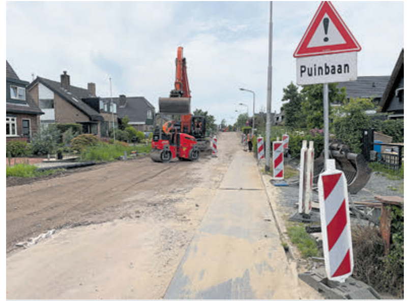
Werkzaamheden Uiterweg bij de Kees Hansenbrug.