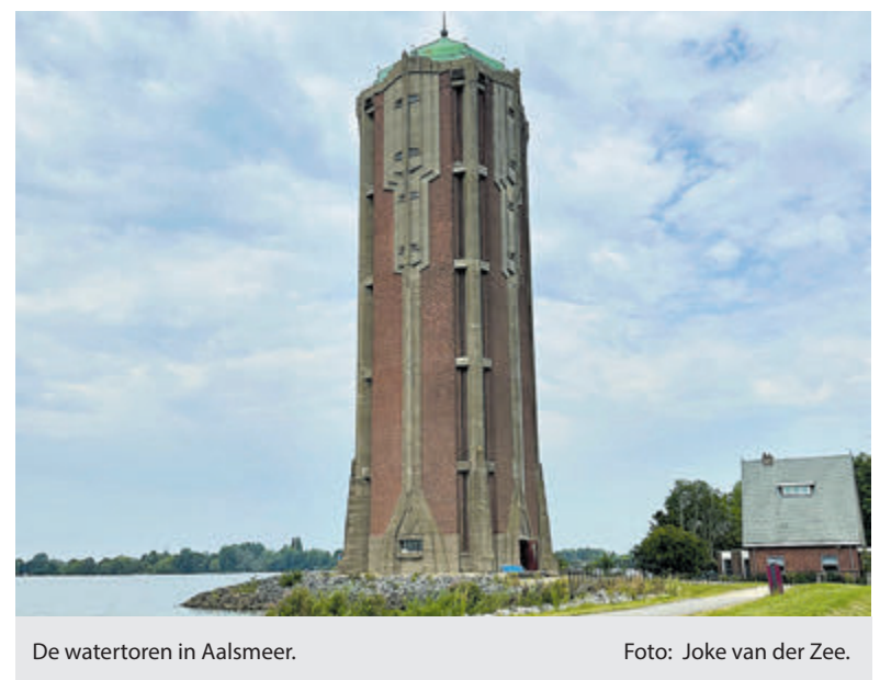
De watertoren in Aalsmeer.

De watertoren aan de Westeinder bezoeken kan deze maand augustus iedere zondag tussen 13.00 en 17.00 uur. De klim naar boven kost € 1,- voor kinderen en € 2,- voor volwassenen.