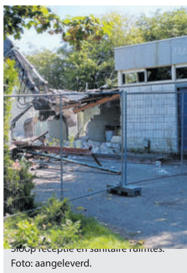
Sloop receptie en sanitaire ruimtes.

"Wij laten ons niet zomaar weggagen. We blijven vechten om onze woonplek te behouden", besluit Anneke namens alle bewoners en recreanten van Camping de Westeinder.