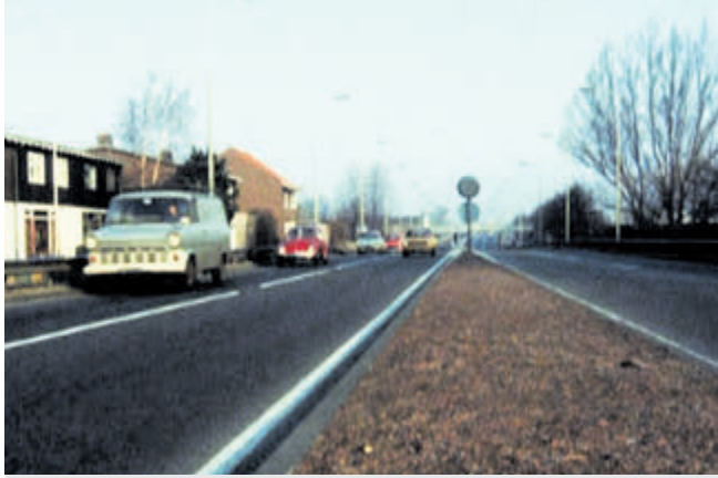
De Burgemeester Kasteleinweg in 1976.