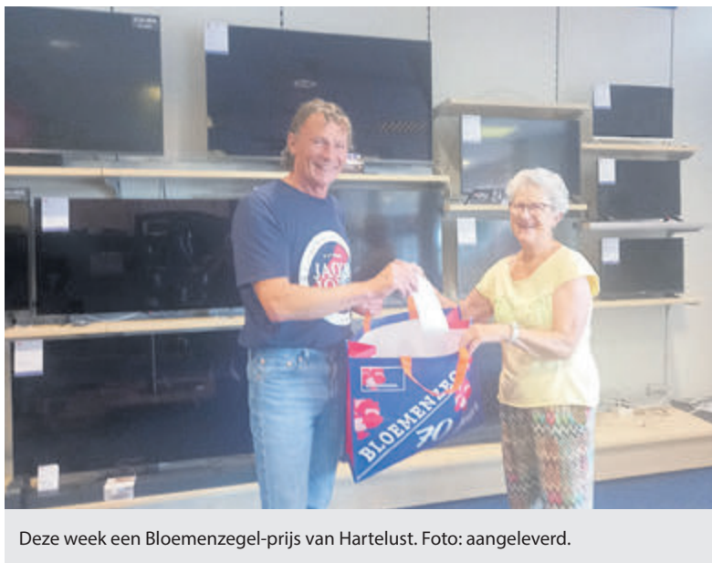
Deze week een Bloemenzegel-prijs van Hartelust.

Bloemenzegels sparen loont zeker de moeite, al is het maar voor 2 euro korting met een volle spaarkaart. Bovendien maken spaarders kans op mooie prijzen, zoals bij de actie 'Bon in de ton' die is verlengd tot eind augustus. Vraag om bloemenzegels, u heeft er recht op.