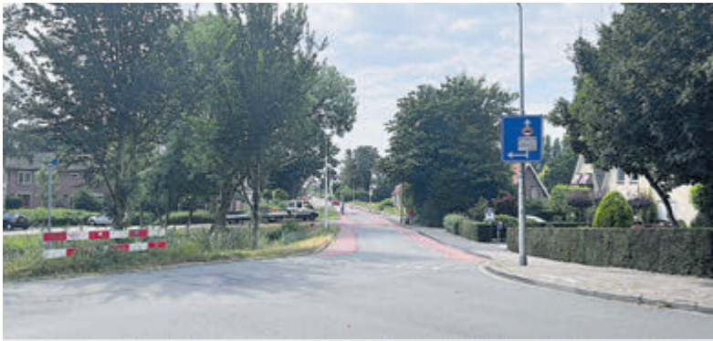
Start werkzaamheden op de Bilderdammerweg.

Er zijn ook werkzaamheden op het kruispunt Robend en de Graaf Willemlaan. Hier wordt een fietsoversteek gemaakt en wordt de weg geasfalteerd. Voor deze werkzaamheden is van maandag 26 augustus tot vrijdag 13 september het kruispunt afgesloten voor verkeer. Er zijn omleidingsroutes.