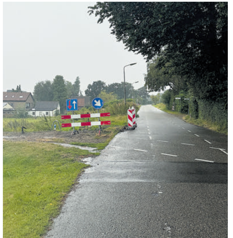
Herstellen kabels en leidingen op Stommeerkade.

niet te voorkomen. De rijbaan wordt afgesloten ter hoogte van Stommeerkade 51. Stommeerkade 31 tot en met 47 zijn bereikbaar via de Burgemeester Kasteleinweg en de panden en woningen op de nummers 51 tot en met 79 via de Opheliaan. Fietzers worden omgeleid via de Ophelialaan, Bielzenpad, Wissel of Baanvak. Hulp - en nooddiensten kunnen alle huisnummers bereiken.