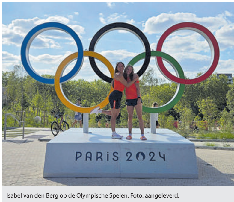
Isabel van den Berg op de Olympische Spelen.

Wil je lekker fit worden en beginnen met hardlopen? Of heb je al eerder hardgelopen en wil je het weer oppakken? Geef je dan op voor de zesweekse beginnerscursus die op zaterdagochtend 28 september bij AVA in de Sportlaan van start gaat. Kijk voor meer informatie op de website van AV Aalsmeer.