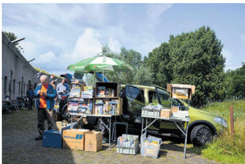
Verkoop modelbouwdozen en modellen.

expositie in het Crash Luchtoorlog- en Verzetsmuseum '40-'45 te bekijken. De toegang tot het Crash museum en de kofferbakverkoop bedraagt 5 euro voor volwassenen en kinderen ouder dan 12 jaar, 2,50 euro voor kinderen van 7 tot en met 12 jaar. Kinderen jonger dan 7 jaar, donateurs, IPMS leden en veteranen hebben gratis toegang. Het CRASH Luchtoorlog- en Verzetsmuseum '40-'45 is gevestigd in het Fort bij Aalsmeer een de Aalsmeerderdijk 460 in Aalsmeerderbrug (bij Rijsenhout) en is geopend op zaterdag en iedere tweede zondag van de maand van 10.30 tot 16.30 uur. Kijk voor meer informatie over het museum en het werk van het Crash Luchtoorlog en Verzetsmuseum '40-'45 op www.crash40-45.nl .