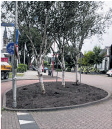
Groenvak langs Kudelstaartseweg onkruidvrij gemaakt.

Kudelstaart - Langs de Kudelstaartseweg waren een aantal heestervakken leeggehaald voor het verplaatsen van kabels en leidingen.