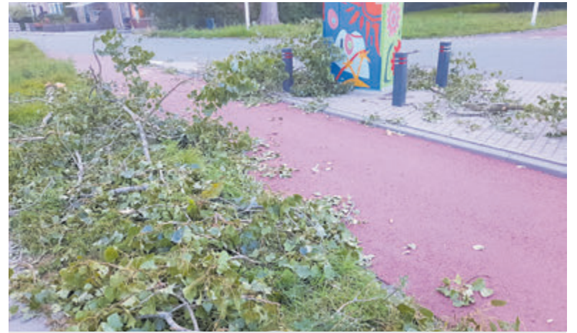
Dikke takken van bomen gewaaid in de 2e J.C. Mensinglaan.

reactie. "Het waaide zo hard, er vlogen bladeren door de lucht en door de hagel was het zicht slecht." Degenen die de nacht in diepe slaap hadden doorgebracht, werden in de ochtend vol verbazing wakker. Overal bladeren en takken en zijn dat nu echt hagelstenen? Onder andere aan de Aalsmeerderweg heeft een boom de 'orkaan' niet doorstaan, maar meer lagen de wegen vooral bezaaid met (dikke) boomtakken en zag het groen van de blaadjes. Voor zover bekend is er her en der lichte schade in tuinen en aan panden, maar zijn geen personen gewond geraakt. Gelukkig maar!