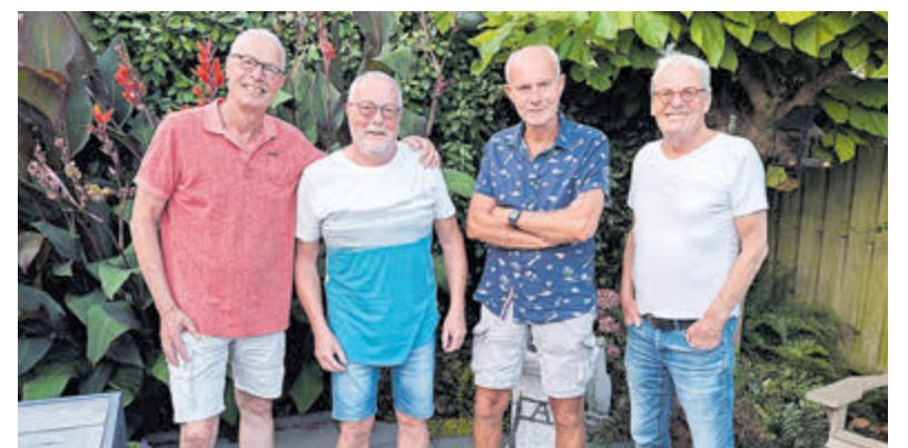
De vier muzikanten van Unit Four.

willen dat graag blijven doen. Vooral ongedwongen plezier hebben is hun motto en dat straalt er bij de heren duidelijk vanaf. Meer over de Unit Four in de 65e aflevering van Music in the Air zondag 1 september op www.meerbode.nl .