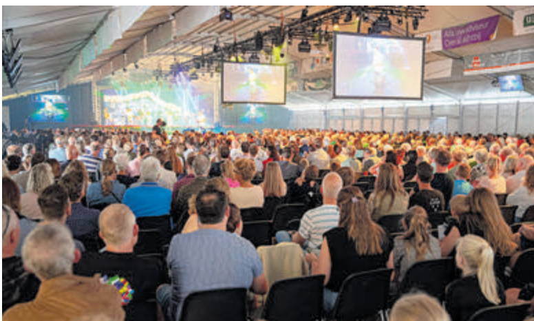
Tentdienst door zes samenwerkende kerken (2023).