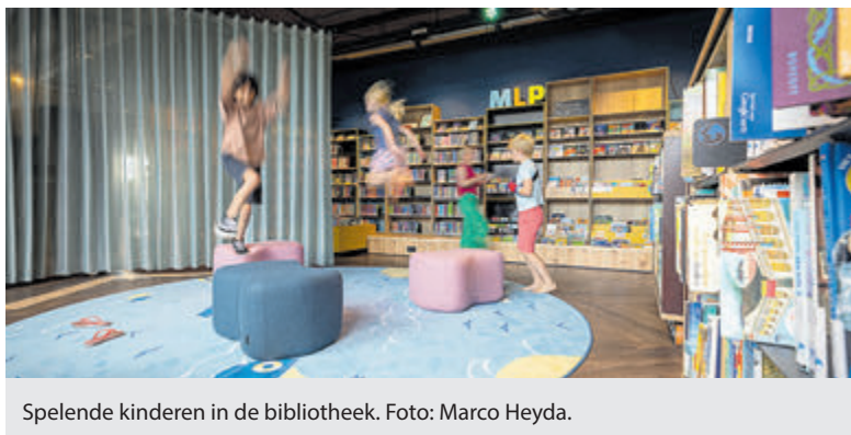
Spelende kinderen in de bibliotheek.

Aalsmeer - Na een zomerstop gaat de Vrouwencirkel Aalsmeer en Kudelstaart weer van start. Het nieuwe seizoen begint op dinsdag 3 september met een Taste & Share van 16.30 tot 20.00 uur in het Parochiehuus aan de Gerberastraat. Er is gelegenheid elkaar te ontmoeten, bij te praten en samen te eten. Alle vrouwen uit Aalsmeer en Kudelstaart, jong en oud, zijn van harte welkom. De toegang is gratis, het is wel de bedoeling dat iedereen iets te eten meeneemt om te delen met de andere aanwezigen. Misschien wel het moment om te trakteren op jouw favoriete baksel en hier samen van te gaan genieten. Traditioneel Nederlands, Indisch, Marokkaans, veganistisch of een ander speciaal dieet, alles is welkom. Misschien ontdek je vanavond wel een recept dat je nieuwe favoriet gaat worden? Of leer je weer een nieuwe kooktruc! In elk geval heb je een gezellige avond samen met andere vrouwen. Leuk om elkaar (beter) te leren kennen. Wil je komen? Stuur een mail naar team.aalsmeer@participe.nu o.v.v. Taste & Share en vermeld in elk geval je naam en je telefoonnummer. De Vrouwencirkel is er speciaal voor vrouwen in Aalsmeer en Kudelstaart die het leuk vinden nieuwe vrouwen te ontmoeten, in een ongedwongen sfeer met elkaar te praten, nieuwe dingen te leren en zich te laten inspireren door verschillende onderwerpen. Meld je ook aan als je op de hoogte gehouden wilt worden van de activiteiten van Participe team Aalsmeer. Meer info op: www.participe-amstelland.nu .