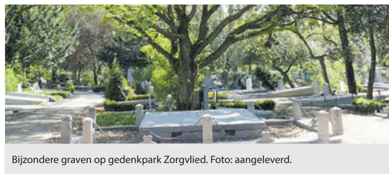
Bijzondere graven op gedenkpark Zorgvlied.

Vermeld in de mail uw/jouw naam en het aantal personen dat wenst deel te nemen aan de rondleiding. Er wordt vervolgens een bevestiging gestuurd. Pas dan is men verzekerd van een plek. Adres Zorgvlied: Amsteldijk 273, in Amsterdam (eerste poort). Verzamelen op het terras achter de witte kantoorvilla.