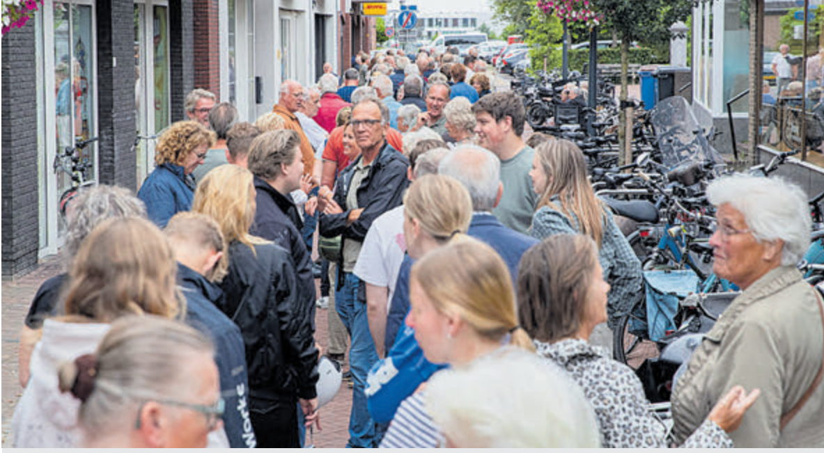
Gezellige drukte in de Zijdstraat voor kaartenverkoop voor het Nostalgisch Filmfestival op 10 september.