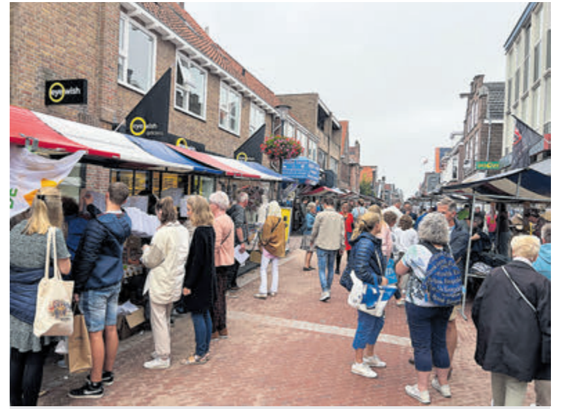
Gezellig druk tijdens de braderie vorig jaar.

Vanaf vrijdagavond 6 september 21.00 uur tot zaterdag 7 september 19.00 uur is er een parkeerverbod in de Marktstraat, Schoolstraat (tussen Dorpsstraat en Steeg Zijdstraat) en de Dorpsstraat (tussen Helling/Zijdstraat). Bewoners en bezoekers van bijvoorbeeld de horeca worden opgeroepen hun voertuig vanaf dit tijdstip elders te parkeren en vanaf zaterdagochtend geen fietsen vast te zetten aan de fietsenstallingen. Dit in