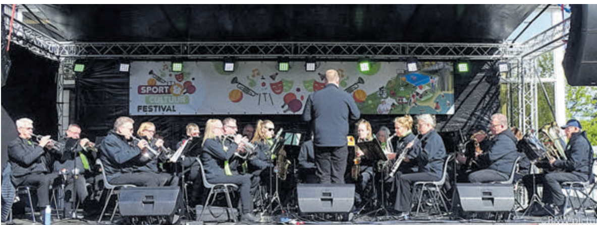
Het orkest van muziekvereniging Flora.

concert op het programma, samen met Aalsmeers Harmonie. Er is voldoende te doen en daarom zijn nieuwe zangers hard nodig. Con Amore is nu nog met ruim dertig man en zou er graag wat nieuwe stemmen bij hebben. Kom langs tijdens de repetitie en zing mee met het Aalsmeers mannenkoor. Elk nieuw lid ontvangt een koorsmoking.