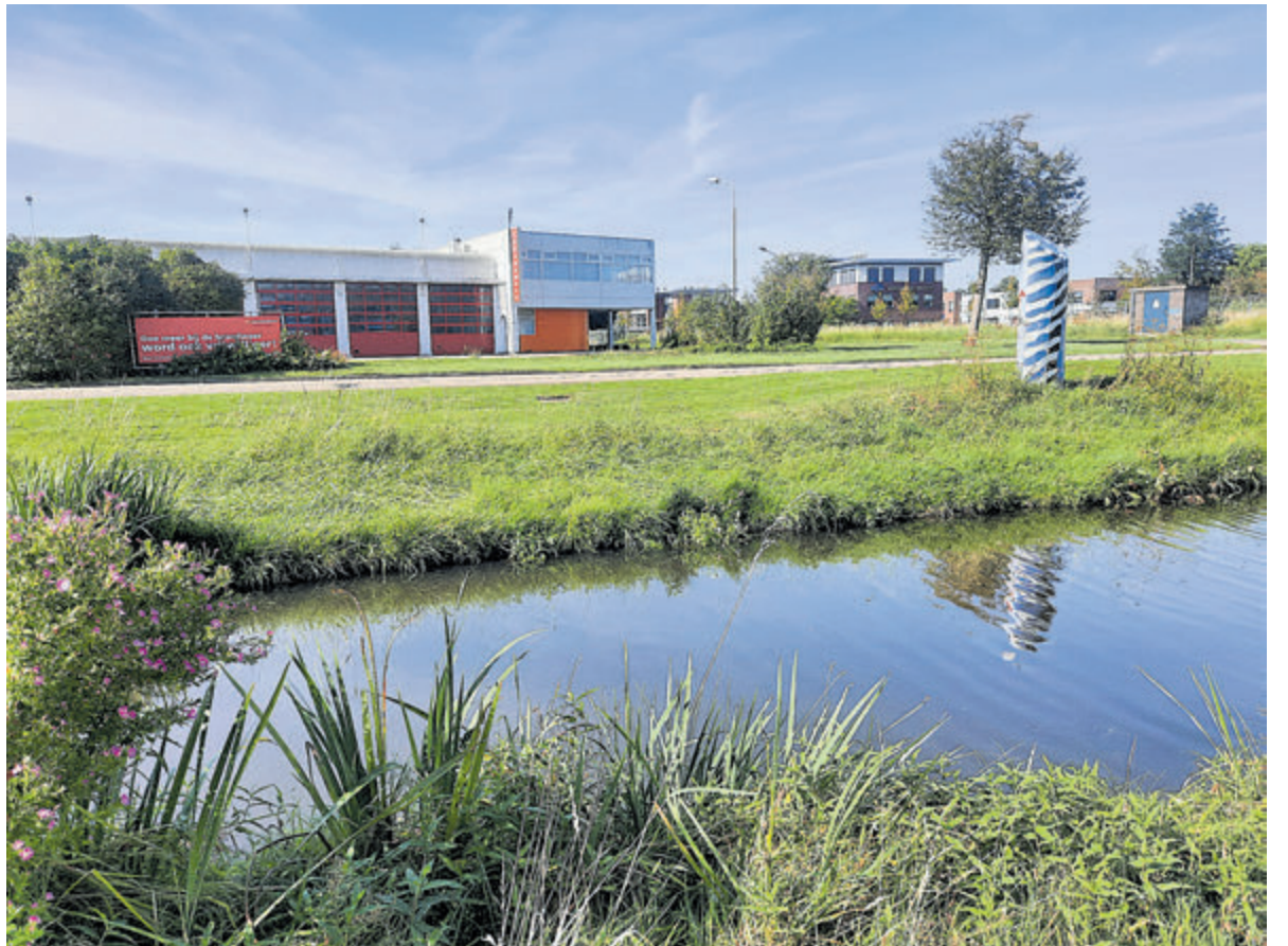
De huidige brandweerkazerne aan de Zwarteweg. Het is vooralsnog de bedoeling dat de nieuwbouw nabij de huidige locatie gaat verrijzen.

Na de 'praatavonden' kunnen de politici zich storten op de komende evenementen, net als natuurlijk alle inwoners. September is feestmaand in Aalsmeer met op de 7e de start met een bruisende braderie in het Centrum en het spectaculaire Vuur en Licht op het Water en de volgende dag, zondag 8 september, de eerste activiteit in de tent op het Praam-plein. Hou er rekening mee dat in de loop van volgende week het Praam-plein omgetoverd wordt tot feestterrein en dat tijdens de Feestweek de markt gehouden wordt op het Raadhuisplein.