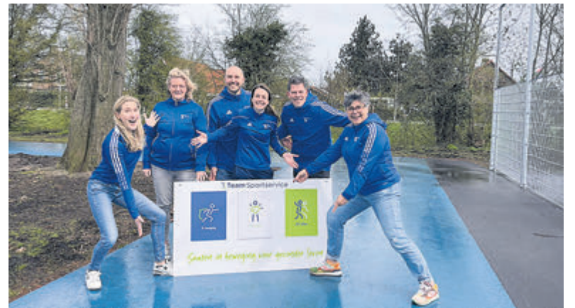
De heren en dames van Team Sportservice Aalsmeer.