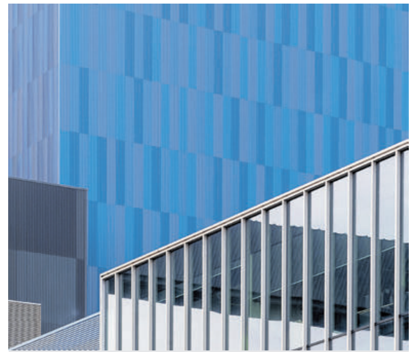
De winnende foto 2023/24 in de categorie kleur, gemaakt door Adrie Kraan.

De jubileumexpositie in het Oude Raadhuis aan de Dorpsstraat 9 wordt aanstaande zaterdag 31 augustus feestelijk geopend om 16.00 uur. Belangstellenden zijn van harte welkom. De foto's bekijken kan tot en met 13 oktober iedere vrijdag, zaterdag en zondag tussen 14.00 en 17.00 uur.