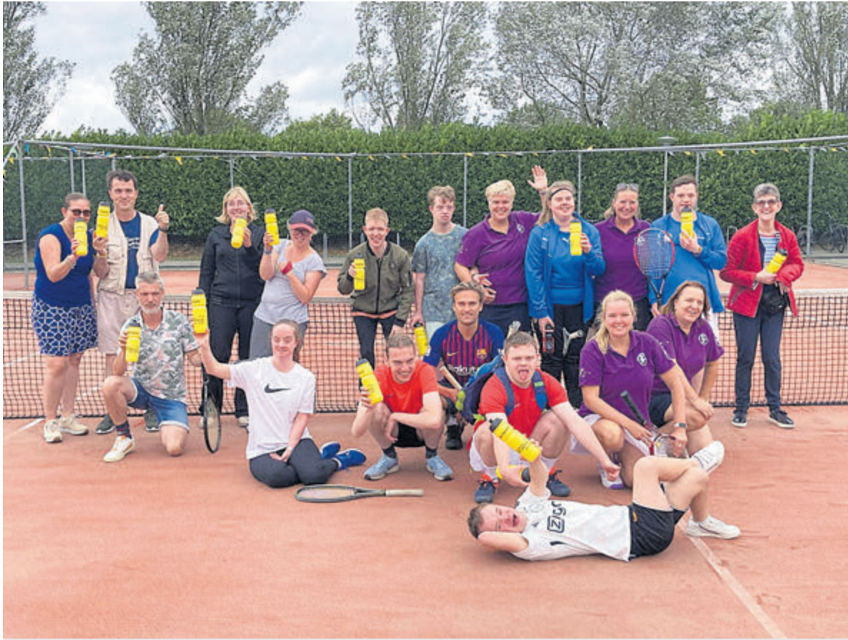
Deelnemers, een aantal buddy's en de organisatie van het vijfde G-tennistoernooi bij TV Kudelstaart.