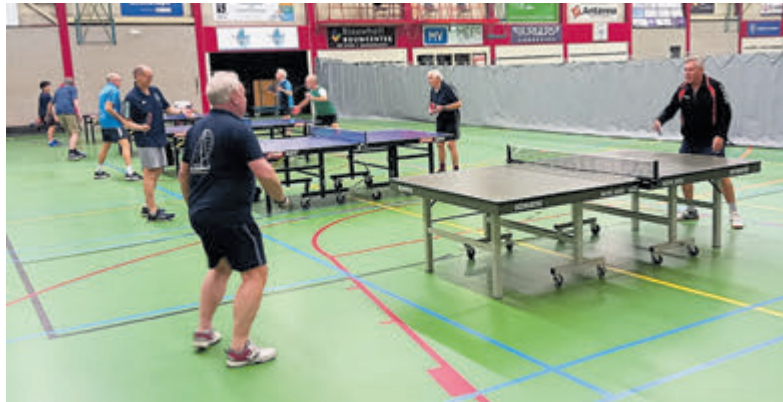
Tafeltennissen voor 55+ op donderdagmiddag bij ATC Bloemenlust.