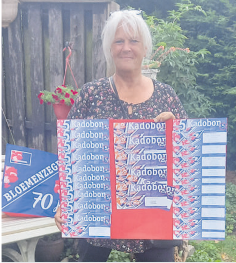
De Bloemenzegelwinkelier blijven nog even trakteren.

Vraag om bloemenzegels, u heeft er recht op!