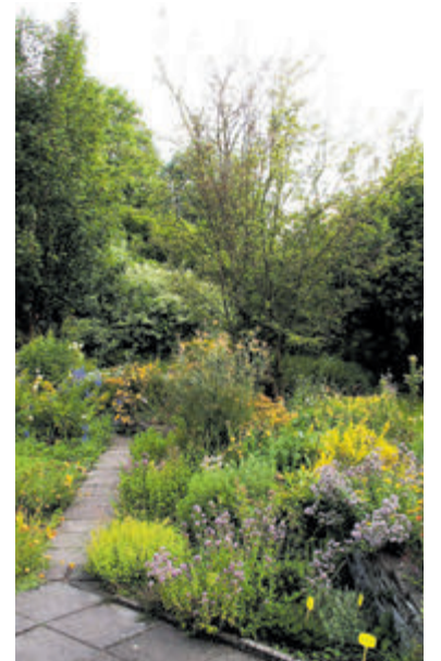
Tuin Bram de Grootte, zondag laatste openstelling dit seizoen.

Zondag 1 september is de laatste openstelling van 2024 en staan de vrijwilligers van 13.00 tot 16.00 uur klaar voor diverse toelichtingen. Ingang via de zijingang van de tuin tegenover de werkschuur aan de Elzenlaan. Fietsen kunnen worden gestald bij de werkschuur. De toegang is gratis. Naast de open zondag is het mogelijk om op