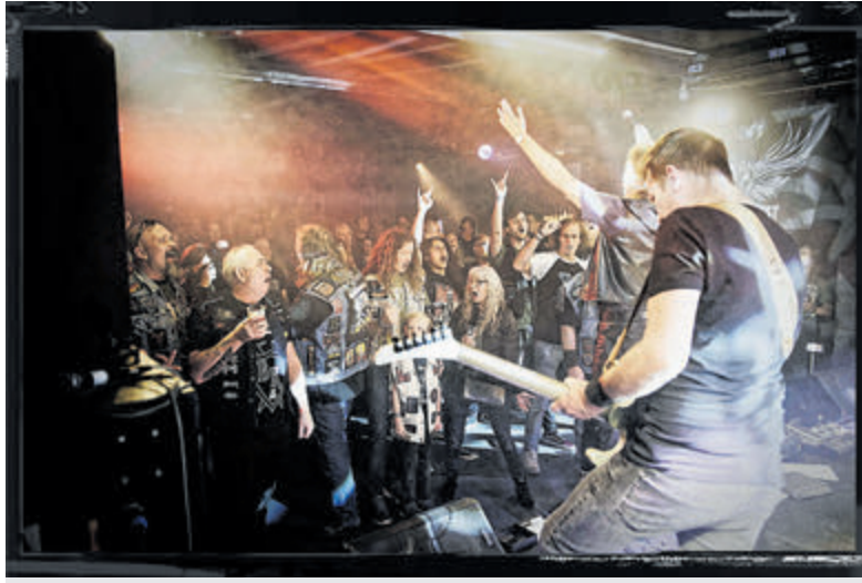
Metbalband Black Night.