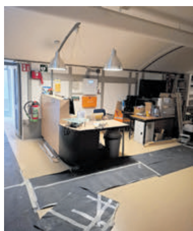
De nieuwe receptie van het Crash Museum.

Het Crash Luchtoorlog- en Verzetsmuseum '40-'45 is gevestigd in het Fort bij Aalsmeer aan de Aalsmeerderdijk 460 in Aalsmeerderbrug (bij Rijsenhout).