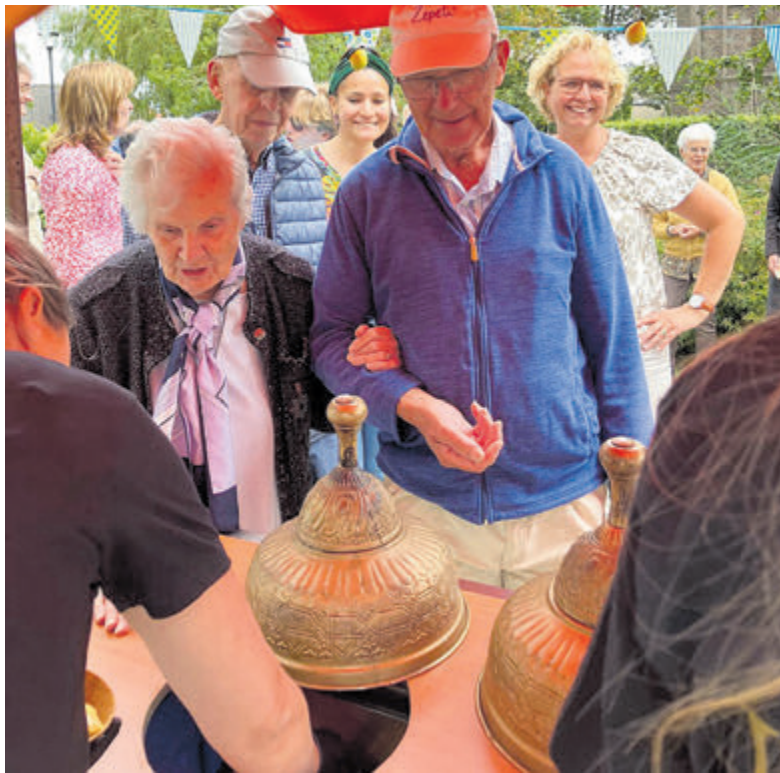
IJs voor deelnemers en vrijwilligers van het Ontmoetingscentrum.