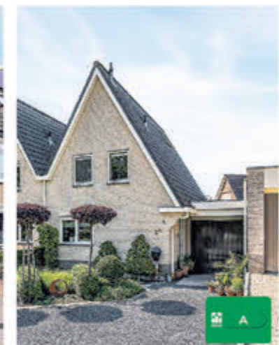
Bilderdammerweg 2b Kudelstaart Vraagprijs € 735.000,- k.k. Collegiale verkoop met Mantel Makelaars