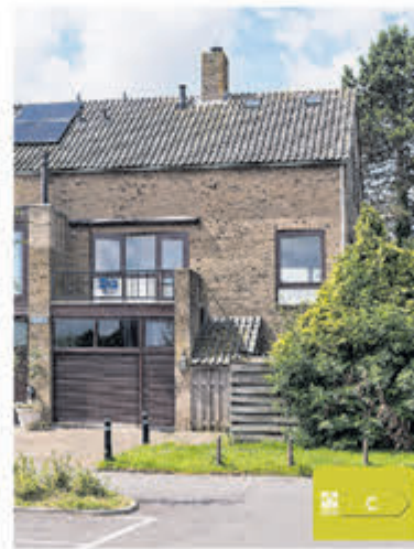
Stommeerweg 95 Aalsmeer Vraagprijs € 850.000,- k.k.