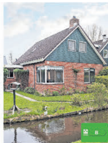
Oosteinderweg 402 Aalsmeer Vraagprijs € 699.000,- k.k.