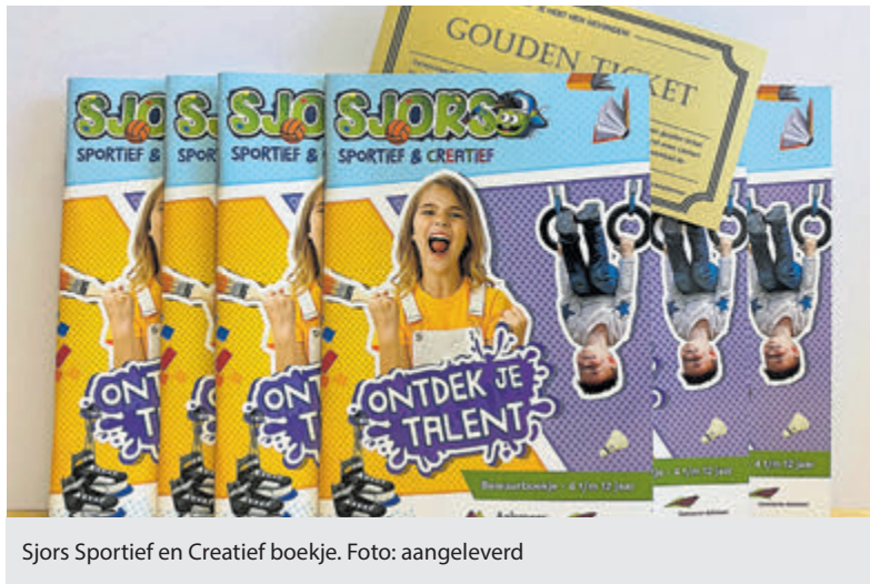
Sjors Sportief en Creatief boekje.