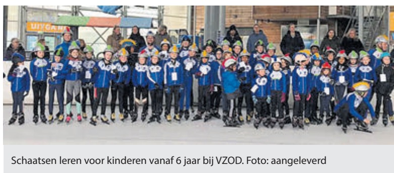
Schaatsen leren voor kinderen vanaf 6 jaar bij VZOD.

voor de eerste plaats. In de C-klasse is Conny Offerman eerste geworden met 1683 punten. Rosa Ebbinge heeft in klasse D, met 1661 punten, een grote voorsprong genomen op de nummers twee en drie. De eerstvolgende sjoelavond is donderdag 26 september. In verband met de verbouwingen in Dorps huis Rijsenhout wordt er deze avond nog gespeeld in De Reede aan de Schouwstraat van 19.30 tot ongeveer 22.30 uur.