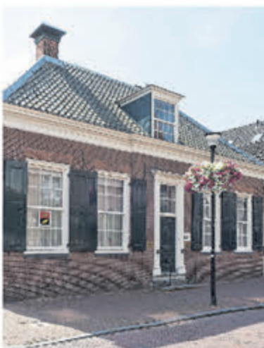
Dorpsstraat 18 Aalsmeer Vraagprijs € 1.200.000,- k.k.