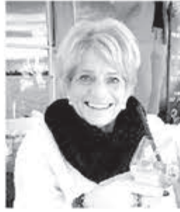
I did it my way

Correspondentieadres: Faunalaan 87, 1422 ZH Uithoorn