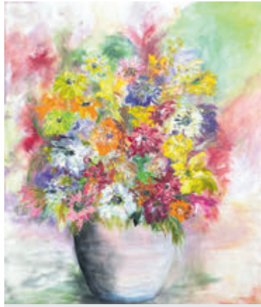
Start voorverkoop voor 'Zondag bij Bob' komend weekend tijdens het kunstweekend Bob out of the Box.