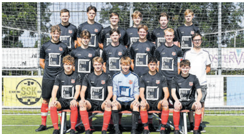
Het team van RKDES JO23-1.