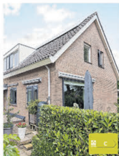
Oosteinderweg 113 Aalsmeer Vraagprijs € 765.000,- k.k.