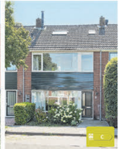
St. Janstraat 29 Kudelstaart Vraagprijs € 495.000,- k.k.