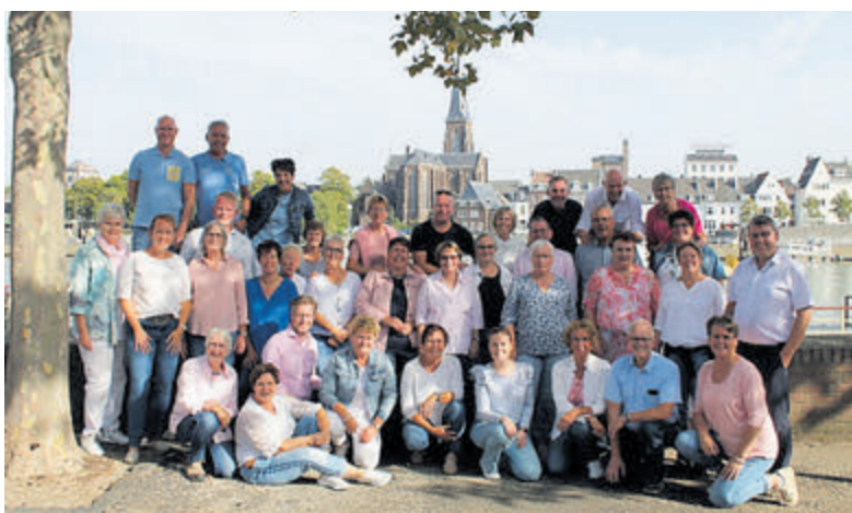
Nieuw seizoen gestart bij Caritas.