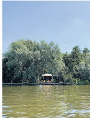
Recreatie-eiland Blauwe Beugel Vraagprijs € 395.000,- k.k.