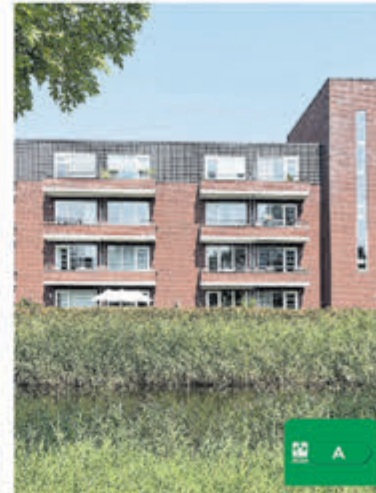
Westhoven 120 Amstelveen Vraagprijs € 415.000,- k.k.