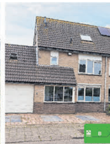
Hendrikstraat 32 Aalsmeer Verkocht onder voorbehoud