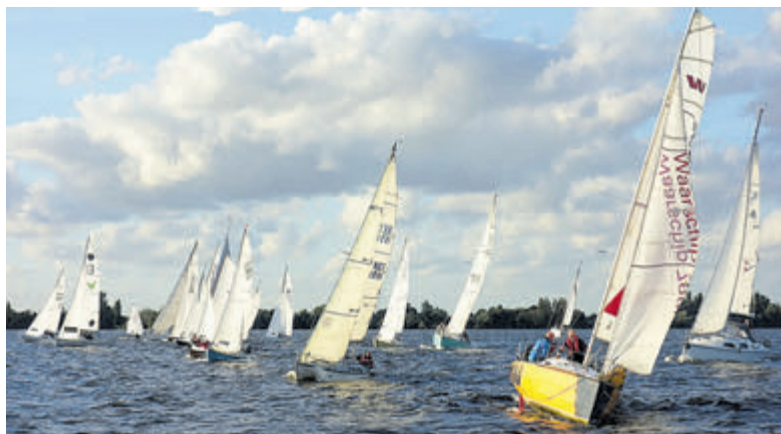
Wedstrijdzeilen op de Westeinderplassen.