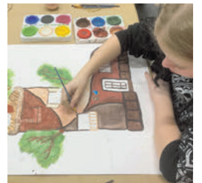
Tekenaarier voor kinderen bij De Werkschuit.

van klei of ander materiaal, maar vooral ook hoe je zelf iets nieuws kunt maken dat heel bijzonder is. Je zit in een gezellige groep met kinderen die allemaal graag knutselen en schilderen. Het is leuk om van elkaar te zien hoe je iets maakt en je krijgt weer nieuwe ideeetjes. Inschrijven voor deze en alle andere cursussen (ook voor volwassenen) kan via de website: www.werkschuit-aalsmeer.nl . Voor vragen kan een e-mail gestuurd worden naar stichtingdewerkschuitaalsmeer@outlook.com