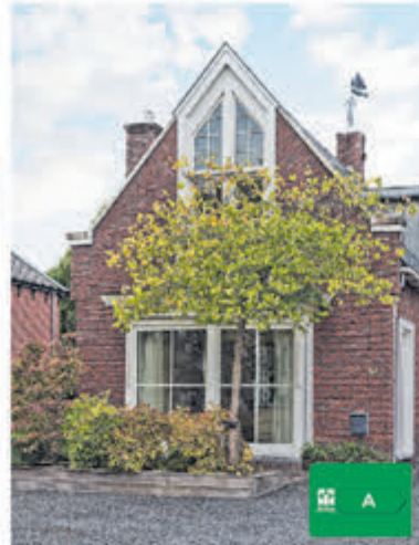
Uiterweg 84 Aalsmeer Huurprijs € 5.500,- per mnd.