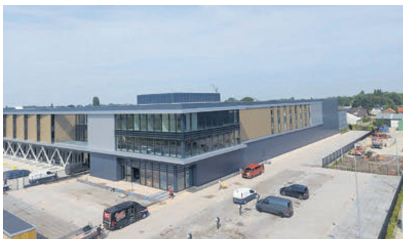
Het Green Square Logistics bedrijfscomplex.

Als kers op de taart is Tyra Robi van 12.00 tot 17.00 uur in de winkel aanwezig, om je aangekochte kledingstuk een uniek design te geven! Kom gezellig langs, laat je inspireren door de nieuwste trends en ontdek alles wat dit najaar te bieden heeft. Voor meer informatie kan gebeld worden naar 0297-324394 of stuur een email naar: marketing@kraanmode.nl