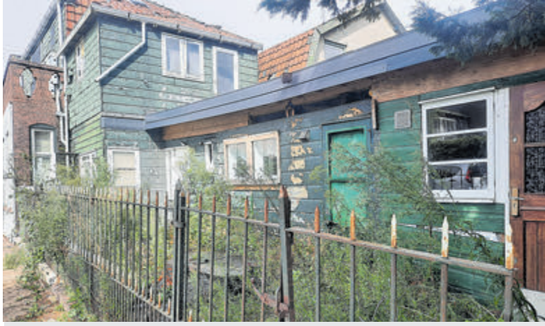
De bebouwing in de Schoolstraat en hoek Dorpsstraat is wel aan een metamorfose toe.