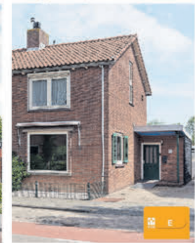
Hortensialaan 75 Aalsmeer Onder Bod