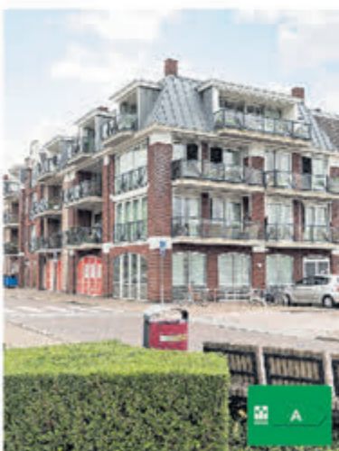
Molenpad 69 Aalsmeer Verkocht onder voorbehoud