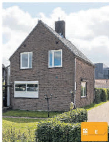
Aalsmeerderweg 148 Aalsmeer Vraagprijs € 650.000,- k.k.