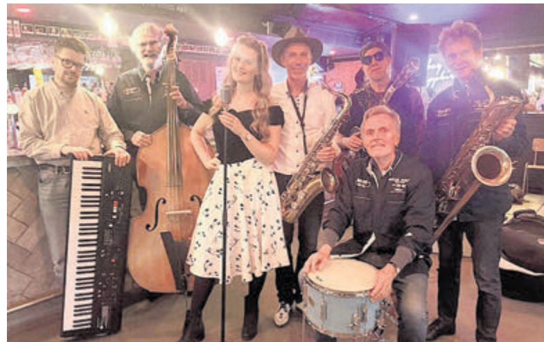
Johnny en de Surfers.