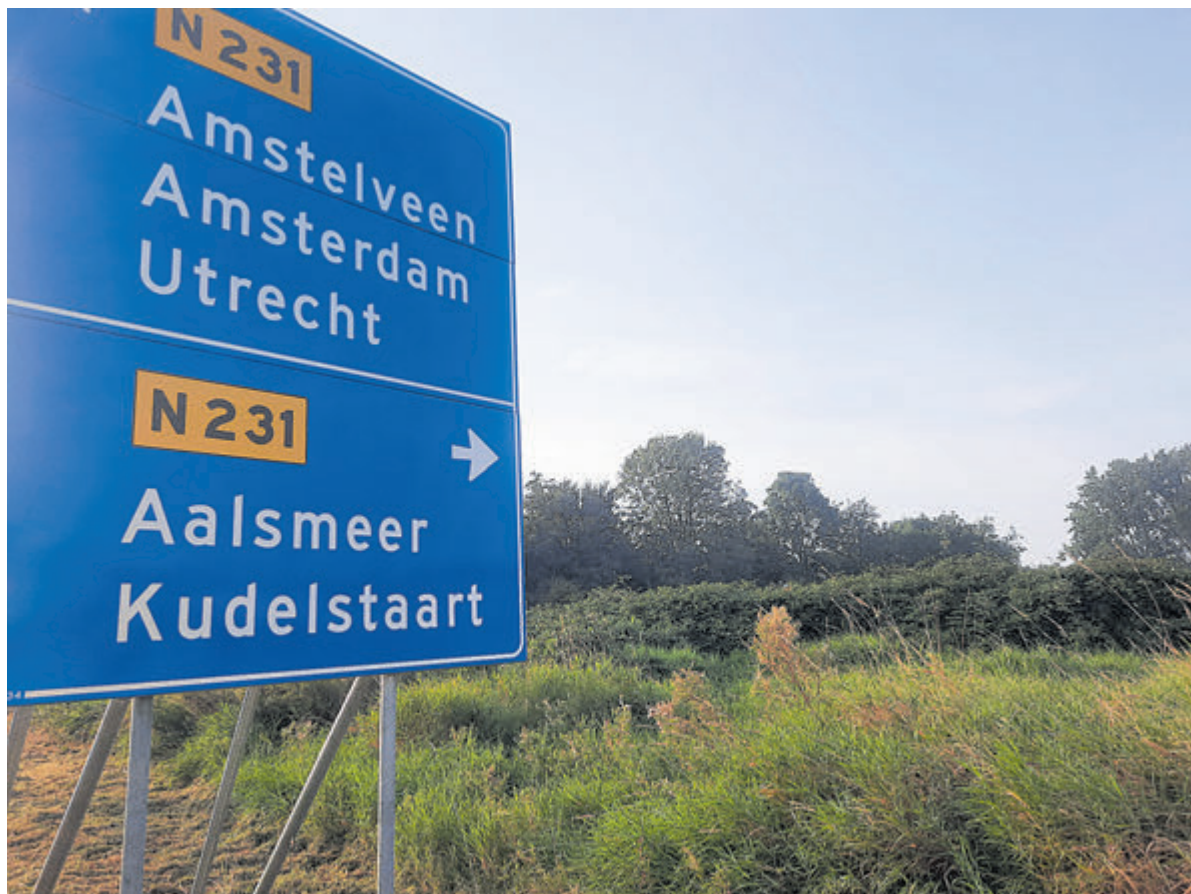
Het nog braakliggende terrein op de hoek Lakenblekerstraat en Legmeerdijk