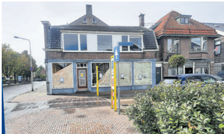
Het pand op de hoek Marktstraat en Van Cleeffkade.

ontwikkelaar Monk Architecten uit Utrecht een appartementengebouw realiseren in vier bouwlagen met totaal 35 koopappartementen. Deze locatie is al langer in beeld. Er is al eerder een plan ingediend, maar niet tot verdere uitwerking gekomen. Er is nu een nieuw plan ontwikkeld. "De prijs per vierkante meter is relatief hoog, er wordt feitelijk in het middensegment gebouwd. Ideaal zou het zijn als het programma in het goedkope segment wordt gerealiseerd, maar het belang van woningbouwontwikkeling is echter groot. Er zijn goede kansen om op basis van het ingediende initiatief tot een haal-