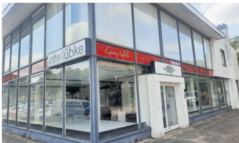
Nieuw plan voor herontwikkeling Ophelialaan 95.