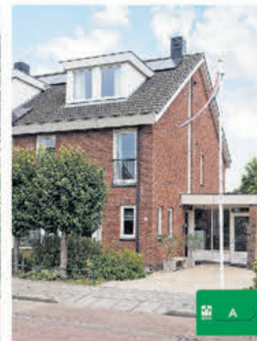
Gaffelstraat 11 Kudelstaart Vraagprijs € 875.000,- k.k.