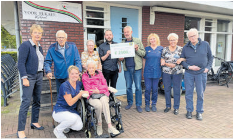
Enkele ouderen en medewerkers van wijkpunt Voor Elkaer met de cheque van Tennisvereniging Kudelstaart.