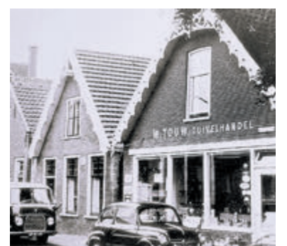
Oude foto's van de Zijdstraat in winkeletalages.