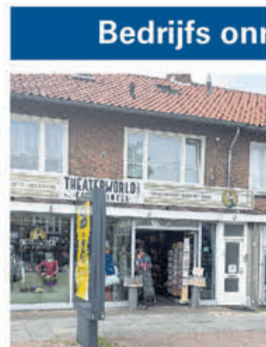
Ophelialaan 95 - Aalsmeer Grote winkelruimte op A-locatie Huurprijs € 4.000,- per mnd.