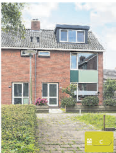
IJsvogelstraat 26 Aalsmeer Verkocht onder voorbehoud