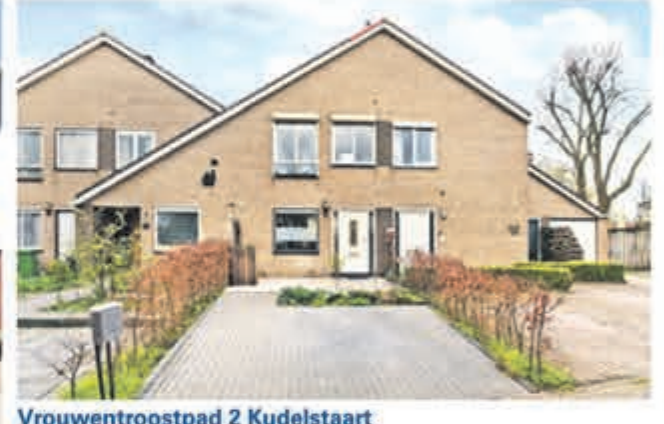
Vrouwentroostpad 2 Kudelstaart Vraagprijs 389.000,- k.k. met garage Vraagprijs 365.000,- k.k. zonder garage