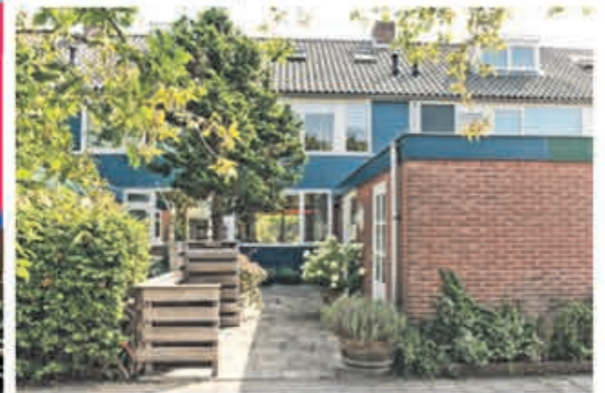
Waterhoenstraat 40 Aalsmeer Vraagprijs € 350.000,- k.k.