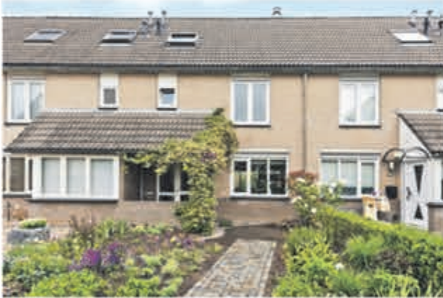
Hendrikstraat 7 Aalsmeer Vraagprijs € 375.000,- k.k.