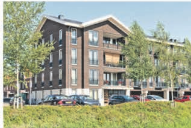
Twijnderlaan 64 Aalsmeer Vraagprijs € 475.000,- k.k.