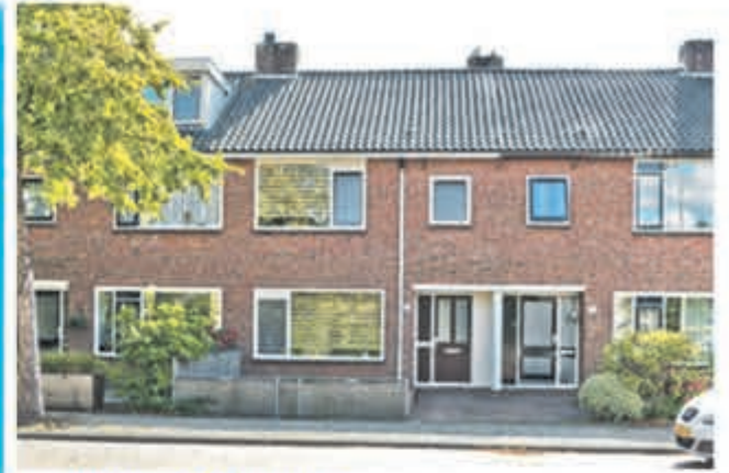
Beethovenlaan 26 Aalsmeer Bieden vanaf € 348.000,- k.k.