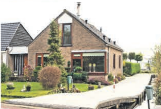
Oosteinderweg 184 Aalsmeer Vraagprijs € 435.000,- k.k.