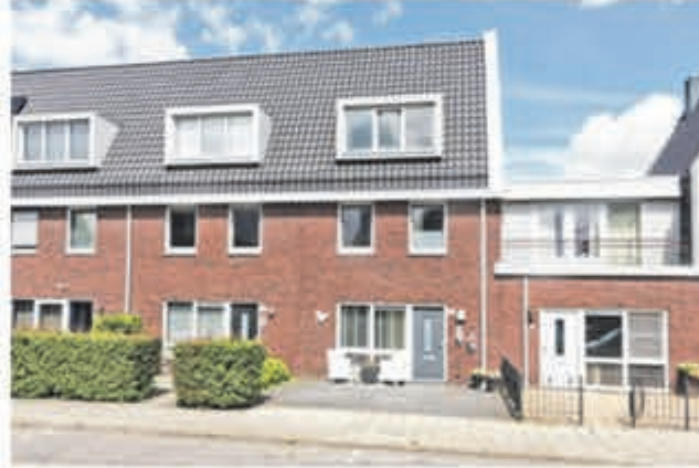
Korfstraat 49 Kudelstaart Vraagprijs € 375.000,- k.k.