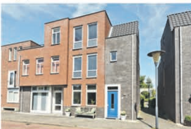
Vlinderweg 240 Aalsmeer Vraagprijs € 545.000,- k.k.