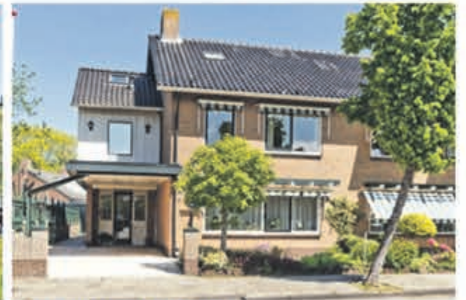
Einsteinstraat 10 Kudelstaart Vraagprijs € 495.000,- k.k.