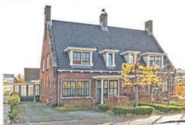
Dorpsstraat 64 Aalsmeer Vraagprijs € 695.000,- k.k.