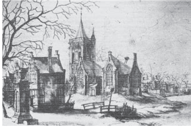
Afbeelding: In 1650 schetst Jan Abrahamsz Beerstraten de dorpskerk met links daarvan het raadhuis (met trapgevel) uit 1619. Linksvoor staat de dorpspomp en het bruggetje is tegenwoordig het C.J. Braber Pad naar de kerk.