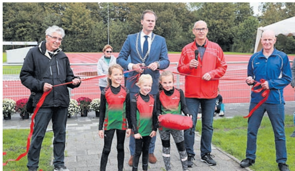
SLS schenkt bijna twee ton voor nieuw clubgebouw