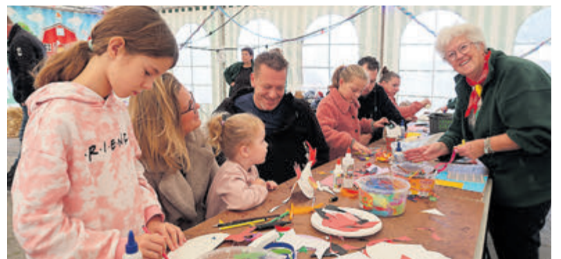
Leuke spelletjes, knutselen en samen op de foto bij Boerenvreugd.

Om de opening te vieren waren er leuke activiteiten op de kinderboerderij. Kinderen konden tijdens het boerenfeest meedoen met leuke spelletjes, wat leren bij de raadselspeurtocht en vrolijke kippen knutselen. De boeren fotohoek was een groot succes. Veel kinderen en volwassenen zijn op de foto geweest in boerenstijl. De klompenmaker demonstreerde hoe klompen gemaakt worden en kinderen mochten hem helpen bij het bewerken van het hout. De geur van de verse stroopwafels was voor velen niet te weerstaan en in het zonnetje werd er dan ook volop genoten van deze lekkernij en de gezelligheid bij kinderboerderij Boerenvreugd.