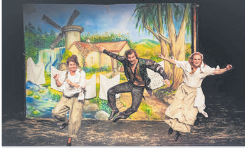
Repelsteeltje door Het Kleine Theater.