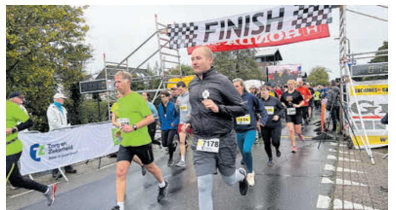
Al meer dan 1000 deelnemers aan Zilveren Turfloop.

de deelnemers zullen aanmoedigen. En meer dan 125 vrijwilligers zetten zich in om van dit evenement een groot succes te maken. Inschrijven voor wandelen en hardlopen kan via: https://inschrijven.nl/form/2024110301151-nl . En de inschrijving voor de GeZZinsloop en G-Run verloopt via de scholen of via het e-mailadres: gezzinsloop@veenlopers.nl . Inschrijven op de dag zelf is ook mogelijk. Voor meer informatie kan de website: www.veenlopers.nl bezocht worden of de site van Zorgzekerheid Circuit: zorgzekerheidcircuit.nl