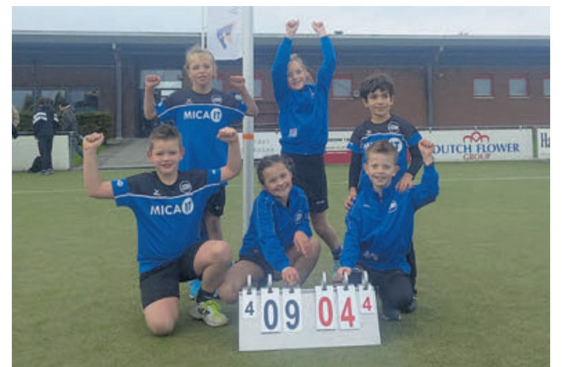
De trotse korfbalsters E1 van VZOD.

is. Andere alternatieve locaties bleken niet geschikt. Sommige bleken technisch niet haalbaar, omdat deze te ver uit de zoekcirkel lagen. Andere locaties waren ongeschikt vanwege de aanwezigheid van boomwortels, kabels en leidingen. Het college zegt tot slot het opheffen van parkeerplaatsen geen voorkeur heeft. "Er is bewust gekozen om maar één parkeerplaats te gebruiken in plaats van twee. We gaan onderzoeken of we deze parkeerplaats kunnen compenseren." Het onderwerp 'transformatorhuisjes' zal nog wel vaker aan de orde komen. Het elektriciteitsnet staat weliswaar onder druk en actie is nodig om storingen te voorkomen, maar net als de bewoners in de Saturnusstraat zijn er ook inwoners in andere wijken die niet echt gecharmeerd zijn over de gekozen locatie voor de 'kast'.