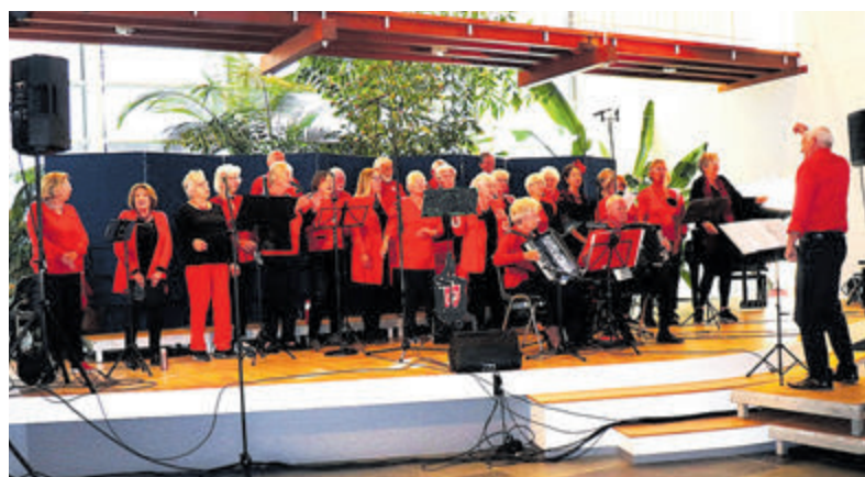
'Denk aan de Buren' tijdens de Korendag 2024 in het Raadhuis.

concert op zondagmiddag 10 november in het Parochiehuis aan de Gerberastraat. Het concert begint om