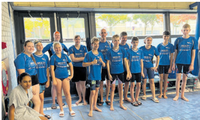
Een deel van de groep wedstrijdzwemmers van Oceanus.

werd er flink geknokt en ze leken iets meer aan elkaar gewaagd te zijn dan in het eerste part. Dit resulteerde in een gelijkspel, waardoor het 2-1 stond. De coaches Wim en Suus zorgden voor een keeperswissel en een peptalk toen ze op de helft van de wedstrijd waren. Het derde part startte in een hoog tempo waarin Oceanus niet scoorde. De Robben wonnen dit part. Tussenstand: 3-1. Het laatste part begon sterk. Oceanus stond al snel 2-0 voor. Dit zorgde voor zelfvertrouwen binnen het team. Maar de vermoeidheid sloeg toe en dit part werd verloren. Eindstand van de wedstrijd: 4-1. Dit was de eerste wedstrijd van het seizoen die Oceanus GO12 verloor. Een teleurstelling voor de spelers, maar het zette ze ook weer even op scherp. Het is niet vanzelfsprekend dat elke wedstrijd gewonnen wordt. De spelers kunnen gaan genieten van een welverdiende herfstvakantie. Op naar de Aalscholvers in Almere op 9 november!