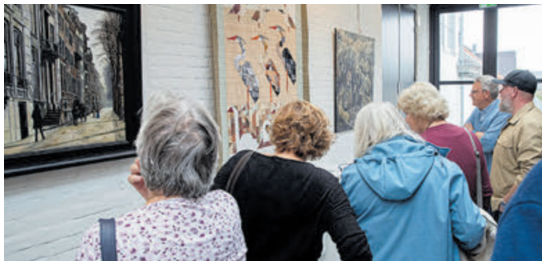
Naast kunst in etalages in het Centrum zijn ook schilderijen, beelden, etc. te zien bij het Cultuurpunt en in het Oude Raadhuis.

Dit culturele evenement loopt tot zaterdag 16 november. Het spektakel wordt afgesloten met een gezellig Cultuurcafé in De Oude Veiling. Dan worden ook de felbegeerde juryprijs en publieksprijs uitgereikt.