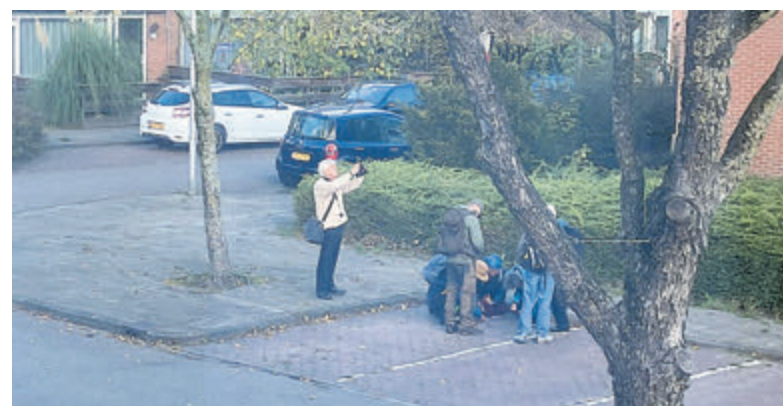
Veldonderzoek naar wilde planten in Kudelstaart.

de NDFF Verspreidingsatlas om zo zichtbaar te maken wat de stand van zaken met de wilde planten in Nederland is. Ze nemen een stuk stad of dorp van 1 vierkante kilometer. In Kudelstaart hadden ze zo al 125 verschillende planten genoteerd. "Ik vind het ontzettend leuk dat in deze tijd, waarin de groenvoorziening onder druk staat, mensen zo bezig zijn met onze natuur", aldus de Kudelstaartse De resultaten van dit noeste werk worden getoond in de Verspreidingsatlas. Kijk op verspreidingsatlas.nl of op floron.nl .