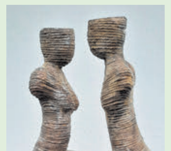
Werk van Jan van Strien.

De Kwakel - Zaterdag 26 en zondag 27 oktober staan tussen 12.00 en 17.00 uur de deuren open van twaalf locaties in en rondom De Kwakel. Kunst kijken op de Boterdijk, Vuurlijn, Noorddammerweg, Kerklaan en in 't Fort voor alle leeftijden: keramiek, foto's, (bronzen) beelden, sieraden, textielwerk, handgemaakte kaarsen, etc. En, zoals ieder jaar, de kerstshow. Meer informatie en de route zijn te vinden op kunstindekwakel.nl