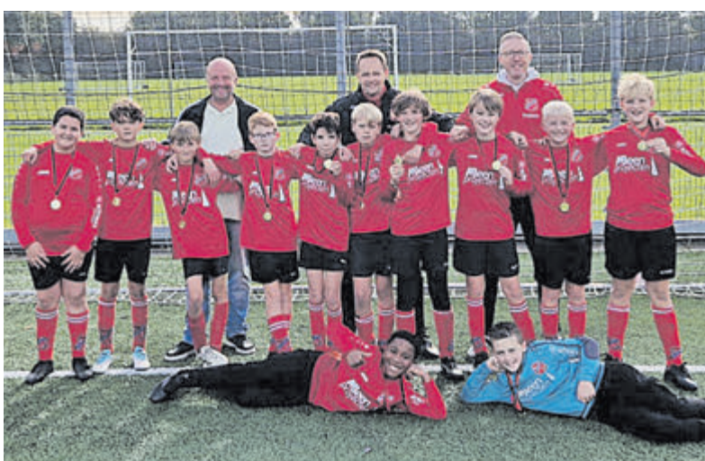
Het kampioensteam JO 12-2 van RKDES.

nieuwelingen wisten vanaf de eerste wedstrijd steeds geconcentreerd en vooral als team te spelen. Zo werd met overtuiging en vooral ook veel plezier dit prachtige resultaat behaald!