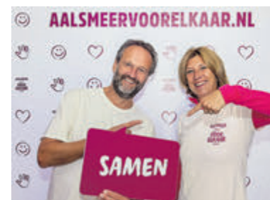
Vrijwilligerswerk voor elk wat wils.

Wil je meer weten over vrijwilligerswerk? Markeer dan donderdag 21 november in je agenda! Op die dag organiseert de Vrijwilligerscentrale Amstelland, bekend van Aalsmeervoorelkaar, een gezellig Happy Hour van 17.30 tot 19.00 uur in De Oude Veiling (Marktstraat 19). Onder het genot van een drankje, een broodje en een kop soep wordt in een informele setting gepraat over wat vrijwilligerswerk in Aalsmeer en Kudelstaart te bieden heeft. Ontmoet andere vrijwilligers, deel ervaringen en ontdek wat vrijwilligerswerk voor hen betekent.