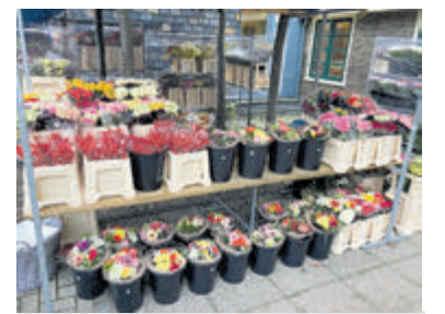
Heel veel bloemen te koop tijdens de bazar.

Vijftig procent van de opbrengst gaat naar de volgende goede doelen: Dental care unit bij het shirati ziekenhuis in het Mara district in Tanzania, Peace Home Busua, Dagpvang gehandicapten lichamelijk en geestelijk in Ghana, Mikondo in Kinshasa in Congo, Stichting Anders Amsteland en Het Adoptie project van Doopsgezind Wereldwerk. De overige vijftig procent is voor de Doopsgezinde Gemeente Aalsmeer zelf, waarvan een deel gebruikt zal worden voor het opknappen van de vloer in de Bindingzaal.