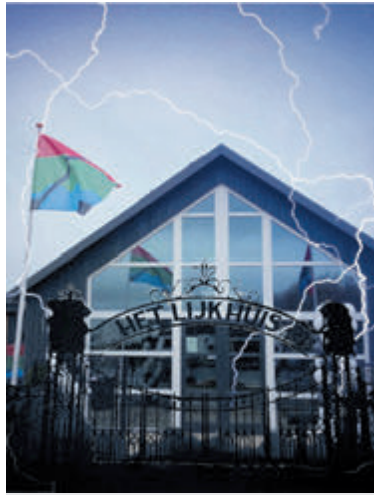
Feest voor jong en oud in Het Lijkhuis op 2 november.

Vergeet niet de dresscode: horror! Het bestuur moedigt iedereen aan om zo eng mogelijk verkleed te komen. Bij binnenkomst worden de feestgangers gefotografeerd voor de Best Costume Award. De winnaar wordt naderhand bekend gemaakt. PS: Het Lijkhuis is normaal bekend als