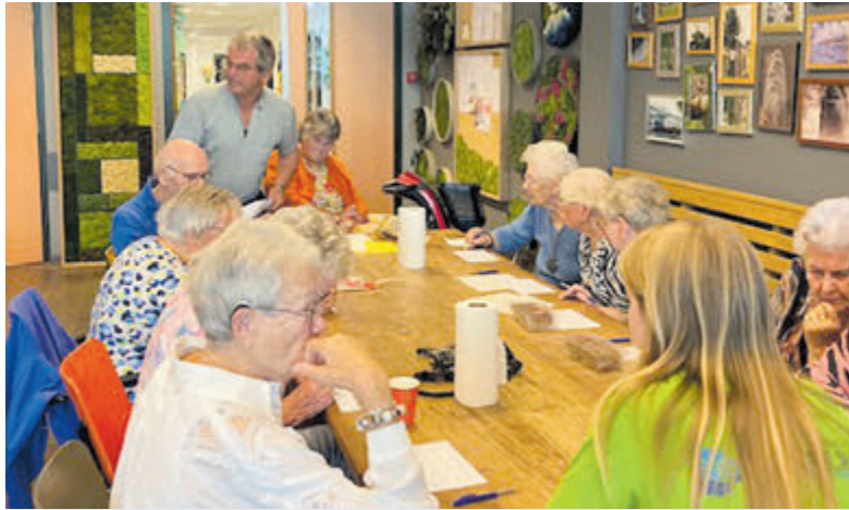
Rondleiding en muziekbingo tijdens dagje uit voor ouderen.

Onderdeel van Regio Media Groep B.V. www.regiomediagroep.nl