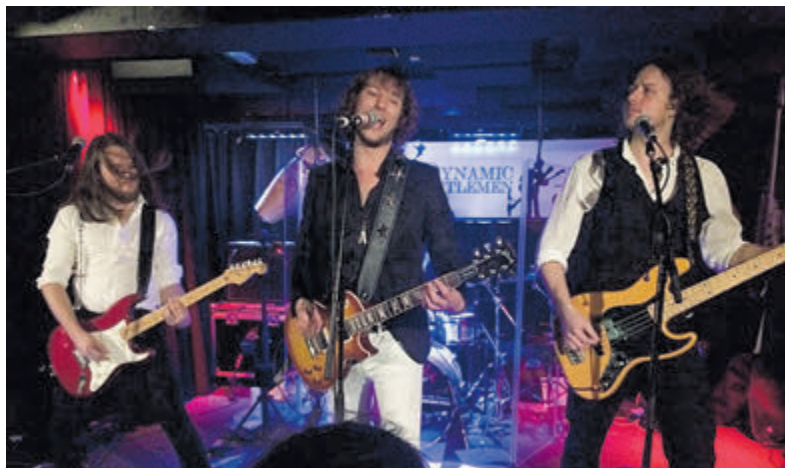
Zaterdag weer Dynamic Gentlemen live in Café Joppe.

De kans is aanwezig dat je de volgende dag schor bent, wakker wordt met een lichte spierpijn en een ietwat zwaar hoofd is zeker mogelijk maar je zult er zeker geen spijt van hebben. Het optreden zaterdag begint rond 21.30 uur en de toegang in Joppe aan de Weteringstraat in het centrum is helemaal gratis.