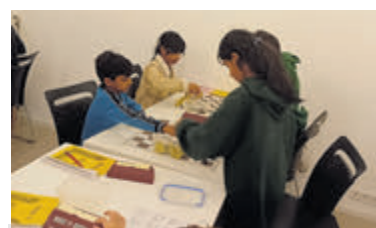
Jeugdschaken bij AAS op vrijdagavond.