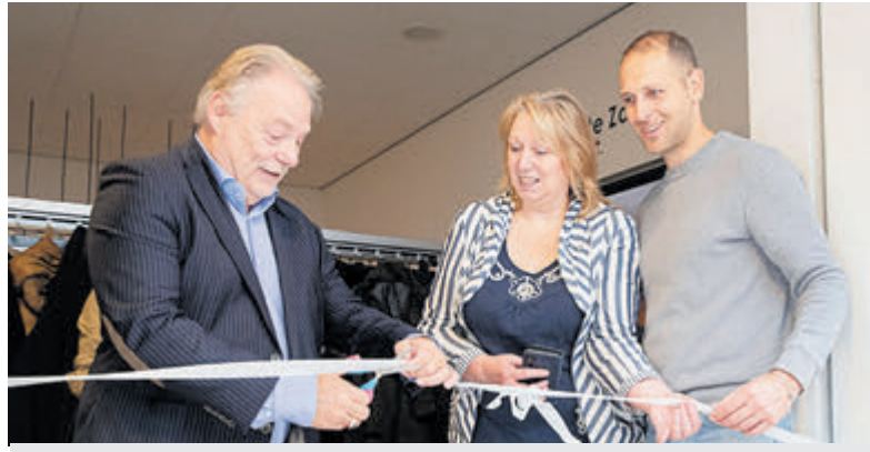
Opening Amazing Amateurs in de Etalage door de wethouder.

Komende weken zal de muziekvereniging zich voorbereiden op de jaarlijkse oliebolactie. Op vrijdag 8 november gaan de leden weer oliebol bakken en verkopen. De opbrengst van de actie is een belangrijke aanvulling van de clubkas. Een zak oliebol kost 5 euro en de oliebol kunnen besteld worden via: sursumbollen@gmail.com . Alle bestelde oliebol worden nog dezelfde dag (8 november) bezorgd. Op zaterdag 14 december zal Sursum Corda samen met muziekvereniging Excelsior uit Hoofddorp een kerstconcert geven in de Ontmoetingskerk te Rijsenhout.