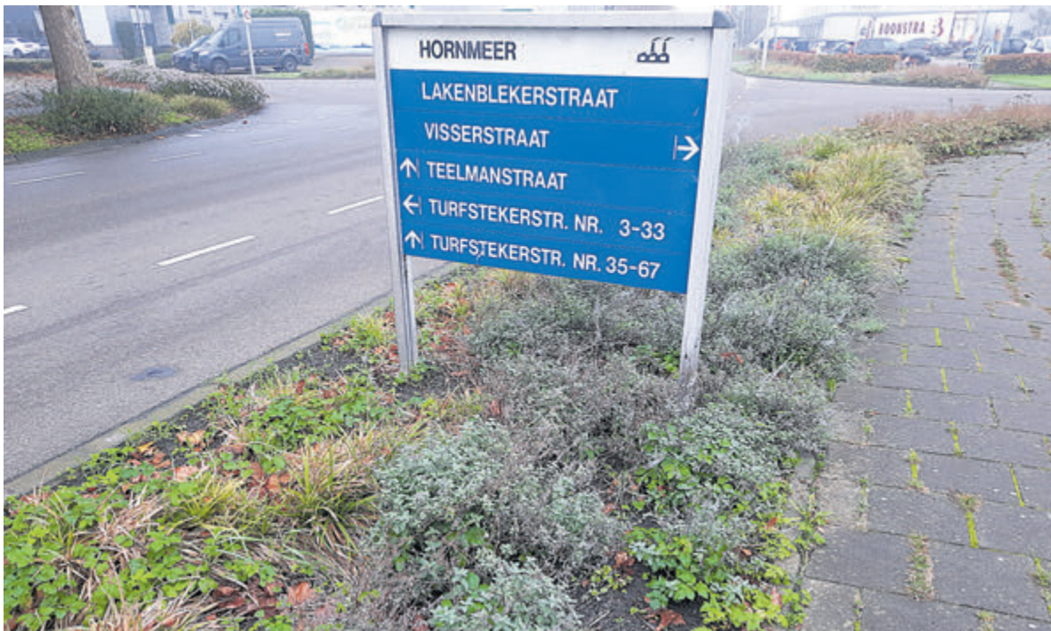
Aalsmeer heeft een aantal bedrijventerreinen. 'Hornmeer' is de oudste en grootste.