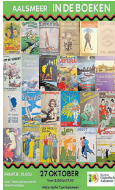
Weekend van het Aalsmeerse boek.

Op zaterdag 26 oktober is het weer tijd voor de maandelijkse bloemen- en plantenveiling in de veilingzaal van de Historische Tuin. Deze laatste openbare veiling van dit jaar begint om 15.00 uur. De veilingmeester leidt u langs de kavels en legt uit hoe alles werkt. Uw entreekaartje voor het