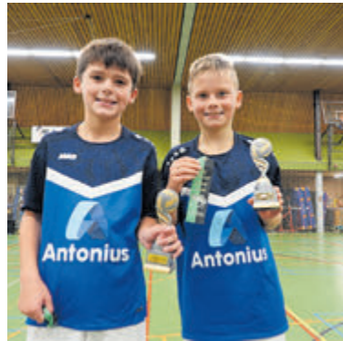
De winnaars bij de groepen 7 en 8: Pinguinboys.

Kinderen die enthousiast zijn geworden door het toernooi kunnen een keer gratis mee trainen op woensdagmiddag in sporthal De Waterlelie tussen 16.30 en 18.00 uur. Aanmelden kan via: volleybal@svomnia.nl