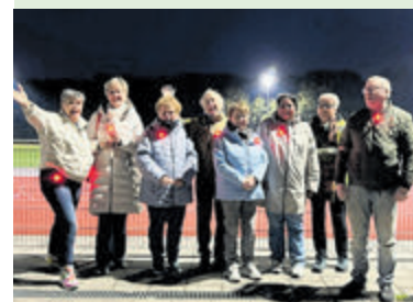
De groep Aalsmeer Actief wandelaars bij de atletiekbaan.

Aalsmeer - Na vele geweldige wandelavonden door Aalsmeer, die een oefening waren voor de Nationale Diabetisch Challenge tocht in Arnhem, wandelt de groep onder leiding van Aalsmeer Actief gewoon door vanaf Atletiek vereniging. De locatie in de Sportlaan is een mooie plek om te starten en te finishen! Ook meewandelen? Elke dinsdagavond start de groep om 19.00 uur vanaf het AVA-terrein. Om 19.30 uur start vervolgens een 'snelle' wandelgroep en ook zij heet nieuwe lopers welkom. Meer informatie op: www.aalsmeeractief.nl