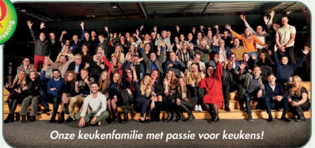
Onze keukenfamilie met passie voor keukens!

Bij Keukenwarenhuis.nl is op uw gemak zelf oriënteren nog mogelijk! Alle keukens in de showroom staan compleet en netto geprijsd, zodat u zelf vrijblijvend kunt beslissen of u een ontwerp wilt laten maken of, indien u zover bent, een complete offerte!