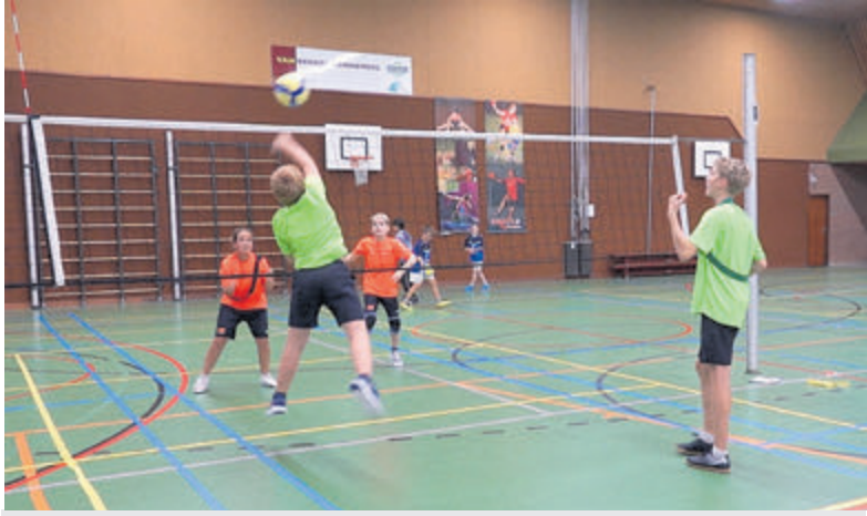
Kinderen in actie tijdens het volleybaltoernooi voor scholen.