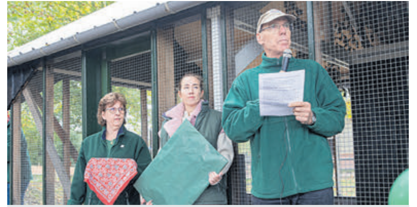
Officiële opening nieuw pluimveeverblijf Boerenvreugd.