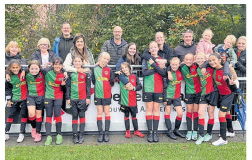
De meiden 11-1 van FCA met de trouwe meegereide supporters.