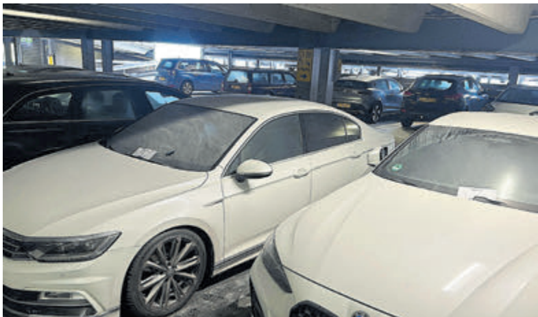
Brandblussers over auto's leeg gespoten.

en Uithoorn) ook langskomen op de nieuwe locatie aan de Elisabeth Wolffstraat 4 in Amsterdam-West. Dit is het eerste centrum in Nederland waar verschillende deskundigen onder één dak samenwerken om slachtoffers van seksueel geweld passende zorg te bieden. Gespecialiseerde verpleegkundigen, psychologen of andere hulpverleners zijn hier aanwezig. Als je dat wilt, kun je hier ook in contact komen met de politie. Ook voor (zorg)professionals is het Centrum er voor advies en ondersteuning. Het centrum is er voor iedereen, ook als er twijfels zijn. Het Centrum is telefonisch bereikbaar via: 0800-0188 (gratis).