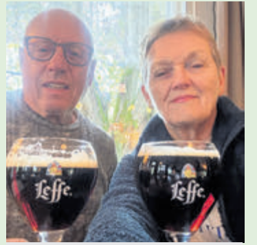
Bitterballen en een donker biertje in de herberg.