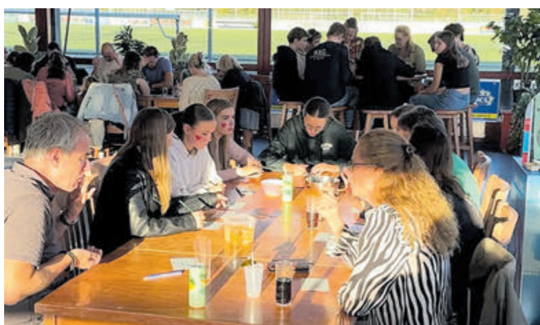
Nieuwe tenues en muziekbingo in de kantine van RKDES.