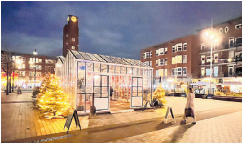
De Rouwkas op het Mercatorplein in Amsterdam in 2023.

Wel staat de organisatie nog voor enkele uitdagingen. Dat betreft enerzijds het vinden van vrijwilligers en anderzijds het financiële aspect. De kas is van 14 tot en met 29 december tussen 13.00 en 20.00 uur geopend en per dag zijn er zes vrijwilligers nodig die in shifts van twee of drie uur de kas bemannen. Wie zich geroepen voelt kan zich hiervoor aanmelden via rouwkasaalsmeer@gmail.com . Er vindt vooraf een bijeenkomst plaats om de vrijwilligers te instrueren. Voor de financiën heeft de organisatie toezeggingen van de kerken en de gemeente maar doet het ook een beroep op ondernemers en inwoners om het een project van en voor iedereen te laten zijn. Middels een crowdfundingactie hoopt men het streefbedrag van 7500 euro op te halen. Doneren kan via www.whydona.com 'kas voor rouwen en vieren Aalsmeer'. Ook kan rechtstreeks geld worden overgemaakt op bankrekening NL98 RABO 0373714653 van Aalsmeer over Hoop o.v.v. 'Rouwkas'.