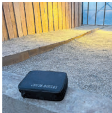
Nu ook jeu de boules bij Turf Aalsmeer.

'Movement Mats' En in samenwerking met MovesU kan vanaf nu bij Turf Aalsmeer met maximaal 16 personen tegelijkertijd de strijd aangegaan worden op 'Movement Mats'; dansplaten zoals je die wellicht kent van Arcadehallen. Daarbij moeten de deelnemers op het juiste moment op de juiste pijlen gaan staan door goed op het scherm te kijken en/of naar de muziek te luisteren. Of wat te denken van een (Kerst) pubquiz? Genoeg vermaak voor de komende donkere maanden dus bij Turf Aalsmeer. Kijk voor meer informatie op www.turfevents.nl