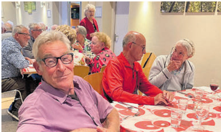
Vrolijke gezichten en gezellige gesprekken tijdens de maandelijkse bijeenkomst van de Open Hof Keuken.

Onderdeel van Regio Media Groep B.V. www.regiomediagroep.nl