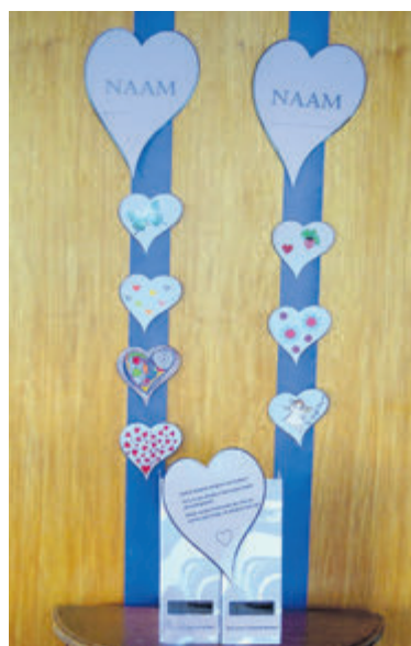
Linten met hartjes.

e-mail bij: f.huijbregts@particpe.nu of jbkooij@kabelfoon.nl. Bellen kan ook: 0297-321509 of 06-16934773.