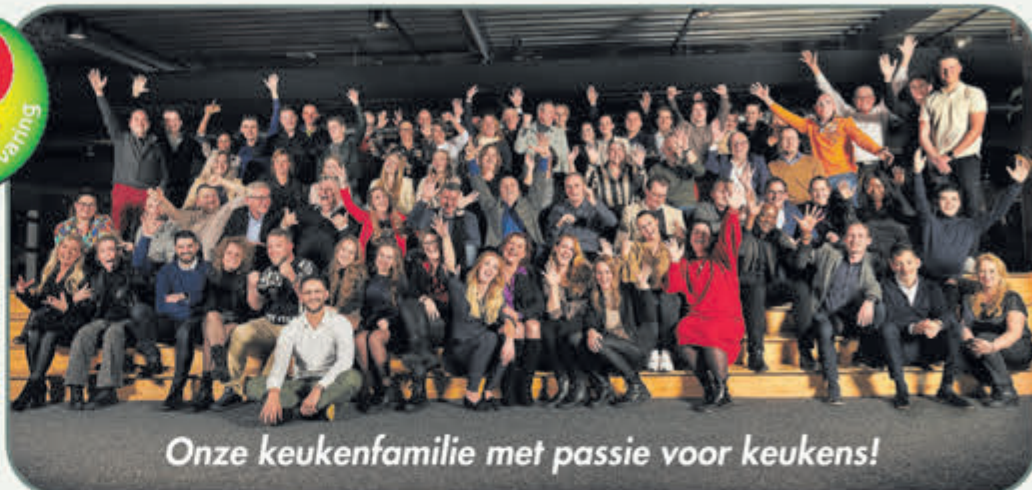
Onze keukenfamilie met passie voor keukens!

Bij Keukenwarenhuis.nl is op uw gemak zelf oriënteren nog mogelijk! Alle keukens in de showroom staan compleet en netto geprijsd, zodat u zelf vrijblijvend kunt beslissen of u een ontwerp wilt laten maken of, indien u zover bent, een complete offerte!