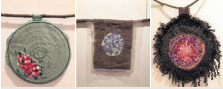
Werk van Nicole de Bree bij de Fysio in Kudelstaart.