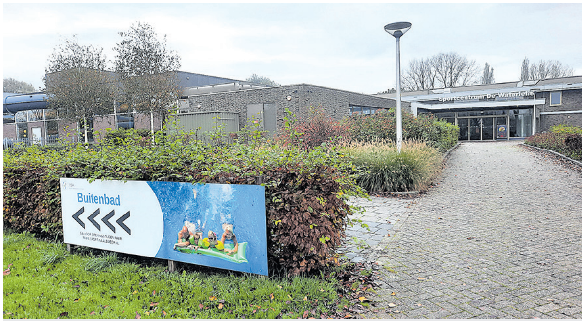
Het huidige sportcentrum De Waterlelie in de Hornmeer.