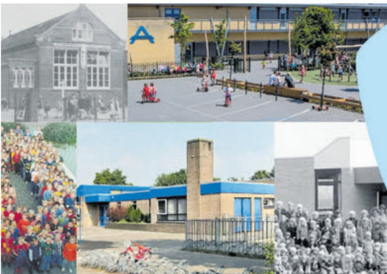
Antoniuschool viert in 2025 het 115-jarig bestaan.

In 2020 kon de geplande reünie bij het 110-jarig jubileum helaas door corona niet doorgaan, daarom willen de initiatiefnemers nu bij het 115-jarig bestaan terugkijken op de rijke historie van de school. Tijdens de reünie op zaterdag 12 april zijn alle oud-leerlingen en oud-leerkrachten van harte welkom om oud-klasgenoten, juffen en meesters te ontmoeten. De reünie is tussen 13.00 en 19.00 uur met verschillende starttijden. Daarna kun je naar een afterparty in Café op de Hoek. Meer weten en/of aanmelden? Ga naar de website: www.antoniusreunie.nl