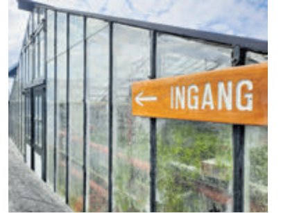
Historische Tuin eindigt seizoen met verkoopdag.

poten en te verpoten. Kom voor deze en andere producten naar de Historische Tuin, ingang via het Praamplein. De verkoopdag op zaterdag 2 november duurt van 11.00 tot 15.00 uur en is gratis te bezoeken. In de wintermaanden is de Tuin gesloten maar vinden er wel diverse activiteiten plaats, zoals de Lions Kerstmarkt op 6 en 7 december. Meer info: www.historischetuinaalsmeer.nl .