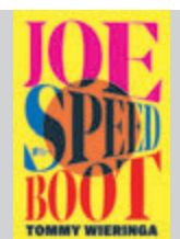
Boek 'Joe Speedboot' van Tommy Wieringa.

De schrijver van Joe Speedboot, het boek dat Heel Nederland Leest in november, maakt een tournee langs bibliotheken in heel Nederland om met zijn lezers over het boek in gesprek te gaan. In Uithoorn wordt hij op zaterdag 16 november geïnterviewd door programmamaker van de Bibliotheek Amstelland, Anton Furnée. Meer informatie over alle activiteiten is te vinden in de agenda op: debibliotheekamstelland.nl