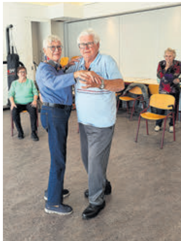
eerste donderdag van de maand. Op 5 december is de volgende keer.

nadruk tijdens de dansmiddagen, die de naam 'In the Mood' hebben gekregen, ligt op bewegen en gezelligheid. Dansen is geen moeten; kijken, luisteren en genieten is ook een optie. Voor de entree wordt 2 euro gevraagd om een drankje en een hapje te bekostigen. Aanmelden is wenselijk en kan via telefoonnummer 06 22468574. Er gaat voor het eerst gedanst worden op donderdag 7 november in 'danspaleis' Irene aan de Kanaalstraat 12. Aanvang is 14.15 uur. Voorlopig zijn de dansmiddagen gepland op elke