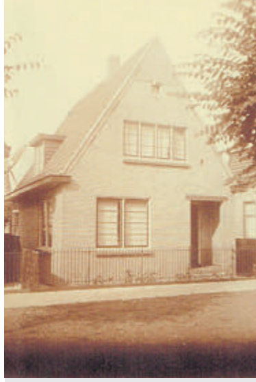
Woonhuis 'Zeelandia' in de Schoolstraat.