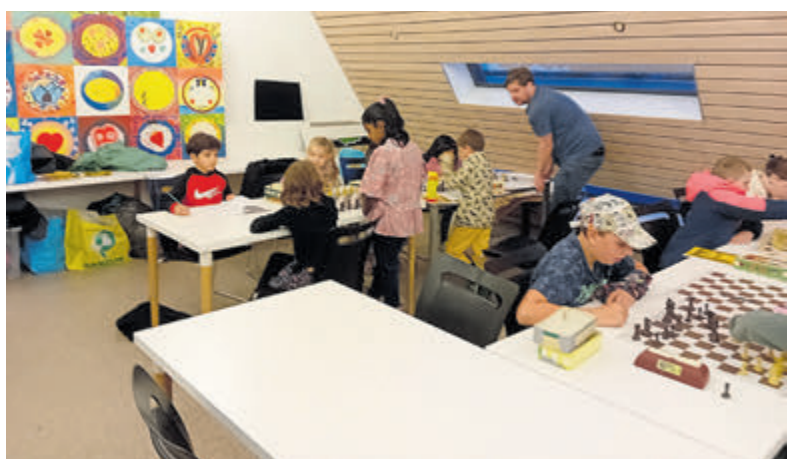
Jeugdcompetitie schaken bij AAS op vrijdagavond.