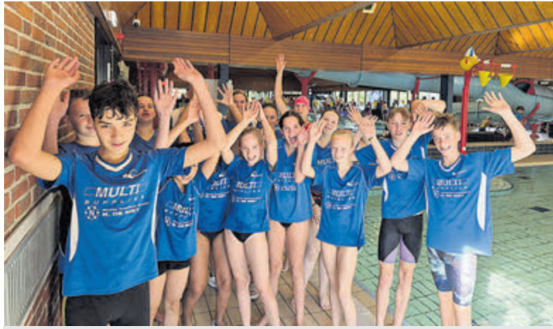
De zwemtoppers van Oceanus tijdens de IJsselcup.