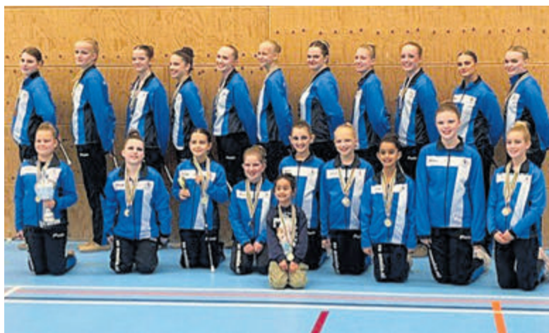
De Omnia twirlsters die deelgenomen hebben aan de wedstrijd.