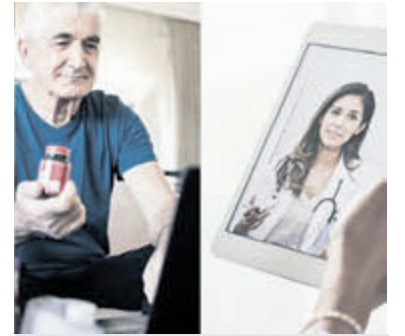
Cursus DigiVitaler in Bibliotheek Aalsmeer.

stellen, een afspraak maken of een herhaalrecept aanvragen, inloggen en medische gegevens bekijken in het patiëntenportaal van de huisarts of ziekenhuis en videobellen met de dokter. De cursus is bedoeld voor mensen die al enige ervaring hebben met het gebruik van computer en internet. Deelnemers krijgen aan het einde van de cursus een certificaat. Kijk voor meer informatie op: www.debibliotheekamstelland.nl