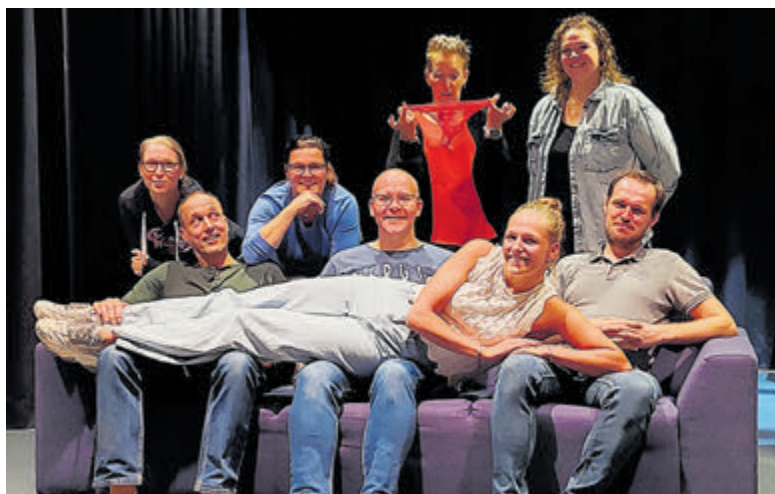
De spelers van Toneelvereniging Kudelstaart.