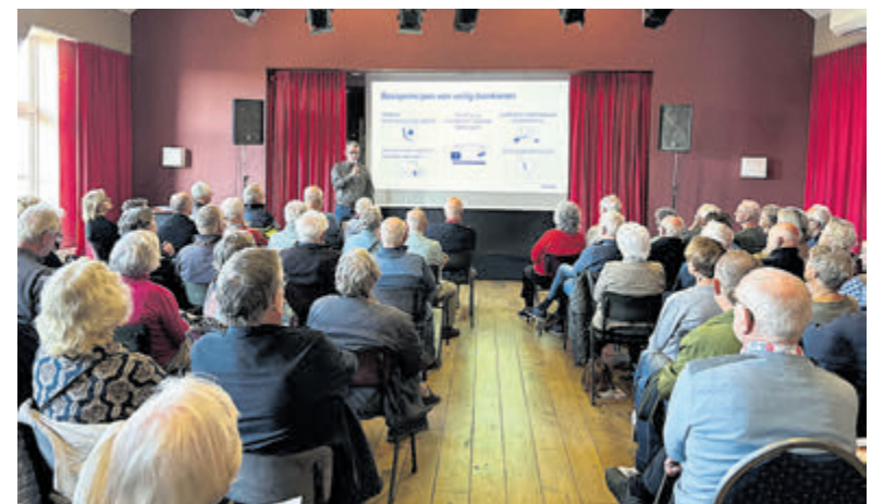
Veel belangstelling voor bijeenkomst 'veilig bankieren'.

presentatie kwamen meerdere oplichtingstrucs aan bod. Een expert van de Rabobank legde uit hoe je phishing e-mails kunt herkennen aan de hand van een valse e-mail die daadwerkelijk is gestuurd uit naam van Rabobank. "E-mails die je onder tijdsdruk zetten om snel te reageren, kunnen verdacht zijn", benadrukt de expert. De basisprincipes van veilig bankieren zijn: Houd uw beveiligingscodes geheim, beveilig uw smartphone, tablet en laptop goed, controleer regelmatig uw bankrekening, laat een ander nooit uw betaalpas gebruiken en meld incidenten bij de bank of de politie. Ook agenten van de politie Aalsmeer-Uithoorn deelden een aantal praktijkvoorbeelden. "Criminelen worden steeds gewiekster", waarschuwden zij "Het is belangrijk om altijd kritisch te blijven en niet zomaar op links te klikken of persoonlijke informatie te delen." Kijk voor meer informatie over veilig bankieren op www.rabobank.nl/veiligbankieren .