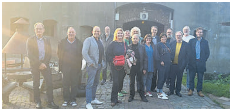
Gemeenteraad op 'fortbezoek' in Beverwijk en Utrecht.

Nu volgt er ruimte voor ideeën: De gemeenteraad moedigt bewoners en organisaties aan om met ideeën te komen. De gemeenteraad zal alle opties zorgvuldig overwegen in de komende periode. Dit kan pas echt goed als de raad eerst de kaders vaststelt, zodat iedereen weet wat mogelijk is. Tot slot, stap vier: Raadsdebat. Er zal een debat worden ingepland over de toekomst van het fort. Hierin worden belangrijke onderwerpen besproken, zoals de betrokkenheid van de gemeente en de financiële mogelijkheden.