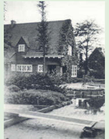
Foto uit 1946 van de woning aan Uiterweg 207, het monument was toen net twintig jaar jong / oud.