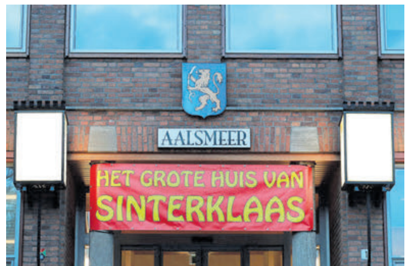
Het Grote Huis van Sinterklaas in het Raadhuis.

worden in de keuken waar al het lekkers wordt bereid, mag er gedanst worden met de danspietjes en mogen kinderen op de foto met Sinterklaas en zijn Pieten. Het Grote Huis van Sinterklaas is op zaterdag 16 november geopend van 14.00 tot 20.00 uur. Locatie: Raadhuis van Aalsmeer op het Raadhuisplein. De aankomst van Sinterklaas is om 11.00 uur in het Centrum, bij het terrein aan de Ringvaart, bereikbaar via de Kanaalstraat.