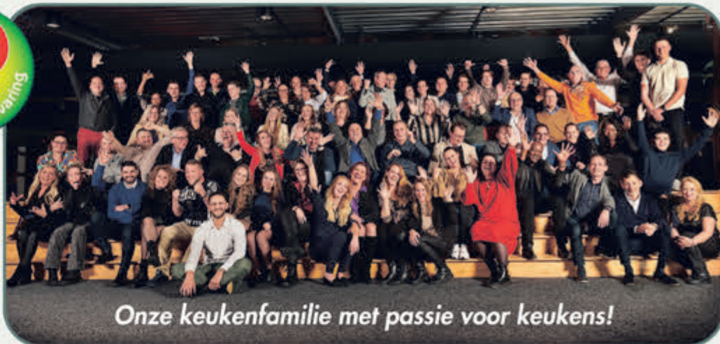
Onze keukenfamilie met passie voor keukens!

Bij Keukenwarenhuis.nl is op uw gemak zelf oriënteren nog mogelijk! Alle keukens in de showroom staan compleet en netto geprijsd, zodat u zelf vrijblijvend kunt beslissen of u een ontwerp wilt laten maken of, indien u zover bent, een complete offerte!