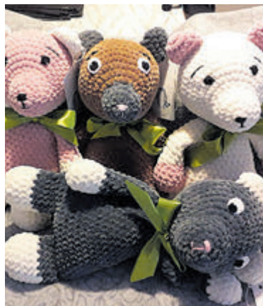
Handgemaakte knuffels tijdens Sam Creatief.

een duofiets of een rolstoelfiets. Eens per jaar organiseert Stichting SAM een boottocht voor ouderen en mensen met een beperking. De jongerengroep van de stichting organiseert regelmatig diverse activiteiten voor ouderen en mensen met een beperking.