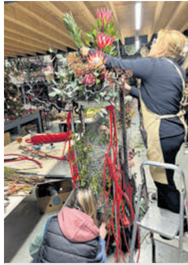
Spaanse bloemisten maken arrangement.

zien is. Aansluitend gingen zij zelf aan de slag bij Bloemsierkunst Christa Snoek in Vrouwenakker om in kleine groepjes een tiental creaties te maken. De opdracht was: maak een arrangement in het (muzikale) thema van de tentoonstelling. De bloemen werden beschikbaar gesteld door Coloriginz. De prachtige creaties zijn vandaag (donderdag 7) tot en met zondag 10 november in het museum te bewonderen. Het Flower Art Museum, gevestigd in de waterkelder tegenover de watertoren, is deze dagen open van 13.00 tot 17.00 uur. Meer informatie: www.flowerartmuseum.nl .