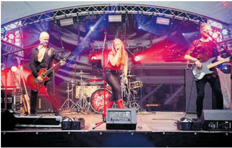
Super Friday treedt zaterdagavond op in café Joppe.

Aalsmeer - De band Super Friday komt zaterdag 9 november optreden in Café Joppe. Nadat Super Friday tijdens de afgelopen Bandjesavond de sterren van de hemel speelde is er nu weer een kans om deze swingende band te bezoeken. Hot en spicy versies van de allergrootste hits worden ten gehore gebracht. De vier bandleden hebben één missie: drive, bezieling en lekker knallen. Zang, gitaar, bas en drums zijn de essentie van deze super herkenbare party covers. Nummers van ondermeer Pink, Lady Gaga, Coldplay, Prince, Bon Jovi, Robbie Williams en David Guetta worden gespeeld. Kom genieten van een heerlijke band die entertaint. Deze keer niet op vrijdag maar zaterdagavond vanaf 21.30 in Café Joppe in de Weteringstraat in het Centrum. En de toegang is zoals altijd helemaal gratis.