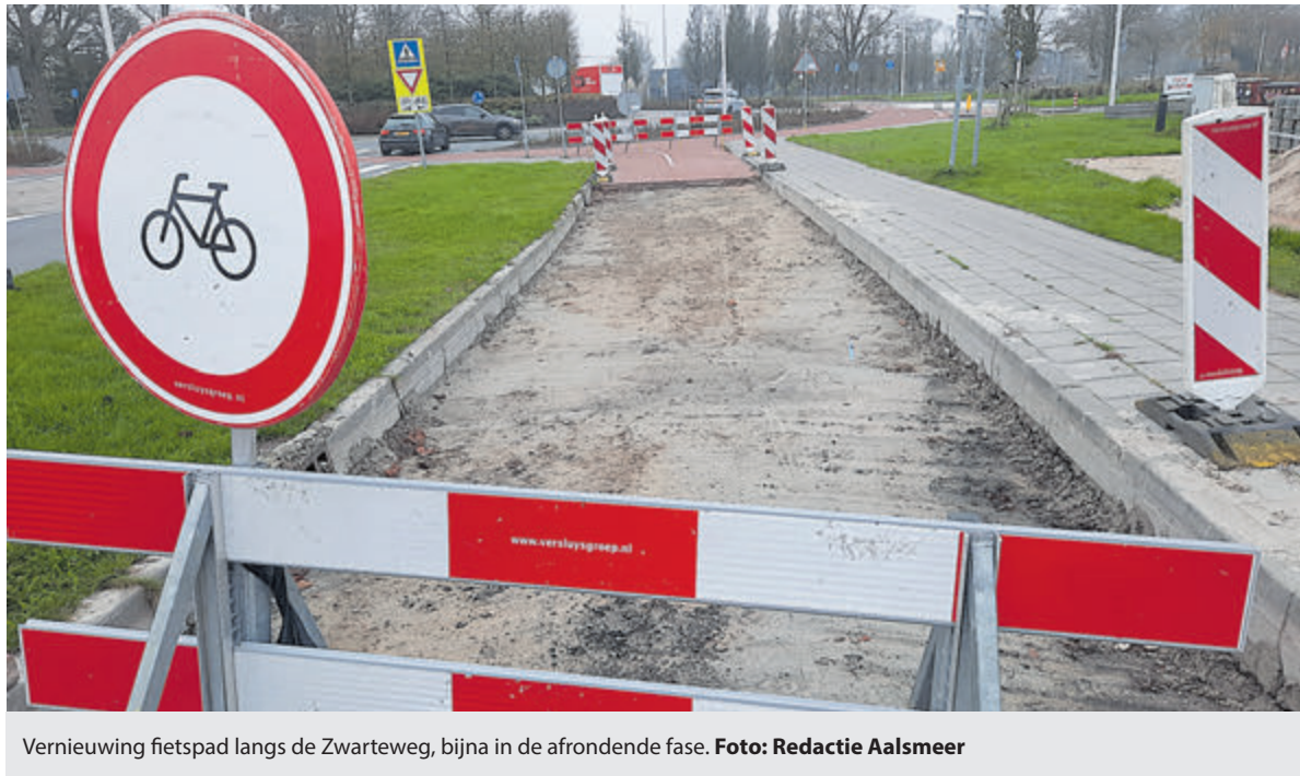
Vernieuwing fietspad langs de Zwarteweg, bijna in de afrondende fase.