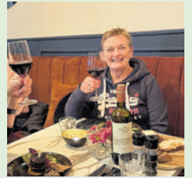
Proost op weer een jaar ouder, maar nog steeds op pad.