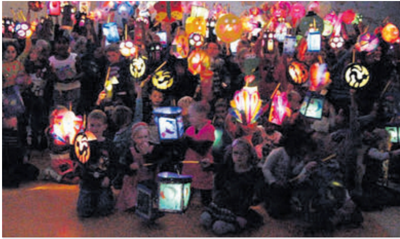
Sint Maarten: Met lampionnetjes langs de deuren.