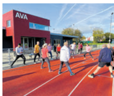
Zaterdagmorgen trainen op de atletiekbaan.

eerste wedstrijd. Kijk op www.avaalsmeer.nl voor alle informatie en het inschrijfformulier. Aanmelden kan via e-mail: maaie.vertregt@gmail.com of telefonisch bij Maaie: 06-34030118.