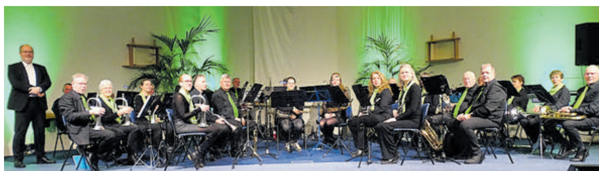
Receptie en concert Muziekvereniging Flora 125 jaar.

kanten, bestuur en dirigent dit heuglijke feit vieren met leden, oud-leden, donateurs en belangstellenden die de vereniging een warm hart toedragen om herinneringen op te halen tijdens een receptie op zondag 10 november in het clubgebouw aan de Wim Kandreef 1 te Kudelstaart. Iedereen is vanaf 15.00 uur van harte welkom. Om circa 15.15 uur zullen de muzikanten een concertje geven, daarna is er ruim tijd om herinneringen op te halen onder het genot van een drankje en een hapje. Wilt u aanwezig zijn dan is het fijn als u dit wilt melden via muziekvereniging.flora@gmail.com. De vereniging hoopt veel belangstellenden te mogen begroeten.