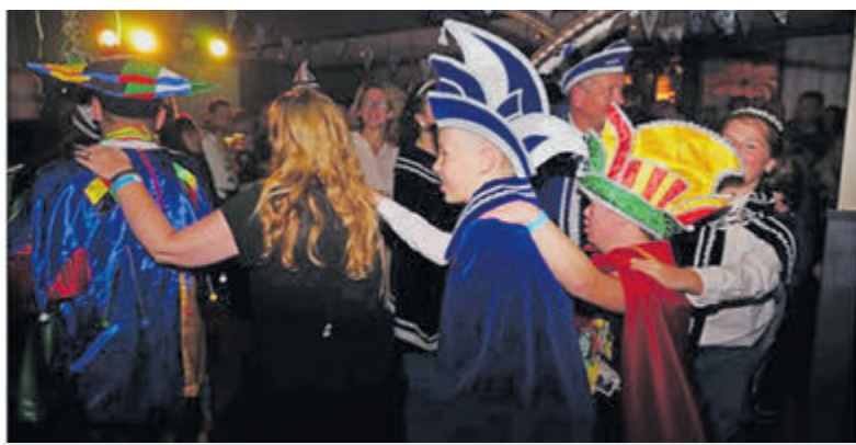
Carnavalsseizoen staat voor de deur bij de Pretpeurders.

kunnen deelnemen aan een prijsvraag door hun gok voor het carnavalthema vóór 21.11 uur in te leveren bij de muntverkoop, gebaseerd op hints die op de sociale media van de carnavalsvereniging zijn gegeven. De gelukkige winnaar maakt kans op 11 munten of mag zijn plek in de optocht kiezen. De deuren van het dorpshuis openen om 20.11 uur en de entree is gratis. Bereid je voor op een avond vol muziek, dans en plezier. Kom langs en beleef een avond vol verrassingen en feestelijke onthullingen. Mis het niet en neem al je vrienden mee!