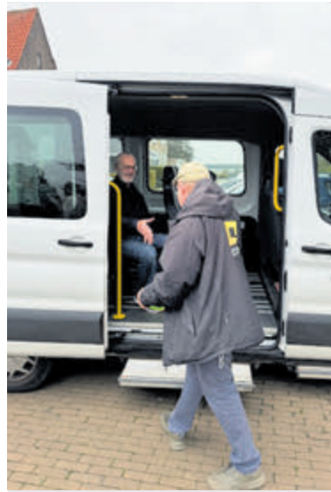
Bus van Zorggroep Aalsmeer die ouderen ophalen en weer thuis brengen. Er worden chauffeurs gezocht.

Omdat niet iedereen een beeld heeft bij deze functie en misschien wel vragen heeft over de werkzaamheden organiseert het Ontmoetingscentrum een bijeenkomst in gebouw Irene. Een medewerker en chauffeur zullen dan iets meer vertellen over de uitdagingen in het vervoer om op die manier vrijwilligers voor deze dienst te werven. De bijeenkomst is op dinsdag 3 december van 15.00 tot