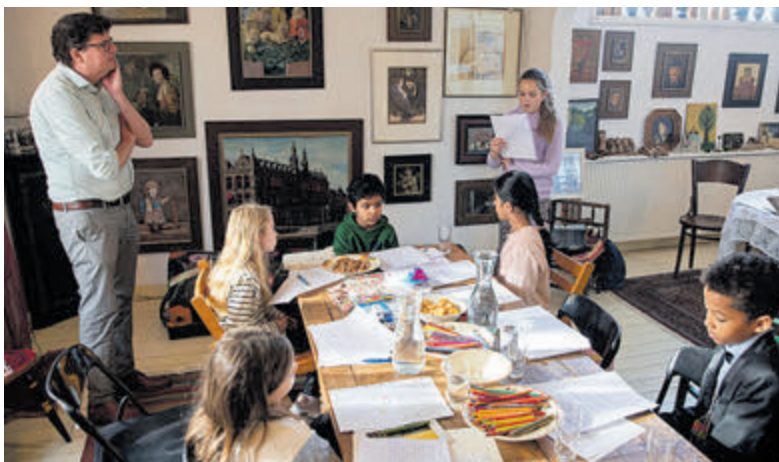
Gedichten voordragen tijdens de Schrijversparade.

liederen zo herkenbaar, dat allen uit volle borst mee hebben kunnen zingen. Mede door de uitstekende service en verzorging door de vrijwilligers van 't Anker en de eigen Zonnebloem vrijwilligers verlieten de gasten met rode koontjes de zaal om thuis nog wat na te genieten van deze spetterende middag en zich alvast te verheugen op de volgende activiteiten die de Zonnebloem afdeling Aalsmeer Rijsenhout nog in petto heeft voor dit jaar.