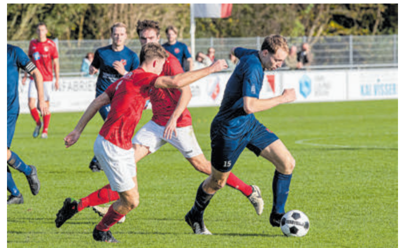
Bijna derby RKDES Kudelstaart tegen SCW Rijsenhout.