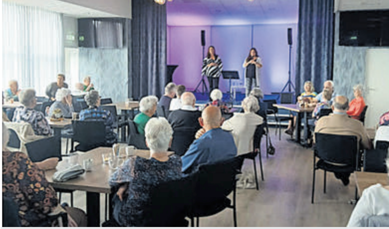
Muziekmiddag met de Zonnebloem Aalsmeer Rijsenhout.