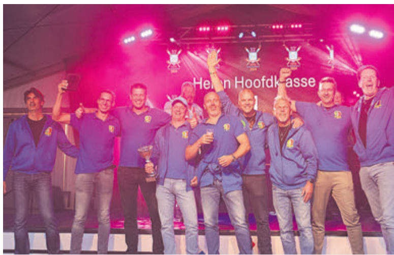
Westeinder Sloeproei Team winnaar van de Grand Slam.