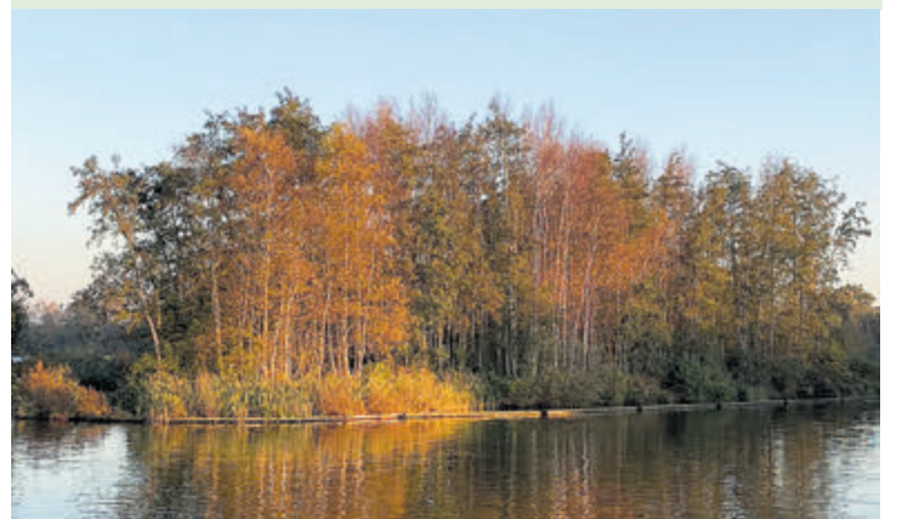
Herfstkleuren op de Westeinderplassen.

Het riet ruist wat met haar bijna pluizige pluimen; de okergele gloed over het bos verdwijnt in het diepblauw van de vroege avond; vogelgeluiden uit het berkenbos geven rust... Doodstil. Een flesje port steekt boven het rieten hengsel uit, ik schenk een glaasje in. In alle rust schrijf ik in mijn hoofd dit verhaal. De wens in mijn boek 'BOB in de Bovenlanden', om dodenakkers op aangekochte Westeinder eilanden van Stichting de Bovenlanden te maken, is helaas nog niet werkelijkheid geworden. Hopelijk gaat, deze nu nog droom, in mijn leven wel gerealiseerd worden. Natuurlijk is het ook eigenbelang. Als as, in een afbreekbare urn, wil ik daar op 'Dodenakker De Eik', of onder de berk van 'Dodenakker De Berk', graag het tijdelijke voor het eeuwige verruilen. De akkers gebruiken als laatste rustplaats zou veel toevoegen aan het leven na de dood...het maakt de cirkel rond. Mijn kist staat al klaar, beschilderd met fantasiebloemen, en doet nu dienst als mijmerbankje in ons tuinhuis. Later is er plaats voor mijn oude bloemenmand, mijn levenslange metgezel, gevuld met bloemen, bloemen en nog eens bloemen. Het wordt koud, ik trek mijn jas aan, zet de fles terug in de mand, zwaai nog even naar de verweerde bemoste bloemenmand en vaar terug naar Vrouwentroost... Reacties zijn altijd welkom: bob.plaswijck@planet.nl