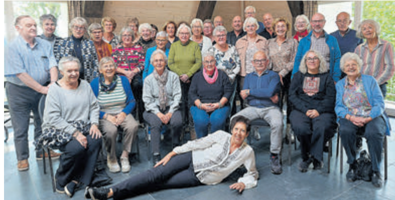
Kooruitje voor leden van ACOV in Noord Brabant.

Fools Live), Ab Hansen (Blood Sweat & Kiers, Remband), Remco de Hundt (Remband) en Bart Vreken (ex-Hucksters) gaven het nummer kleur. Een catchy, feelgood song over de plek waar ze allemaal zo graag spelen! In het diepste geheim werd er ook een videoclip gemaakt, op een vroege zondagochtend bij The Shack. Het moest tenslotte een verrassing blijven. Niet veel later werden Berry en Rian met een smoes naar de Shack gelokt en werd het resultaat met gepaste trots en met groot succes vertoond. Beide eigenaren waren zichtbaar verrast en verguld met dit prachtige eerbetoon. "Come to The Shack" van The MotherShackers is te beluisteren en te bekijken op Spotify, Tiktok en Youtube. Eind december wordt het nummer voor het eerst live gespeeld bij de 'Bye 2024 party', uiteraard in The Shack!