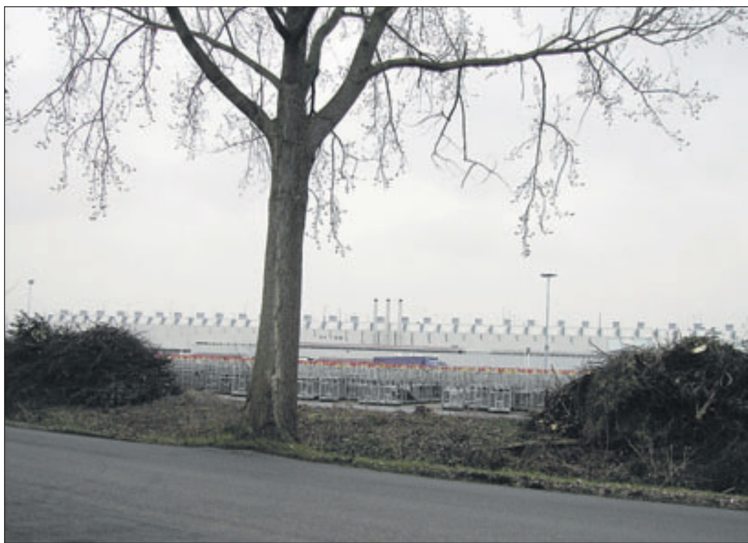
De kaalslag bij Molenvliet en de Hornweg. Er is (helaas) nu vrij uitzicht op de karrenopslag van de veiling.