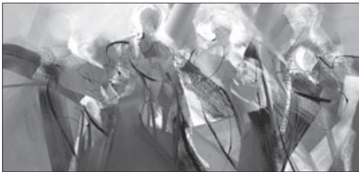
Schilderij Peter Meijer

maandag 3 maart als de kavels voor de schriftelijke veiling bekijken worden. De schriftelijke veiling is ook in te zien tijdens de ruilbeurs van zaterdag 15 maart en de verenigingsavond van maandag 7 april. De zaal is maandagavond al om 19.00 uur open en de veilingkavels zijn dan direct te bezichtigen. Wilt u weten wat er allemaal geveild wordt? Kom kijken. Nieuwsgierig, maar geen lid van de vereniging, meldt u dan aan als aspirant lid bij een van de bestuursleden.