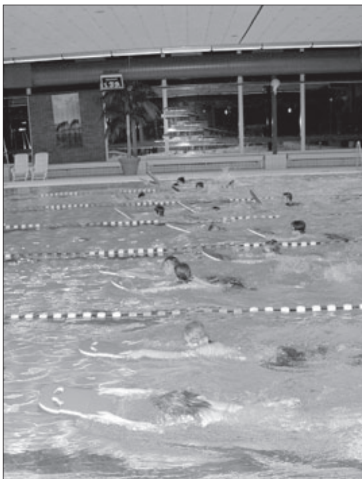
De handballers van de talentopleiding in het zwembad.

Binnenkort worden de diploma's op zaterdagmiddag uitgereikt tijdens een feestelijke afsluitingsmiddag van het schaatsseizoen 2007-2008.