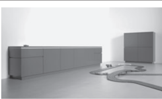
Cube - het veelzijdige kastensysteem van interlücke - show en advies -

het oog, maar om tot verder onderzoek naar en vervolging van de daders over te kunnen gaan, is het noodzakelijk dat er aangiften zijn van gestolen of vernielde fietsen. Het wijkteam Aalsmeer verzoekt dan ook iedereen die de afgelopen 3 weken in de omgeving van het busstation of de Ophelialaan slachtoffers zijn geweest van diefstal of vernieling van zijn/haar fiets, en daar nog geen aangifte van heeft gedaan, dat alsnog te doen op het politiebureau aan de Dreef in de Hormmeer. Daarbij maakt het niet uit of u het merk en/of frame-nummer van uw fiets nog weet.