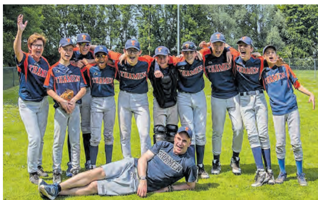
HB Aspiranten van Thamen winnen bij Hilversum.