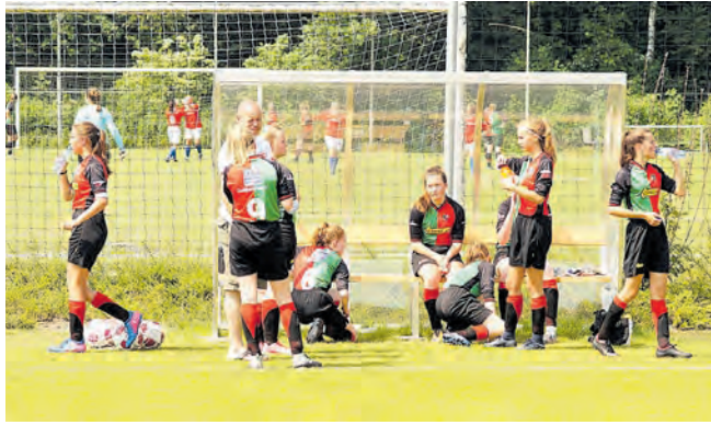
De FCA meiden waren blij met de ingelaste drinkpauze's.