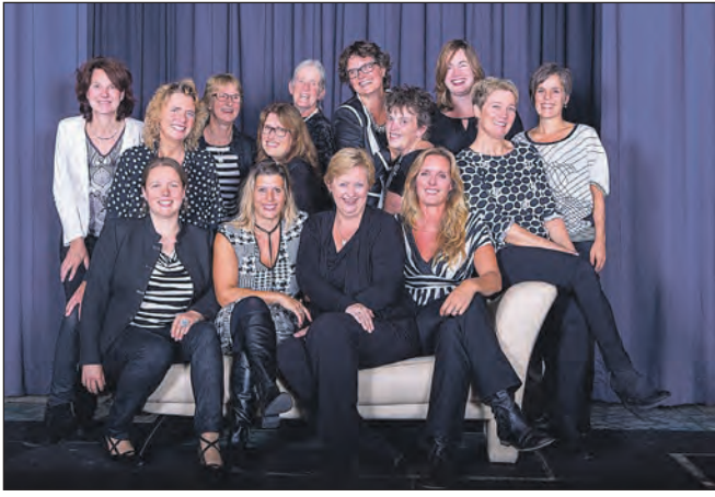
Vrouwenkoor Davanti.