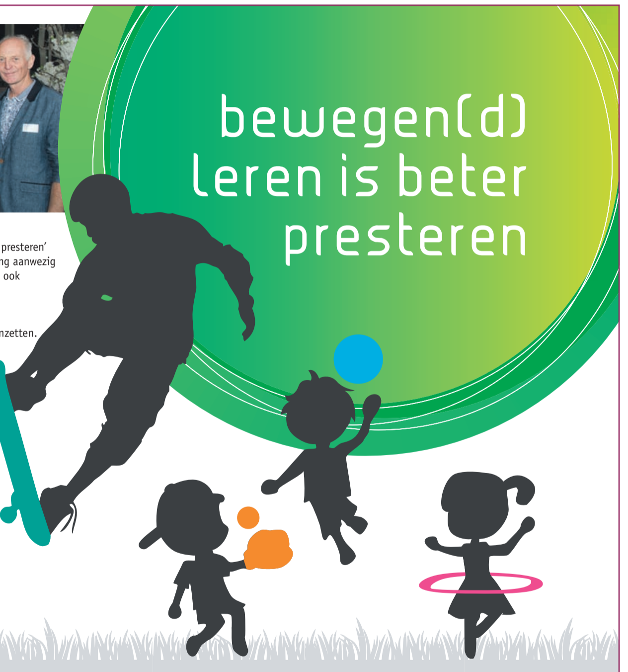
De Aalsmeerse studiedag "Bewegen(d) leren is beter Presteren" is door de drie schoolbesturen (Jong Leren, Stichting Auro en Stichting Katholiek Onderwijs Aalsmeer), de gemeente Aalsmeer, JOGG Aalsmeer en Team Sportservice gezamenlijk georganiseerd. Een unieke samenwerking die smaakt naar meer!