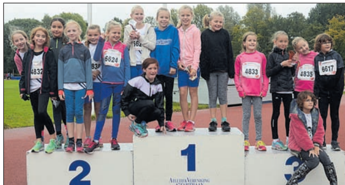
Alle meisjes B pupillen van AV Startbaan.