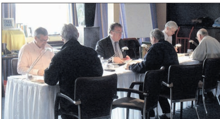
De taxatiedagen werden tijdens voorgaande edities goed bezocht.

(040- 2123455), Romunt B.V. Numismatiek uit Roermond (0475-316010) en Mevius Numisbooks Int. B.V. uit Vriezenveen (0546-561322), samen goed voor meer dan 100 jaar aan kennis en ervaring. Zij taxeren kosteloos de door bezoekers meegebrachte munten, penningen en bankbiljetten op basis van de huidige marktwaarde. U kunt terecht op zaterdag 14 oktober in De Vrijburcht, Vrijburglaan 2 te Heems-kerk, op zondag 15 oktober in het