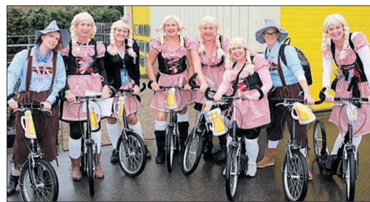
Originaliteitsprijs voor het team 'Stepsisters in de Alpen'.