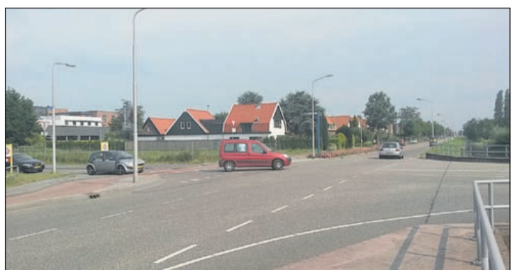
Het kruispunt Machineweg met de Catharina Amaliaaan en de Middenweg is één van de punten waar maatregelen worden getroffen om de veiligheid te verhogen.