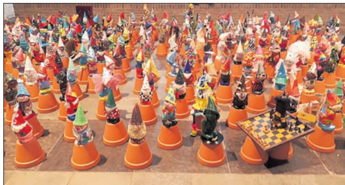
De kabouters houden 'vergadering' in het gemeentehuis. In het programma 'Vrijdagavondcafé' meer over dit project van de Kunstploeg.

Ook kunnen bezoekers meedoen met diverse raadspelletjes waaronder de waarde van een boodschappenmand en kan eenieder zijn of haar geluk beproeven bij de enveloppenkraam en de muizenbak. Ook is er een goedgevulde kraam met tweedehands boeken aanwezig, zijn er oud-Hollandse spelletjes en nog veel meer. Tevens worden er loten verkocht à 3 euro (4 voor 10 eu-