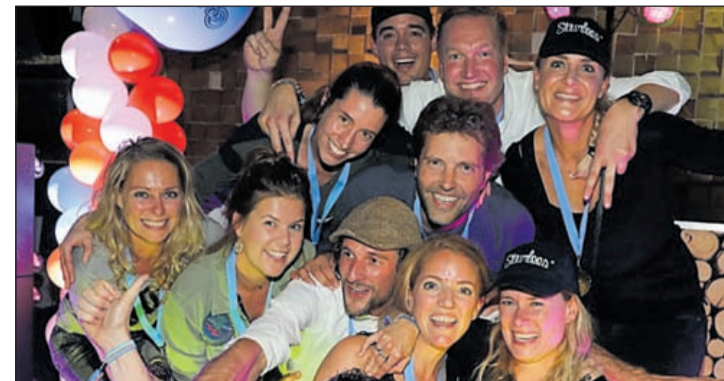
De eerste prijs is gewonnen door het team 'Stuurloos'.

Deze Aalsmeerse onderwijsmiddag 'Bewegen(d) leren is beter Presteren' is door de drie schoolbesturen (Jong Leren, Stichting Aurora en Stichting Katholiek Onderwijs Aalsmeer), de gemeente Aalsmeer