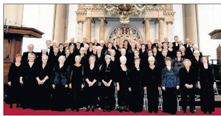
Het huidige Koninklijke Toonkunstkoor Aalsmeer.