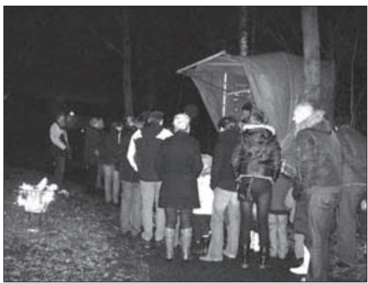
Natuurlijk werd er ook gezongen tijdens het Kerstspektakel, waarna de kelen werden gesmeerd met koffie en thee.

volle avond van te maken. De route op Boerenvreugd waaraan de stal-letjes met optredens plaatsvonden, was gemarkeerd met tal van waxinelichtjes en er stonden vuurkorven. Alles om de kerstsfeer te verhogen en die was dan ook hoog! De Brulboeien (met uiteraard een aangepast 'kerstrepertoire') en het koor Cum Ecclesia zorgden voor toepas-selijke muziek. Versnaperingen konden binnen worden gekocht en daar kon je ook even stilstaan in de stal, bij Jozef en Maria en het kindje Jezus. Al met al een zeer gewaardeerd Kerstspektakel!