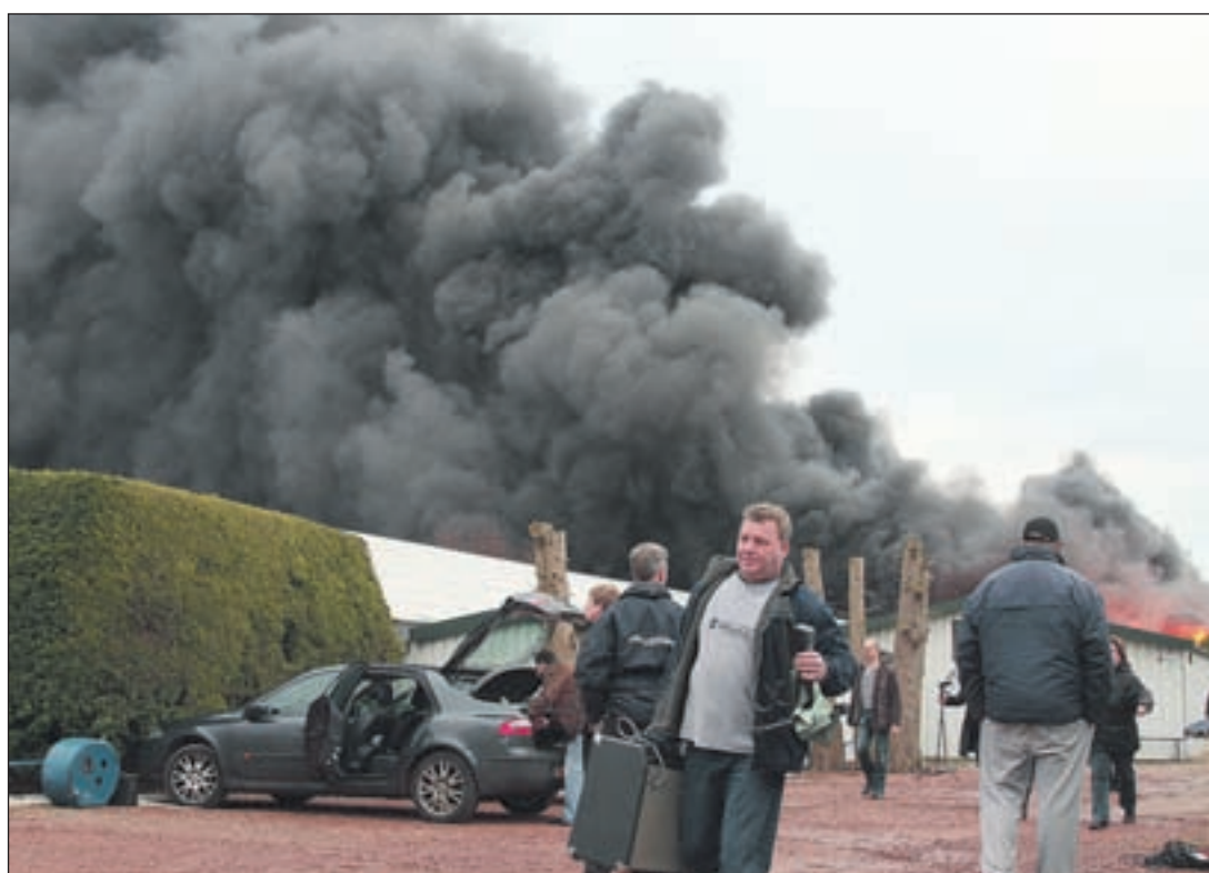
Redden wat er te redden valt. Deze versterker is in ieder geval niet in rook opgegaan...