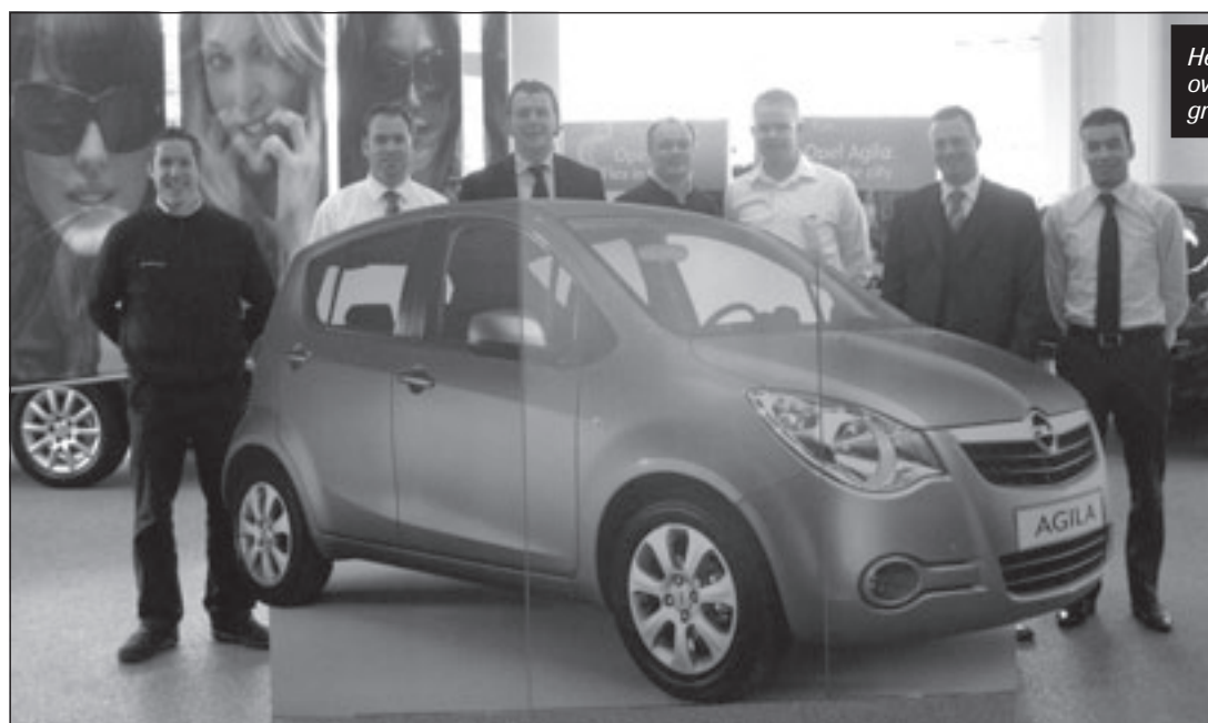
Het verkoopteam van Van Kouwen is al overtuigd van de nieuwe Agila en wil dit graag met u delen!

Mijdrecht - Eindelijk is het zover! Op tweede paasdag arriveert de nieuwe Opel Agila in de showrooms bij de Van Kouwen Groep. Bij zo'n mooie gelegenheid hoort een pas-