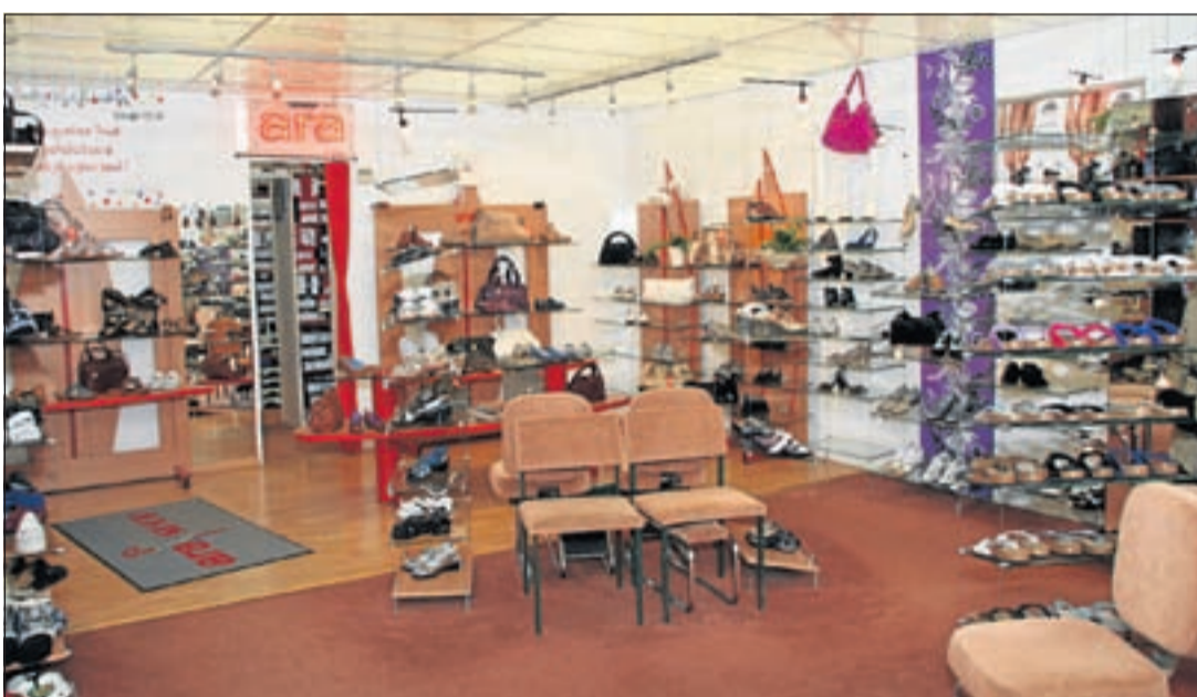
Smit Schoenen & Lederwaren is nog tot september 2012 gevestigd in winkelcentrum De Lindeboom