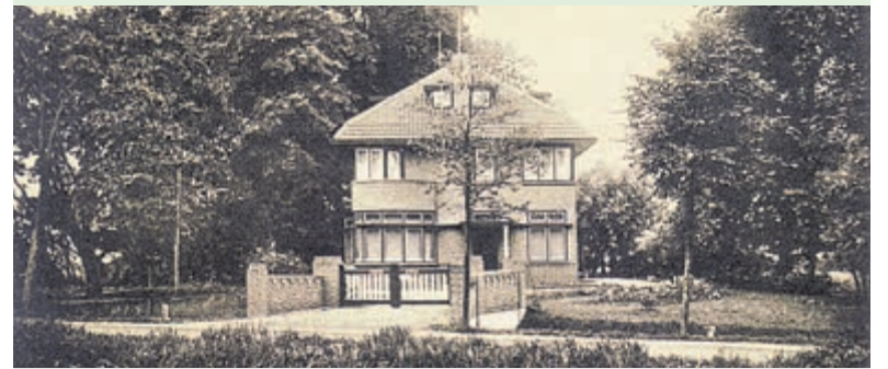
De vroegere Vinkeveense burgemeesterswoning.