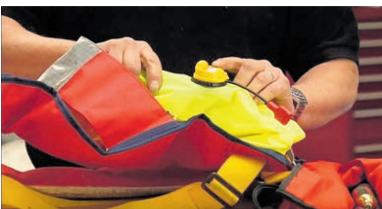
Laat je reddingsvest keuren.

heid voor alles. Dat kan onder meer bij Intersport-vestigingen in de uitgebreide regio. Veiligheid op het water is van het grootste belang. Een goed werkend