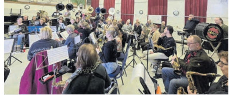
Bomvolle play-in bij muziekvereniging VIOS. Foto is aangeleverd.

natuurspeelplek heeft de initiatiefnemers er in 2022 toe aangezet een plan te maken de speelplek nog verder uit te breiden. Tijdens een ronde langs de scholen in Wilnis is de kinderen gevraagd wat zij nog graag aan de natuurlijke speelplek willen toevoegen. Een landschap-ontwerper is met de antwoorden aan de gang gegaan en heeft een ontwerp gemaakt voor de uitbreiding. Dat ontwerp is klaar en de uitbreiding bestaat daarmee uit de volgende elementen: een laag houten klim/klauter-balanceerparcours met struipaden in en bij de bosjes tussen de waterpomp en het voetpad aan de oostzijde; een kleine, ondiepe waterpartij met avontuurlijke overgangen; een lage heuvel; een picknicktafel en een boombank; een tipi (Indiaanse tent) met plateau; een informatiepaneel. Om de uitbreiding te kunnen financieren, hebben de initiatiefnemers Stichting Natuurspeelplekken De Ronde Venen opgericht. Daarna zijn zij op zoek gegaan naar financiering om het plan te realiseren. Er zijn diverse fondsen en donateurs aangeschreven en sponsoracties opgezet, waardoor de uitvoering van het ontwerp kan worden gestart.