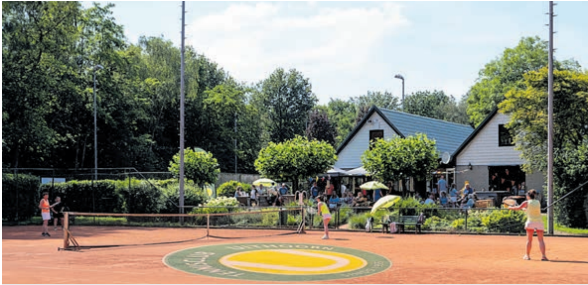
Het toevoegen van padelbanen geeft een nieuwe impuls aan de tennisvereniging. Foto is aangeleverd.