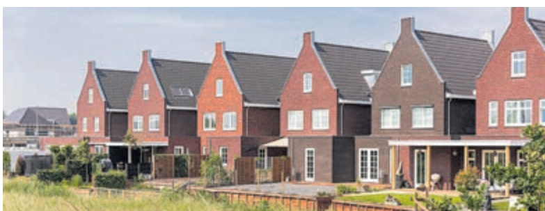
Vinkeveld in Vinkeveen.

In De Ronde Venen ligt de gemiddelde vraagprijs voor een woning aanzienlijk hoger, namelijk rond de € 918.364,-. Dit verschil kan deels worden verklaard door de aanwezigheid van duurdere woningtypes, zoals villa's, die goed vertegenwoordigd zijn in dit gebied. De gemiddelde verkoopduur van woningen in De Ronde Venen is 27 dagen, wat nog steeds relatief snel is, maar iets langer dan in Uithoorn. De gemiddelde vierkantemeterprijs in De Ronde Venen is € 5.704,-, wat een forse stijging is ten opzichte van het vorige jaar. Beide gemeenten hebben hun eigen unieke kenmerken en voordelen. Uithoorn biedt een iets betaalbaarder alternatief met een snelle doorlooptijd voor woningverkoop, terwijl De Ronde Venen hogere prijzen heeft, maar ook een breder scala aan luxere woningen. Voor potentiële kopers is het belangrijk om deze factoren in overweging te nemen bij het maken van een beslissing.