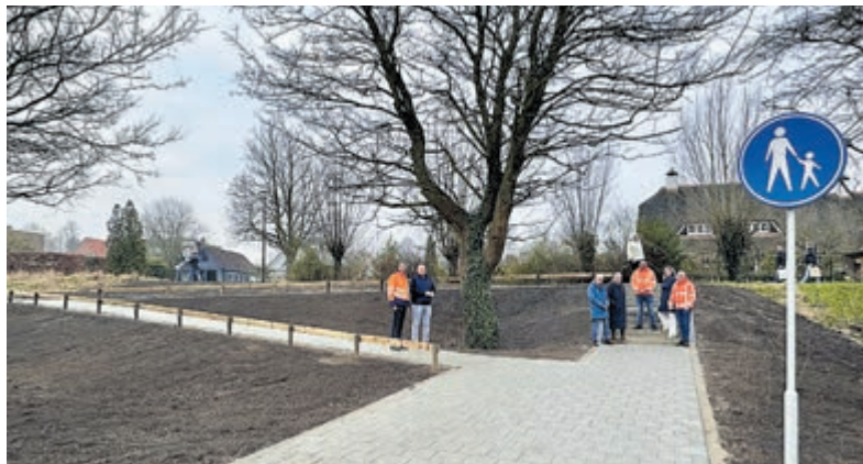
Bewoners wijk Aan het Spoor, voorbijgangers, aannemersbedrijf A. van Ooijen & zn. B.V. en wethoudster Anja Vijselaar bewonderen het eindresultaat. Foto is aangeleverd.