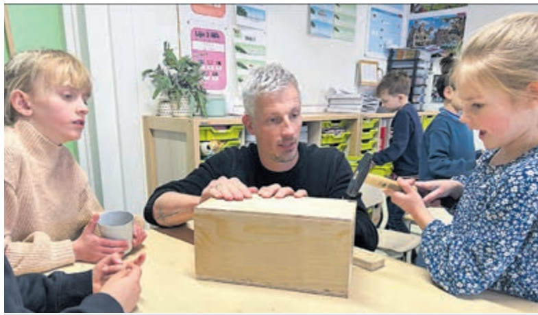
"Ik wil timmervrouw worden, dit werk is superleuk." Foto is aangeleverd.