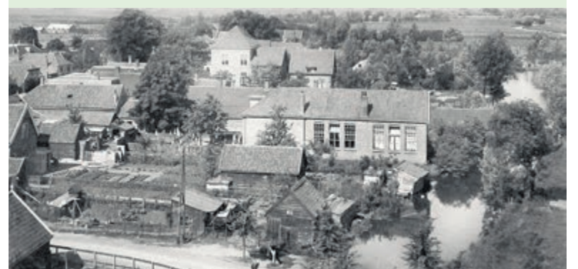
Wilnisdorp in vogelvlucht. Foto is aangeleverd.

Het verhaal 'Voetstappen door De Hoef' is een reis door de tijd over hoe men van een moerasgebied uiteindelijk landgrond maakte en hoe het een gebied werd waar men op meerdere manieren voedsel kon produceren. Een speciaal verhaal over Ad Bestman, 'een blinde politicus die het goed zag', geeft een interessante kijk op de kwaliteiten van deze oud-burgemeester van Abcoude. Als suppoost voor het helaas gesloten museum 'De Ronde Venen' heeft Dick Koeleman (Wilnis) zich verdiept in de materie van het veen. In deze editie bespreekt hij de verveningsbegrippen in de Ronde Venen.