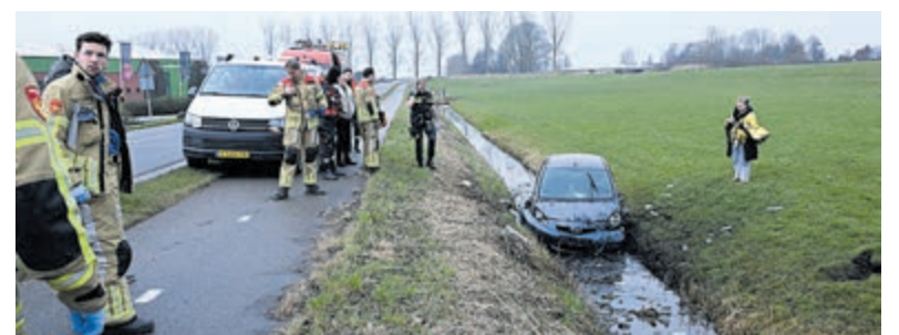
Twee keer over de kop en toch rechtopstaand in de sloot.

niets en met enige hulp van een agent wist ze door het portieraam uit de auto te klimmen. Via een loopplank van de inmiddels gearriveerde brandweer kon ze de sloot oversteken. Ze is nog nagekeken door ambulancemedewerkers, maar hoefde niet mee voor verder onderzoek. Ook duikers van de brandweer kwamen met spoed ter plaatse, maar ingrijpen was niet nodig. De auto is total loss.