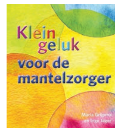
De workshop is gratis. Foto is aangeleverd.

visie van Positieve Gezondheid. De oefeningen helpen mantelzorgers om hun eigen situatie beter te begrijpen en hier op een positieve manier invloed op uit te oefenen. "Klein geluk voor de mantelzorgers biedt de vijf miljoen mantelzorgers die Nederland rijk is allerlei mogelijkheden om goed voor zichzelf te zorgen. Helaas is er niemand die we zo slecht behandelen als onszelf. Dat is wonderlijk, we zorgen direct gul voor een naaste. Maar we tuimelen vrijwel direct in de valkuil om onszelf daarbij te vergeten." Meedoen aan de workshop? Meld je aan via: mantelzorg@stichtingsamens.nl of tel: 0297 - 230 280.