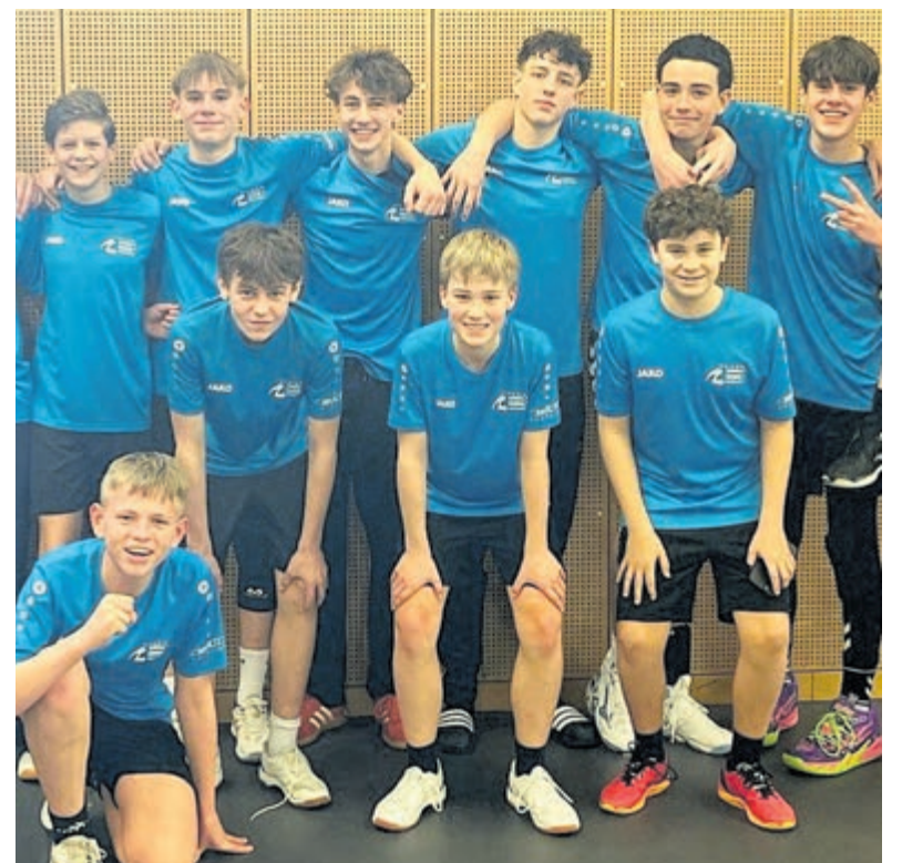
Bij Handbalschool Amstelland krijgen jonge spelers extra trainingen.

Op dit moment is het weer mogelijk om u aan te melden om op maandagavond gezellig te komen bridgen. Voor nadere informatie: Kees Visser, tel. 06 - 5317 5165 of via de mail naar kees.visser55@kpnplanet.nl .