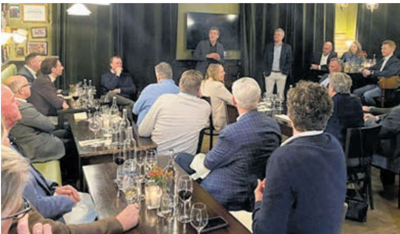
Ondernemersdiner bij Loyals Groep in Mijdrecht. Foto is aangeleverd.

verandering een aantal klassieke slagwerkstukken uitgekozen en blazersdocent Diederik was wat meer de poprichting opgegaan. De dag werd afgesloten met een klein concert voor veel publiek. Met zo'n evenement als dit kan een jubileumjaar al niet meer stuk. Alle aandacht gaat nu uit naar het volgende hoogtepunt: zaterdag 5 april is de jaarlijkse seizoenpresentatie met bijzondere optredens, 's avonds in sporthal de Phoenix.