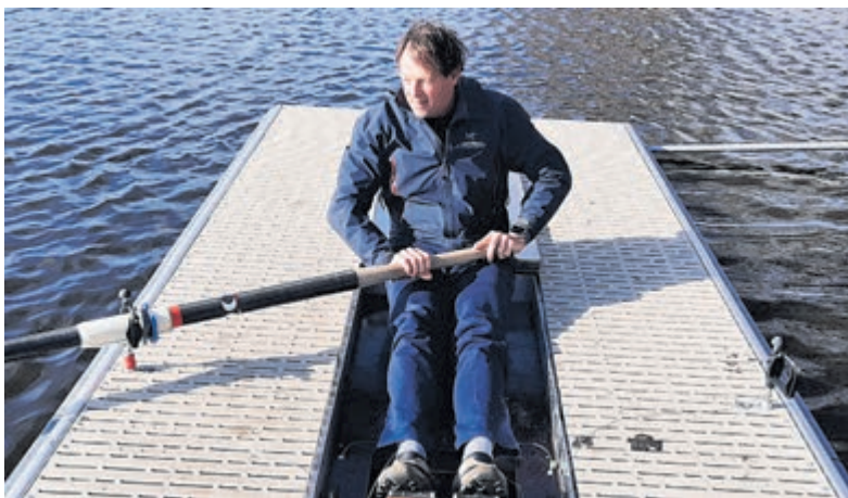
Zondag 23 februari werd de roeibak officieel in gebruik genomen. Foto is aangeleverd.

teiten, gericht op techniek, tactisch inzicht en fysieke en mentale weerbaarheid. "Ons doel is om talenten te begeleiden naar de nationale en internationale top en de handbalsport verder te laten groeien. Met de Toplijn-status zetten we een nieuwe stap in talentontwikkeling en hopen we nog meer spelers te inspireren en te motiveren." Wil jij meer weten over Handbalschool Amstelland of je aanmelden? Neem contact met op via https://handbalschoolamstelland.nl/contact .