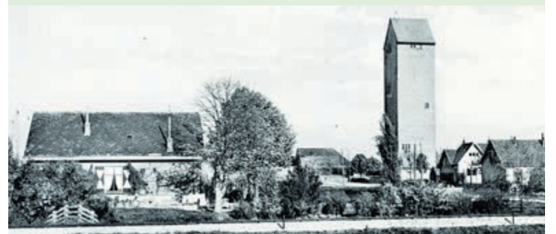
Industrieweg, Nutslaan, Watertoren Mijdrecht.