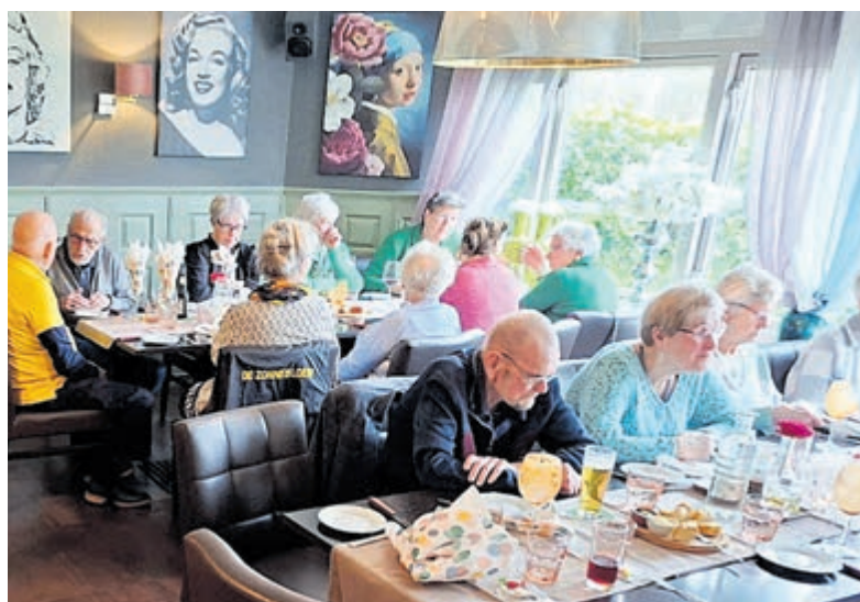
Genieten bij Jettiez in Mijdrecht.

Dat bestond naar keuze uit varkenshaas of een gebakken zalmoot met garnituur. De maaltijd werd afgesloten met koffie of thee. Er werd gezellig gebabbeld en de tijd vloog om.