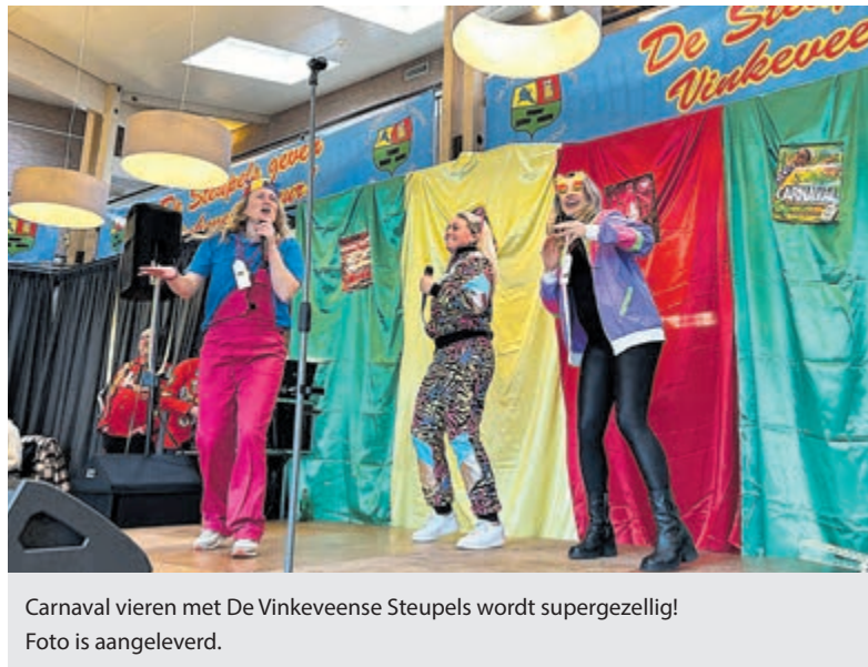
Carnaval vieren met De Vinkeveense Steupels wordt supergezellig! Foto is aangeleverd.