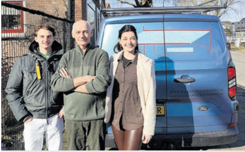
Familiebedrijf Scheepers/Wijffes Zonwering.

1 EN 2 MAART OPEN DAG BIJ SCHEEPERS/WIJFFES ZONWERING IN DE KWAKEL