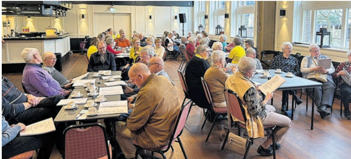
Maar liefst zestig gasten waren van de partij op de jaarlijkse Ontmoetingsdag in 't Oude Parochiehuis. Foto's zijn aangeleverd.