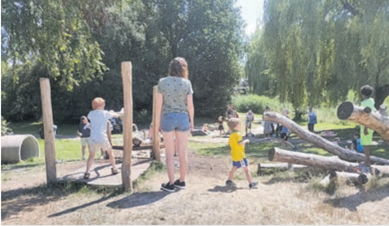
De opening van de natuurspeelplek in Het Speelwoud in 2022. Foto is aangeleverd.