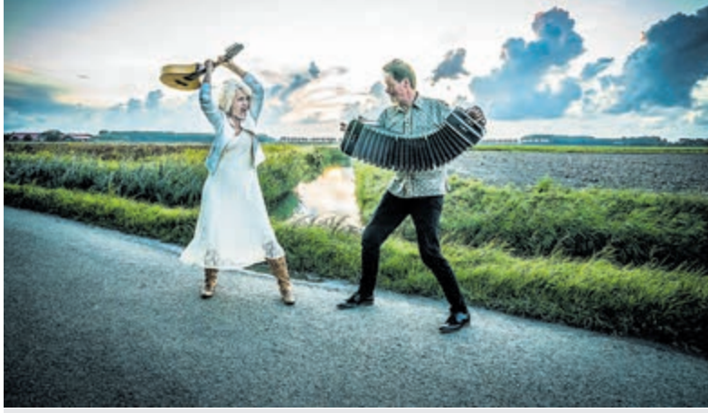
'Melancholie in de polder'. Foto is aangeleverd.