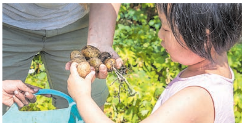
Eten uit eigen tuin, ver weg en in Wilnis. Foto is aangeleverd.

tuinclub beleven kinderen de natuur in en rondom de moestuintjes in de tuin. Ze zaaien hun groenten, onderhouden hun tuintje, oogsten en eten