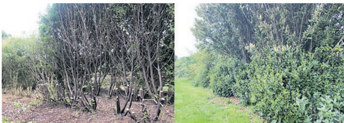
Situatie vlak na de snoeiwerkzaamheden en het toekomstige resultaat. Foto is aangeleverd.

Dieren en broedseizoen Het broedseizoen loopt van maart tot juli. Daar houden we met het snoeien van de beplanting uiteraard rekening mee. Voor aanvang van het snoeiwerk controleert de aannemer of er vogelnesten en/of egels aanwezig zijn. Als blijkt dat dit zo is, slaat de aannemer die locatie over en wordt deze dus niet gesnoeid.