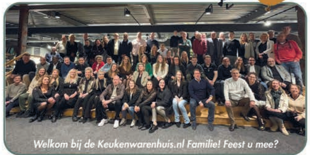
Welkom bij de Keukenwarenhuis.nl Familie! Feest u mee?

Met trots nodigen wij u graag uit om deze week op ons jubileumfeest te komen. Profiteer nu van onze jubileum acties, in de grootste keukenshowrooms van Nederland, met de allernieuwste keukenmodellen met keukens voor ieder budget in alle kleuren. Nu ook zelfs duizend luxe keukens welke binnen 7 dagen leverbaar zijn!