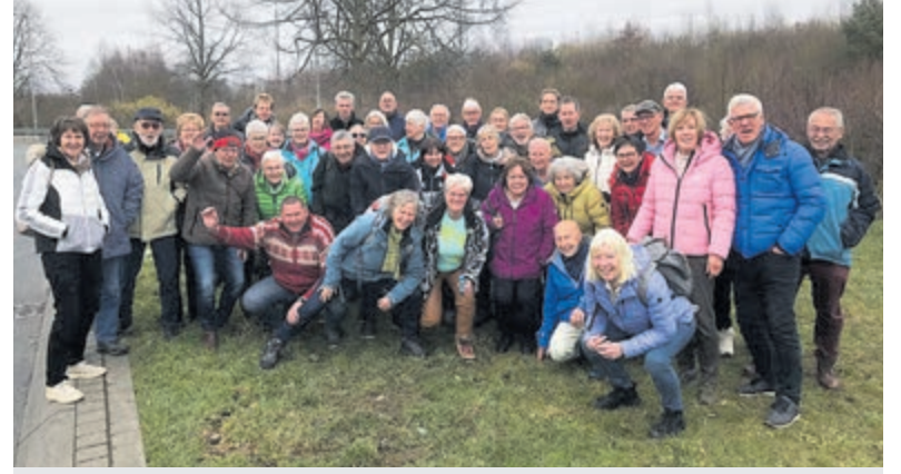
De deelnemers aan de winteractief-reis van Senior Sportief Actief. Foto is aangeleverd.