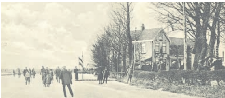
Abcoude, ijspret. Foto aangeleverd.

stelling in deze reeks is zaterdag 1 juni a.s. in het Piet Mondriaanhuis te Abcoude, aan de Broekzijdselaan 46. De voorstelling begint om 13.30 uur. De zaal is open vanaf 13.00 uur. Kaarten zijn vanaf maandag 13 mei a.s. verkrijgbaar bij Fred Abcoude, Hoogstraat 32. De kaarten geven