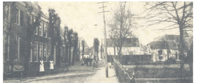
Abcoude, Hoogstraat.

Voor de filmmiddag 18 mei in Vinkeveen zijn de kaartjes te koop bij Albert Heijn, Herenweg en Jumbo, Winkelcentrum Zuiderwaard.