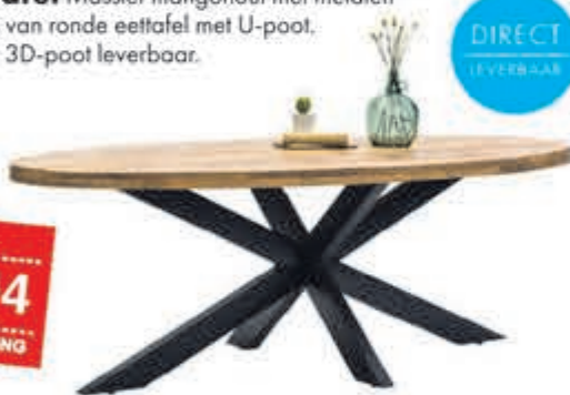
Melbourne eettafel Massief mangohout met metalen onderstel. Prijs op basis van ronde eettafel met U-poot. Ook als ovale tafel met 3D-poot leverbaar.

normaal 599,- nu 495,04 MET 21% BTW KORTING