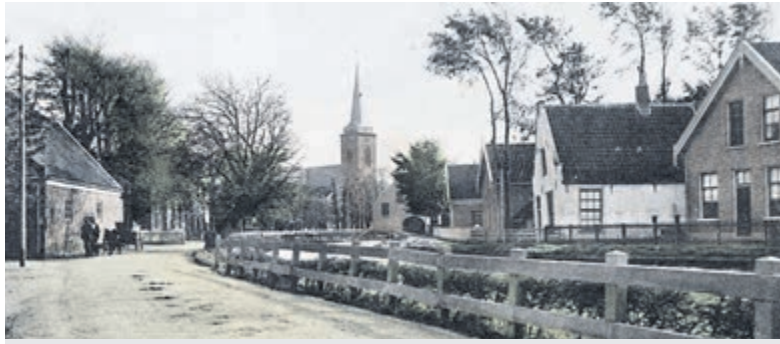
Abcoude, gezicht op het dorp (1904).