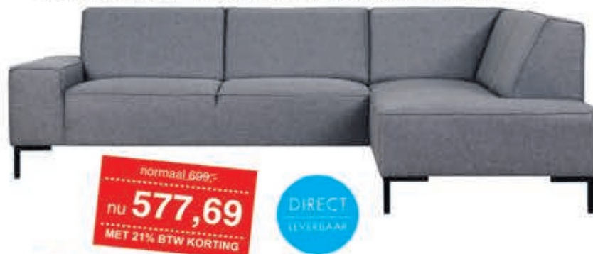
Woonlandschap Mondial Moderne hoekbank in Stofcategorie 1. Diverse bekledingen en kleuren leverbaar. Ook gespiegeld mogelijk.

normaal 699,- nu 577,69 MET 21% BTW KORTING