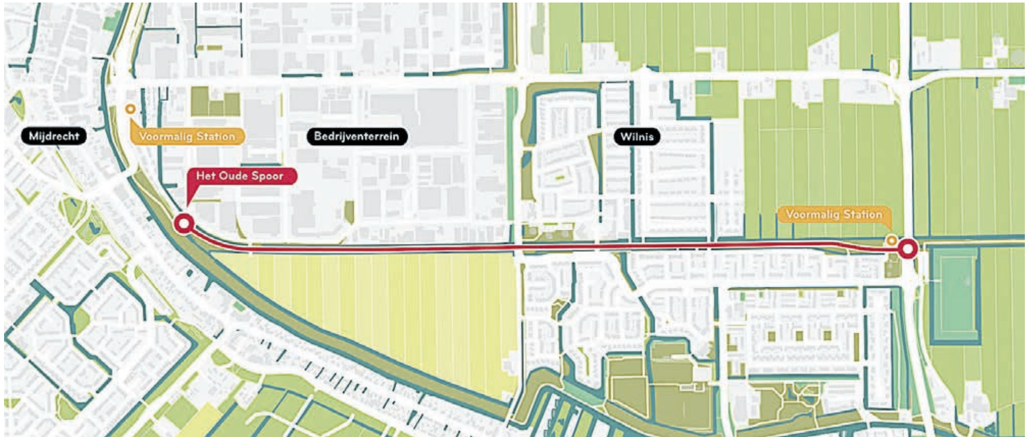
Het Oude Spoor tussen Mijdrecht en Wilnis.