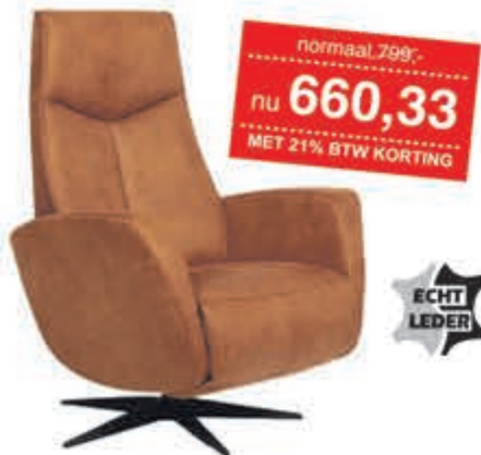
Relaxfauteuil Reno Heerlijke design relaxfauteuil. Manueel in Cat. 1 Leder.

normaal 799,- nu 660,33 MET 21% BTW KORTING