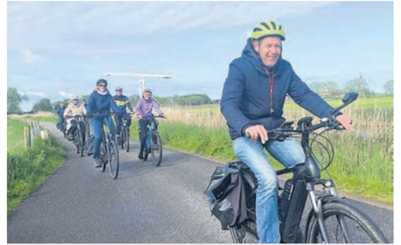
Onderweg met de nieuwe E-bike groep. Foto aangeleverd.

Zaterdag a.s. speelt Argon thuis tegen De Jodan Boys.