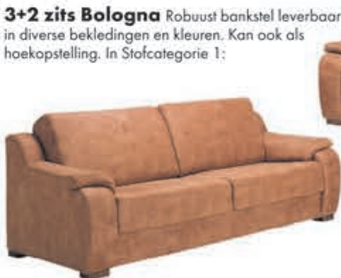
3+2 zits Bologna Robuust bankstel leverbaar in diverse bekledingen en kleuren. Kan ook als hoekopstelling. In Stofcategorie 1:

normaal 999,- nu 825,62 MET 21% BTW KORTING