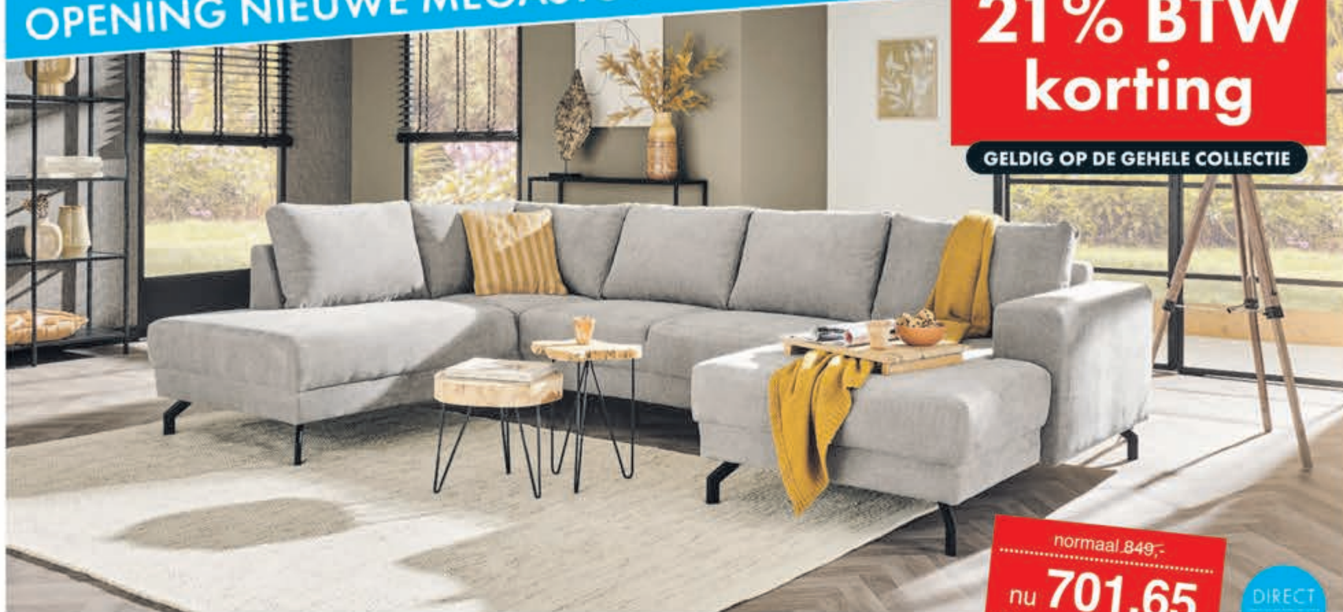
Hoekbank Capri In stof Supreme. Als Terminal-1+Hoek+2+Longchair: normaal 1249,- nu 1032,23. Leverbaar in diverse bekledingen en kleuren. Als Terminal-1+Hoek+2:

normaal 849,- nu 701,65 MET 21% BTW KORTING