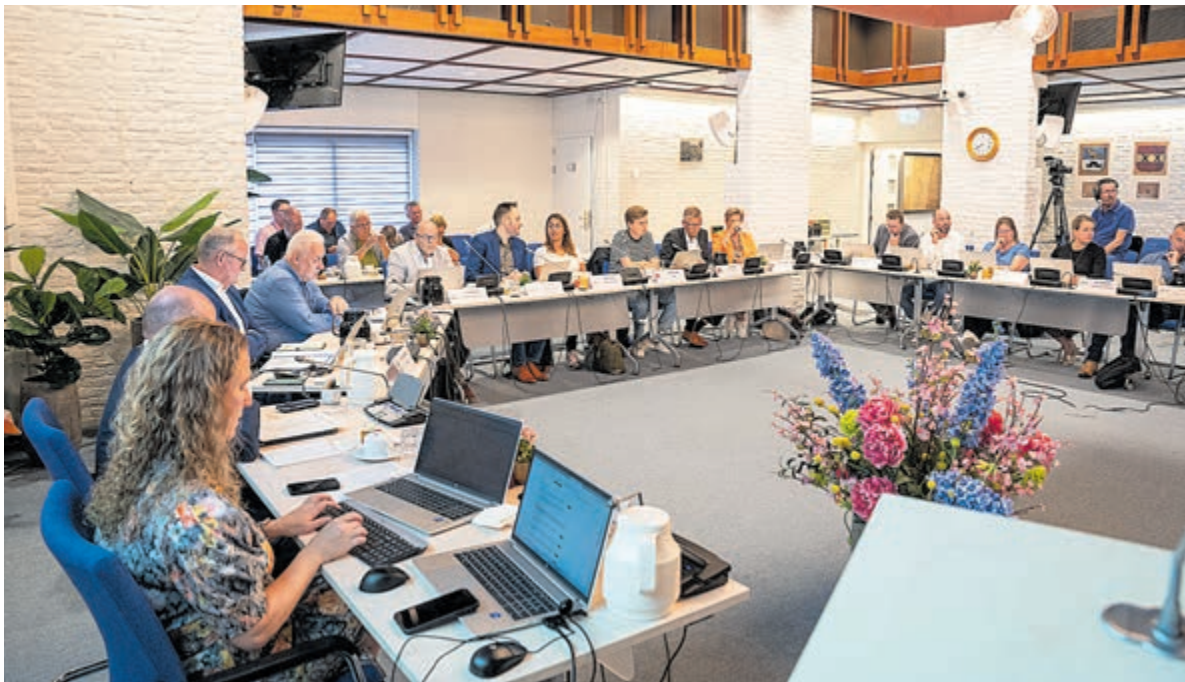
De gemeenteraad in vergadering bijeen.