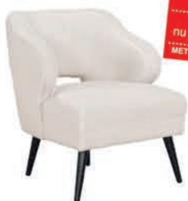
Fauteuil Sienna Trendy fauteuil met klassieke uitstraling. Heerlijke zit door de gewelfde rug. Leverbaar in meerdere stoffen. In stof Supreme.

normaal 249,- nu 205,79 MET 21% BTW KORTING