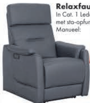
Relaxfauteuil Minardi In Cat. 1 Leder, elektrisch 2 motoren met sta-opfunctie 1199,- nu 990,91. Manueel:

normaal 799,- nu 660,33 MET 21% BTW KORTING