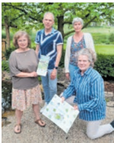
Een aantal van de enthousiaste tuincoaches.

zich prettiger in het groen. Geluid wordt minder weerkaatst in een groene tuin ten opzichte van een betegelde tuin. Een groene tuin filtert de lucht en fijnstof wordt