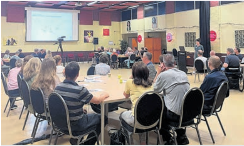
De bijeenkomst in de Willisstee op 14 mei 2024. Foto aangeleverd.