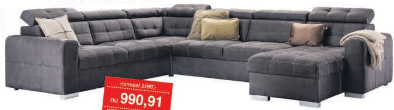
Hoekbank Island In stof Supreme. Leverbaar in diverse bekledingen en kleuren. Als 3+Hoek+3+Longchair: normaal 1699,- nu 1404,13. Als 3+Hoek+3:

normaal 1199,- nu 990,91 MET 21% BTW KORTING