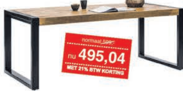
Glenwood eettafel Massief mangohout met staal in maat 160cm. Meerdere maten leverbaar.

normaal 599,- nu 495,04 MET 21% BTW KORTING