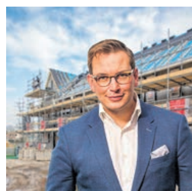
Fractievoorzitter CDA, Rein Kroon