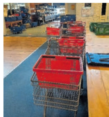
Alle foto's aangeleverd.