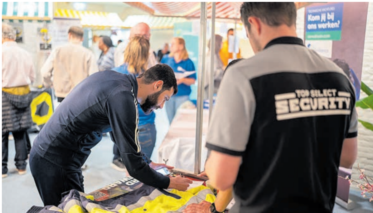
Contacten worden gelegd en gegevens worden uitgewisseld.