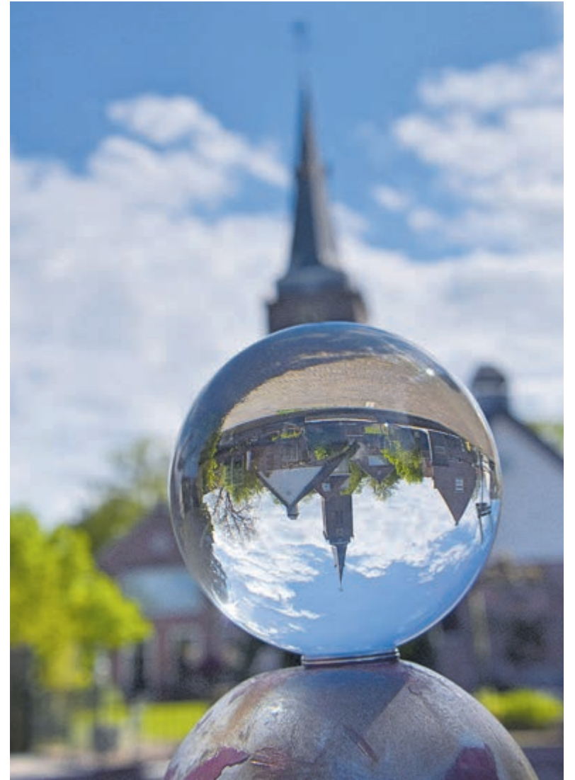
Toverfoto juni 2024

hebben hieruit een winnares getrokken en Caroline Scheltes is verrast door Fotograaf Wilco, die persoonlijk een lekkere IVI-taart kwam brengen. Zij kreeg ook de originele foto afgedrukt en in JPEG bestand.