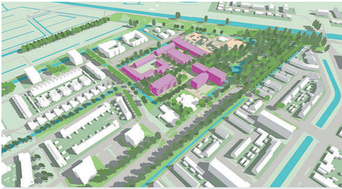
Tekening gemeente De Ronde Venen