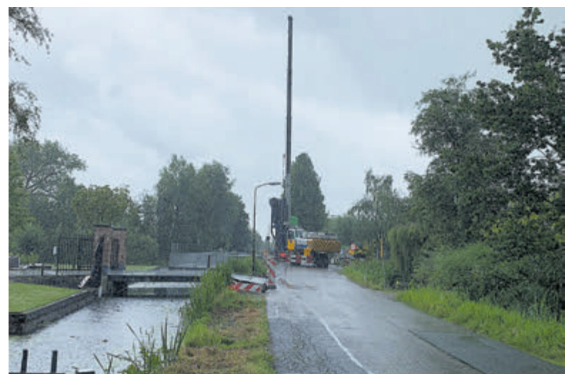
Het werk aan de nieuwe brug is in volle gang. Als dit begin september is afgerond, vindt er aansluitend groot onderhoud aan Demmerik plaats.

Voor de bouw van de woningen op het terrein van het partycentrum wordt een apart bestemmingsplan vastgesteld door de gemeenteraad. Het is het plan om die eind 2024 aan de raad ter vaststelling aan te bieden.