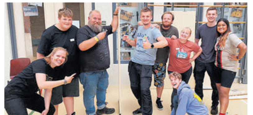
(Een deel van) het vrijwilligers team.

De inschrijving bedraagt € 8,- per dag, met de optie om uw kind de hele week in te schrijven voor € 35,- wat uitkomt op 12,5% korting! Je kunt je nog inschrijven tot en met zaterdag 24 augustus. Wilt u zich na deze tijd nog inschrijven? Neem dan telefonisch contact met ons op. Wijzigingen of aanvullingen op een eerdere inschrijving kunnen ALLEEN worden gedaan per email: info@speelmeeuithoorn.nl .