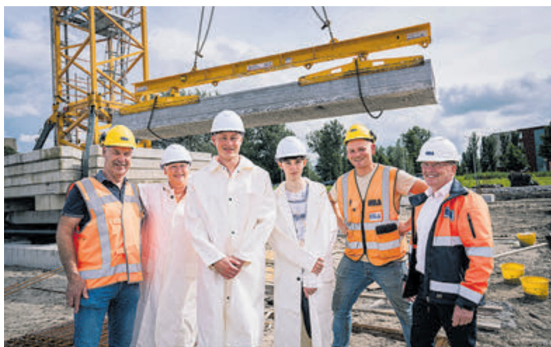
In Kootpark-Oost biedt de nieuwe ALDI straks ook woonruimte aan jongvolwassenen.