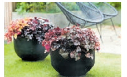
Purperklokje, een echte aandachtstrekker. Foto: mooiawatplantendoen.nl .

Zonder al te veel moeite kun je maximaal genieten van herfstbloei. Het belangrijkste is regelmatig de uitgebloeide bloemen weg te halen. De planten maken dan vanzelf nieuwe bloemen aan. Als je planten in potten zet, zorg dan altijd voor een gat in de bodem. Overtollig (giet)water kan dan eenvoudig wegvloeien en zo voorkomt dat de planten onverhoopt 'verdrinken'. Ga voor meer tips en ideeën naar www.mooiawatplantendoen.nl .