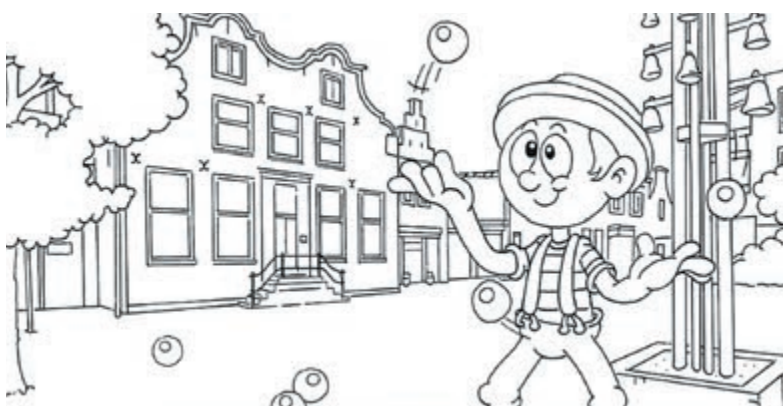
Een gedeelte van de kleurplaat.

Zondagmiddag 1 september in De Willisstee te Wilnis. Aanvang 16.15 uur. Een leuke kennisquiz ter gelegenheid van het veertigjarig bestaan van HV De Proosdijlanden. Geef je op met je vrienden, collega's familie of buurtgenoten. Laat zien wat je allemaal weet van diverse onderwerpen. Ding mee naar de ludieke prijzen. De pubquiz wordt die middag integraal live uitgezonden via RTV Ronde Venen. Inschrijving van teams (van 1 tot 5 personen) is mogelijk via het mailadres info@proosdijlanden.nl . Aanmelding is ook mogelijk op 1 september in De Willisstee zelf.