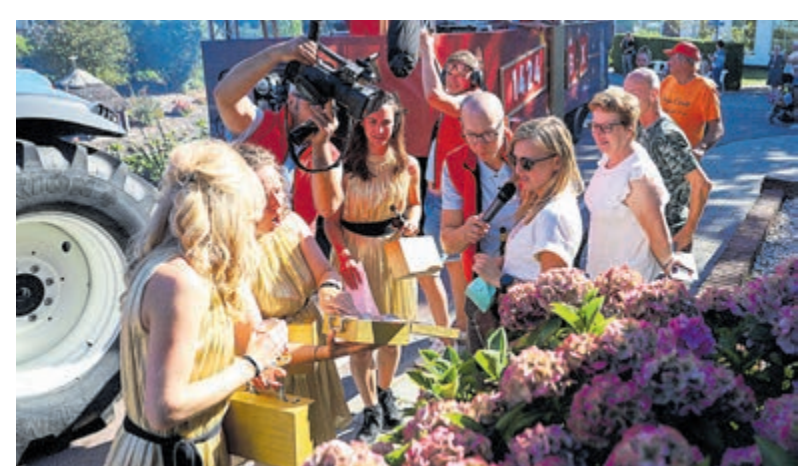
Alle foto's zijn aangeleverd.