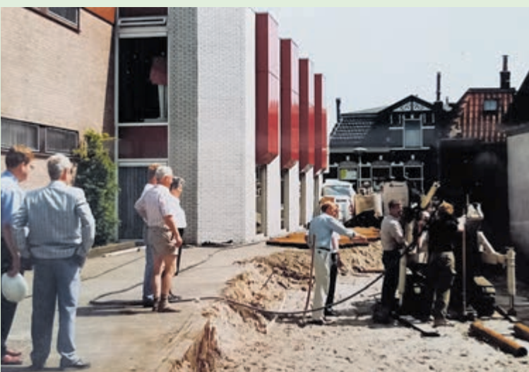
Het plaatsen van de eerste heipaal voor het nieuwe pand van Modehuis Van Yperen in de Dorpsstraat in Mijdrecht. Foto is aangeleverd.