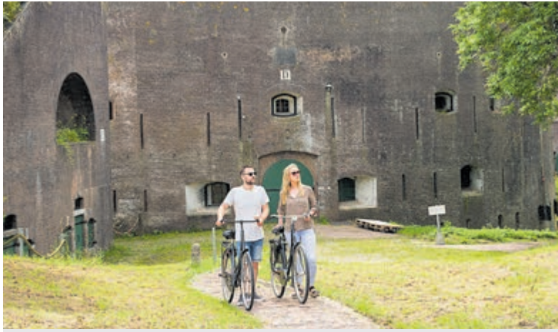
Alle foto's zijn aangeleverd.

FORTENFESTIVAL 2024: MEER DAN 210 ACTIVITEITEN IN HEEL NEDERLAND