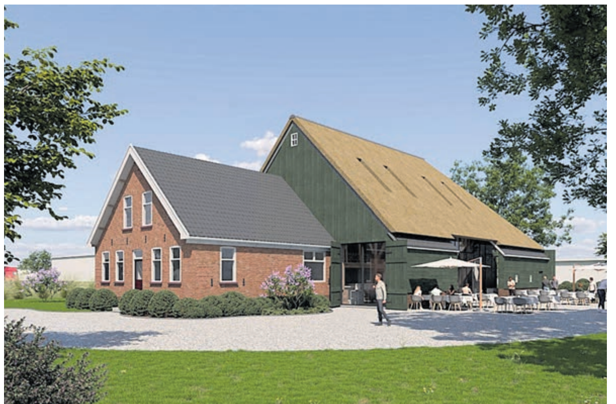
Tekening: Gemeente De Ronde Venen.

behouden zodat men het monument vanaf de straat goed kan blijven zien. De vroegere kavelsloten worden weer open gegraven en krijgen groene oevers. De intentie is dat achter de boerderij ruimte is voor nieuwe (bedrijfs)bebouwing. Deze bebouwing wordt ondergeschikt aan het monument. Dat wil zeggen dat de bebouwing kleinschalig zal zijn en met natuurlijke materialen wordt gebouwd. Over deze ontwikkelingsmogelijkheden moet de gemeenteraad nog een besluit nemen. De gemeente is blij dat er concrete plannen voor de boerderij zijn. Wethouder Cees van Uden: "Het is fijn dat nu gestart kan worden met de restauratie van de boerderij. Met de restauratie creëren we een mooie nieuwe plek langs de Industrieweg. Ook ontstaat met deze ontwikkeling meer ruimte om te ondernemen op bedrijventerrein Mijdrecht."