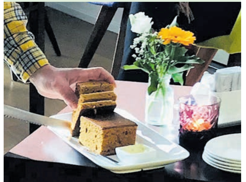
Tekst en foto's zijn geplaatst met volledige instemming van de betrokkenen.