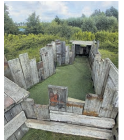
Alle foto's zijn aangeleverd.

In de zomer is Nirwana de hele week open, en na de zomervakantie vooral in de weekenden. Groepen tot 100 personen zijn van harte welkom. Als je iets te vieren hebt of een activiteit wilt organiseren kan je telefonisch contact opnemen en alles is bespreekbaar. Het is geen disco, dus harde muziek zal je er niet vinden. Maar voor verjaardagen, familiefeesten en zelfs bruiloften is de locatie uitermate geschikt. Gewoon een gezellige dag uit in eigen omgeving, mag je niet missen!