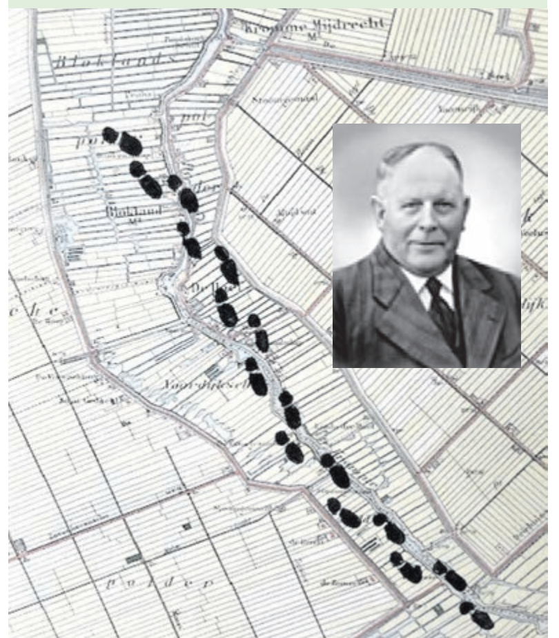
Foto en kaartje zijn aangeleverd.