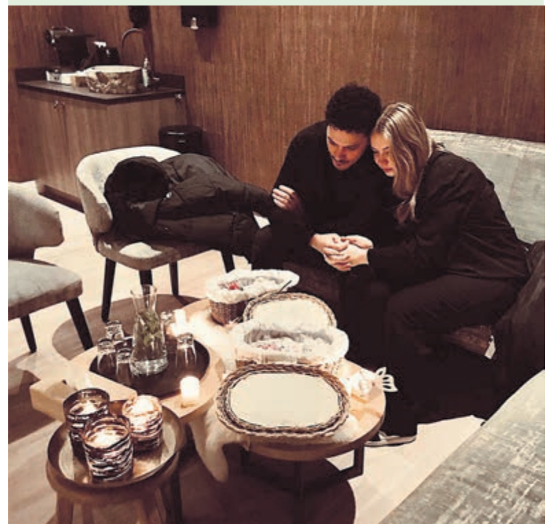
Tekst en foto's zijn geplaatst met volledige instemming van de betrokkenen.

Elk traptrede die ik daarna neem richting de ovenruimte voelt loodzwaar.