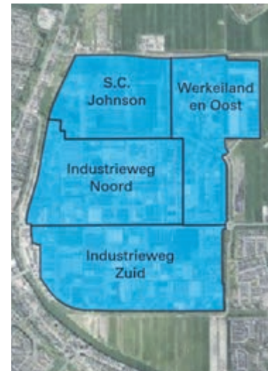
Links de Rondweg, Noord en Zuid gescheiden door Industrieweg. SC Johnson en Noord gescheiden door Constructieweg. SC Johnson en Oost gescheiden door de Veenweg (langs de vroegere Drukkerij Verweij).

De uitgifte en realisatie van het nieuwe bedrijventerrein is afhankelijk van meerdere factoren. De ontwikkeling van het bedrijventerrein 'De