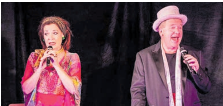
Annie M.G. Schmidt in De Willisstee.

wat zorgde voor veel gelach en plezier in de zaal. De warme en uitnodigende sfeer maakte het voor iedereen een geweldige ervaring. Tijdens de pauze konden de bezoekers genieten van een heerlijk kopje koffie en een smakelijk gebakje, wat het samenzijn nog gezelliger maakte. Dit was het perfecte moment om bij te kletsen en de leukste momenten van de voorstelling te delen.