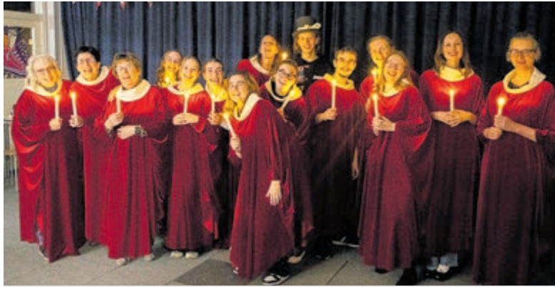
Scrooge voor Voedselbank De Ronde Venen. Foto is aangeleverd.

Onderdeel van Regio Media Groep B.V. www.regiomedialogroep.nl