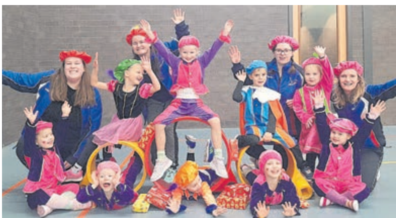
De Kangoeroes van Atlantis geslaagd voor Pietenexamen. Foto is aangeleverd.

De Kangoeroes is voor kinderen van 4 tot en met 6 jaar en trainen elke zaterdagochtend van 10.00 tot 11.00 uur. Een keertje gratis meetrainen? Stuur dan een e-mail naar aanmelden@kvatlantis.nl .