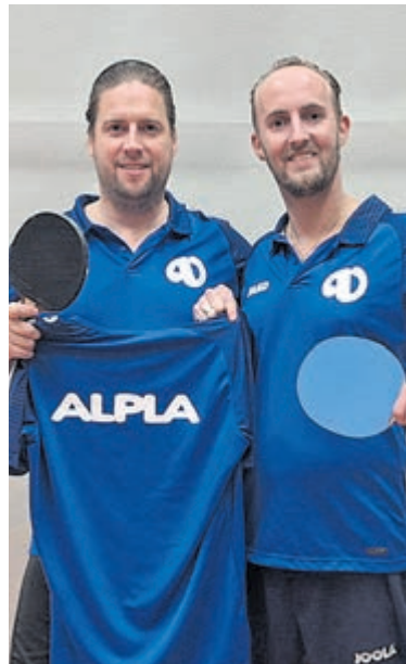
Aan het begin van het seizoen werd Veenland in een nieuw jasje gestoken door shirtsponsor Alpha Nederland uit Mijdrecht. Foto is aangeleverd.

Hiermee is de najaarscompetitie ten einde gekomen, maar eind december staat het dubbelkampioenschap van Veenland op het programma en begin januari het Ronde Venen toernooi samen met tafeltennisvereniging Vitac uit Vinkeveen.