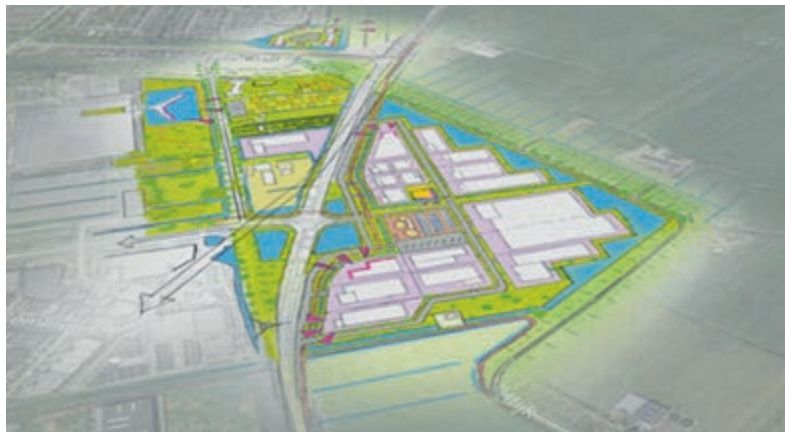
Industrieterrein De Bocht.