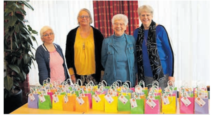
Vrijwilligers blij gemaakt met een klein presentje.

De dorpen Vinkeveen en Waverveen worden gecombineerd en komen in een later stadium aan bod. Dit omdat voor Vinkeveen eerst de hoofdstructuur voor het Centrumplan wordt ingetekend. Met het maken van de Uitvoeringsplannen voor Baambrugge, Amstelhoek en De Hoef werd eerder dit jaar al gestart.