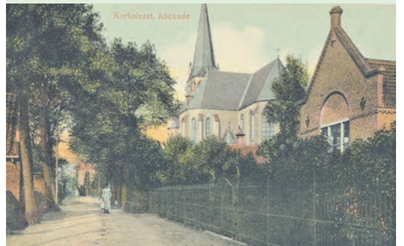
De Kerkstraat in Abcoude. Foto is aangeleverd.