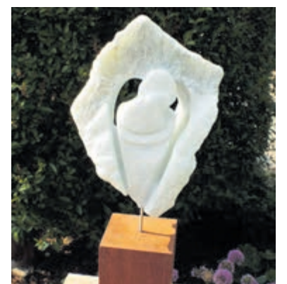
Gevarieerde expositie van Hedy Jagtman. Foto is aangeleverd.

Inge de Bree op trompet voor een bijzondere muzikale omljsting van het geheel. Net als voorgaande jaren: een prachtige avond om het echte kerstgevoel te beleven en je optimaal in de kerst sfeer onder te dompelen. Een brede glimlach en een brok in de keel gegarandeerd. Het kerstconcert begint om 20.00 uur en vanaf 19.30 uur is de deur open. De toegang is € 10,- per persoon (inclusief een kopje koffie/thee), kinderen tot en met 12 jaar mogen gratis naar binnen. Er zal geen voorverkoop plaats vinden, dus het is verstandig om op tijd te komen om eventuele teleurstelling te voorkomen.