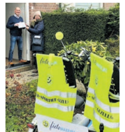
Fietsmaatje bedankt vrijwilligers. Foto is aangeleverd.

Fietsmaatjes De Ronde Venen heeft op dit moment vijf duofietsen. Helaas is één van de fietsen defect en wacht op reparatie. Hopelijk is deze in het voorjaar weer beschikbaar. Op dit moment is er voor elke fiets een mooie stallingsplek, maar binnenkort is een locatie in Mijdrecht niet meer beschikbaar. Dus daar is Fietsmaatjes naarstig naar op zoek. Neem contact op via info@fietsmaatjesdrv.nl.