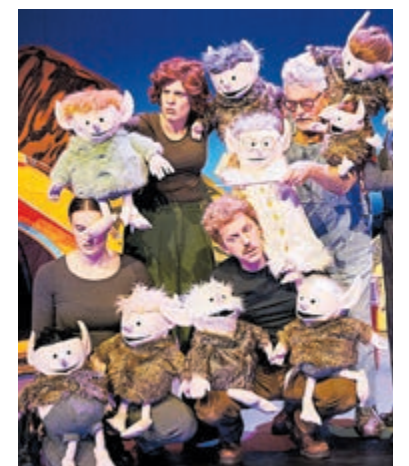
De Gorgels. Foto is aangeleverd.

Tijdens de kerstvakantie duikt Nederlands favoriete straatschoffie op voor een gloednieuw avontuur. Ditmaal in het wilde westen. Kruimeltje en de strijd om de Goudmijn is een spannende familiemusical, waarin Kruimeltje in het verleden van zijn vader duikt in Amerika. Te zien op zaterdag 4 januari. Meer informatie: www.schouwburgamstelveen.nl .