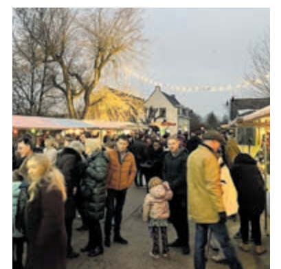
De kerstborrel van het Oranje Comité. Foto is aangeleverd.

Vinkeveen - Het Oranje Comité organiseert zaterdag 14 december van 17.00 tot 21.00 uur een sfeervolle kerstborrel op het terrein van De Adelaar, Herenweg 186, Vinkeveen, met heerlijke hapjes en drankjes, gezellige muziek en een warme sfeer. Maar er zijn ook knusse kerstkrampjes vol verrassingen, betoverende kerstliederen gezongen door het ROM-Koor uit Mijdrecht en een draaimolen speciaal voor kinderen. De avond staat in het teken van gezelligheid en samen zijn. Trek je warme jas aan, nodig vrienden en familie uit en vier de magie van de komende feestdagen.