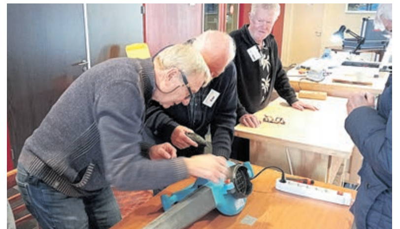
Kom maandag 16 december naar het Repair Café in Vinkeveen. Foto is aangeleverd.

vinden, is het bijzonder nuttig om direct hulp te kunnen bieden. Tijdens de EHBO-opleidingscursus leer je hoe je in elke situatie hulp kunt verlenen. Van geruststellen en wondverzorging tot het handelen bij kleine ongevallen, het waarschuwen van professionele hulpdiensten, het toepassen van de stabiele zijligging en reanimeren. De cursus biedt zowel theoretische scholing als praktische vaardigheden, waaronder observeren en communiceren. De opleiding wordt gegeven op dinsdagavonden, te beginnen op 28 januari. Het examen vindt plaats begin april. Het EHBO-diploma omvat ook (kinder)reanimatie en het gebruik van een AED. Voor meer informatie of om je aan te melden, kun je bellen naar 0297 - 564 192 of een e-mail sturen naar ehbolucas@casema.nl.