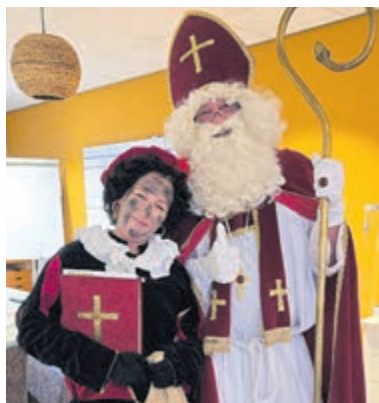
Sinterklaas in Zonnehuis Majella. Foto is aangeleverd.

Er werd natuurlijk uit volle borst 'Sinterklaasje kom maar binnen met je Piet' gezongen. Eenmaal binnen had Sinterklaas voor iedereen een persoonlijk gedicht met een speciaal uitgezocht cadeau. Ook werd iedereen persoonlijk aangesproken door de Sint en verwend door Piet met pepernoten en ander lekkers. Ook had de Goedheiligman een prachtig gedicht voor het zorgpersoneel gemaakt en hij sprak hen dan ook persoonlijk toe.