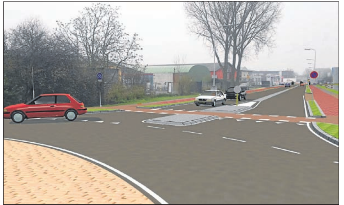
Indruk van nieuw ingerichte Amsterdamseweg met overrijdbare middengeleider (Ontwerpbureau RROG Amsterdam)

IVN Het IVN geeft met veel plezier kennis door over de natuur, juist over de natuur in de eigen omgeving. Er