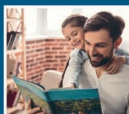
Opvoeding en gezin