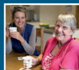
Zorgen voor een ander

Maar ook alle gegevens van organisaties die hulp, zorg en advies bieden in Uithoorn.