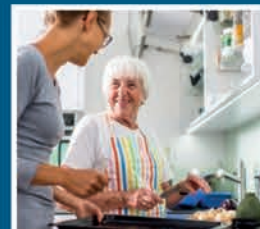
Wonen en huishouding