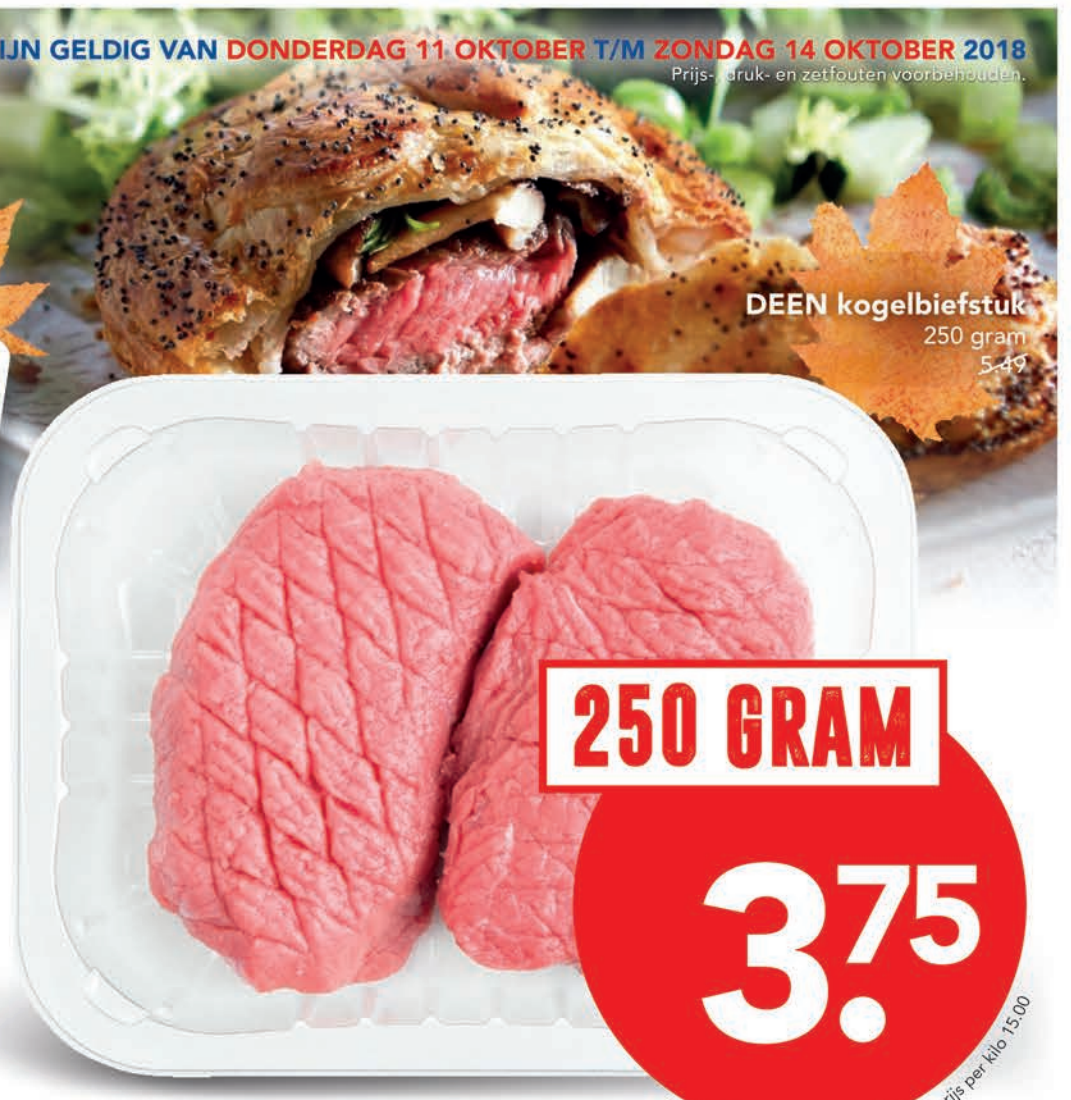
DEEN kogelbiefstuk 250 gram 5,49