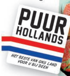
Aardbeien bak 500 gram