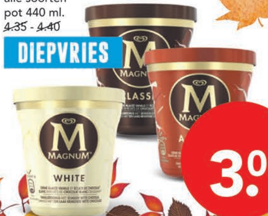
Magnum Pint alle soorten pot 440 ml. 4,35 - 4,40

DIEPVRIES 3.00 Actieprijs per liter 6,82