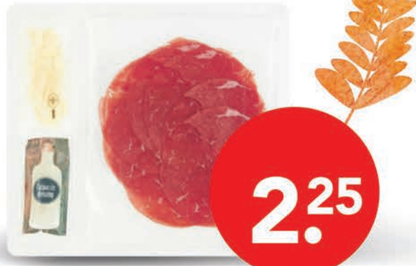
DEEN rundercarpaccio met dressing pak 2,80