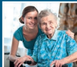
Zorg en ondersteuning

Op Uithoornhelpt.nl vindt u handige informatie over o.a.: