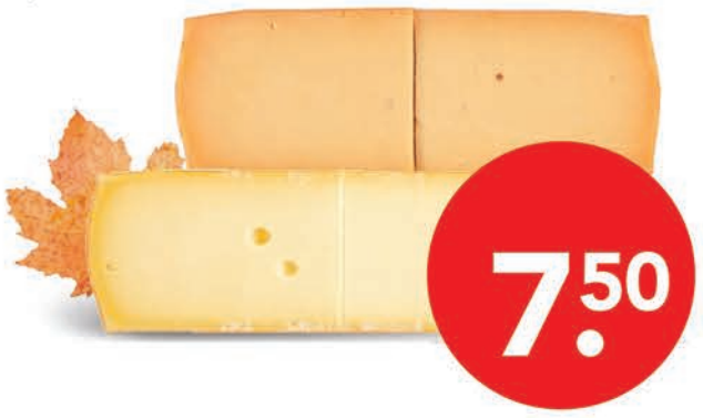
Duostukken kaas jong belegen 1,4 kilo of oud 1,25 kilo pak