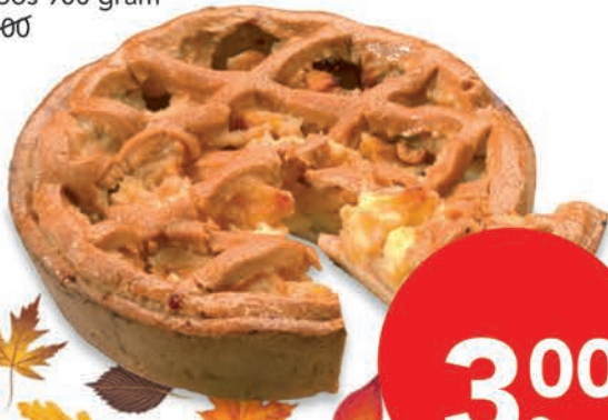
DEEN boerenappeltaart doos 900 gram 5,00