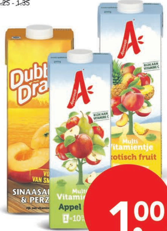
Appelsientje Dubbeldrink of Multivitamientje alle soorten pak 1 liter 1,25 - 1,35