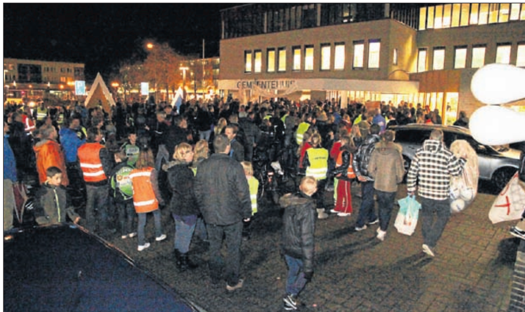
Rond zeven uur 's avonds stroomde het plein voor het gemeentehuis vol met betogers