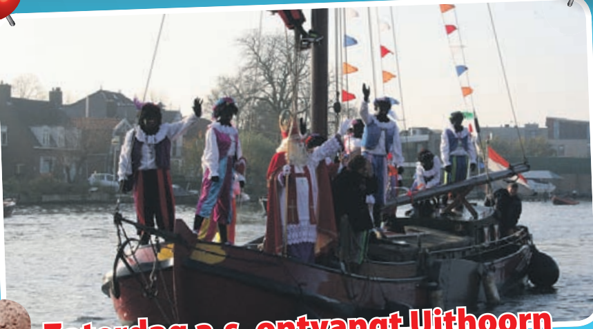
Zaterdag a.s. ontvangt Uithoorn Sinterklaas weer aan de Amstelkade

winkeliersvereniging UITHOORN AAN DE AMSTEL Da's winkelen op z'n best!