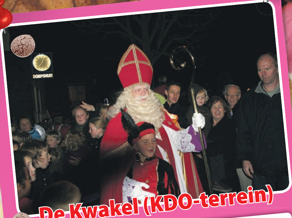
De Kwakel (KDO-terrein)

Rond 12.00 uur vertrekt sinterklaas weer en gaat hij op bezoek bij winkelcentrum Zijdelwaard, alwaar hij rond 13.30 uur zal aankomen. Ook hier zal de sint welkom worden geheten door de winkeliersvereniging en zal daarna alle tijd hebben voor de aanwezige kinderen. Er worden gratis ballonnen uitgedeeld en voor de wat oudere kinderen hebben de pieten een leuke attentie. Rond 14.30 uur vertrekt de Sint weer.