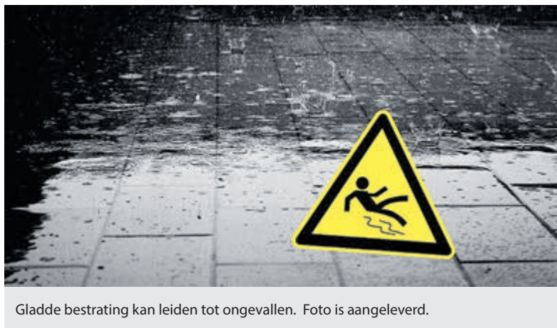
Gladder bestrating kan leiden tot ongevallen.