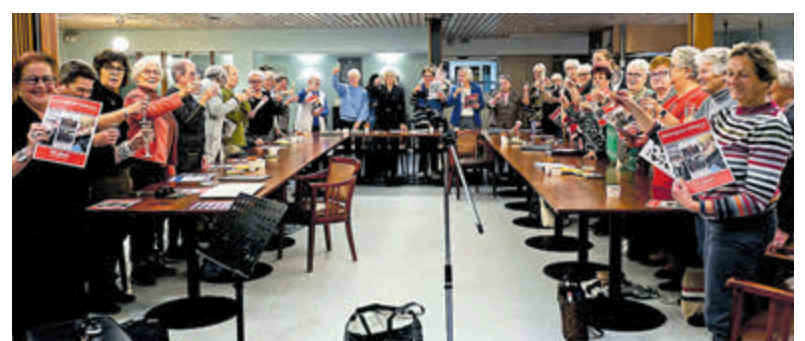
Feest met bubbels, een mooi jubileumtijdschrift en lekkere hapjes. Foto is aangeleverd.

Dorp van mijn Jeugdlid! Omdat de viering van het 5-jarig bestaan door corona in het water viel, was ervoor gekozen om deze tiende verjaardag uitgebreid te vieren. Dinsdag 14 januari was het feest met bubbels, een mooi jubileumtijdschrift en lekkere hapjes.