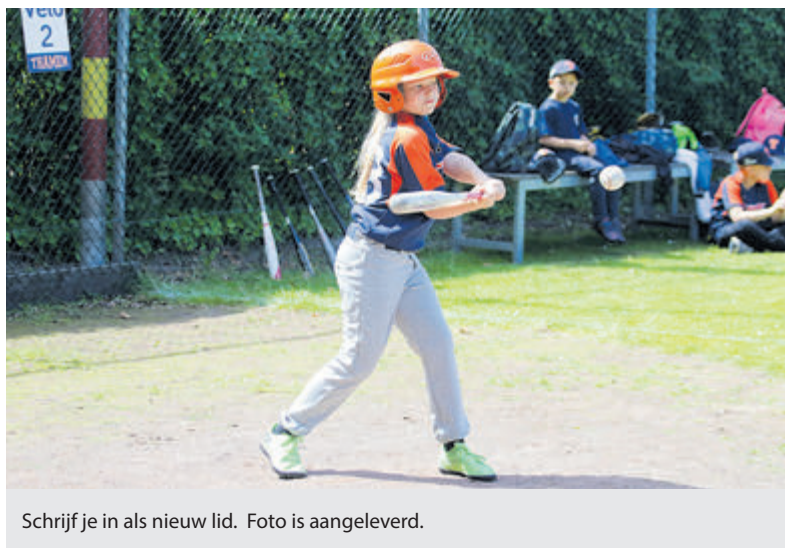
Schrijf je in als nieuw lid. Foto is aangeleverd.