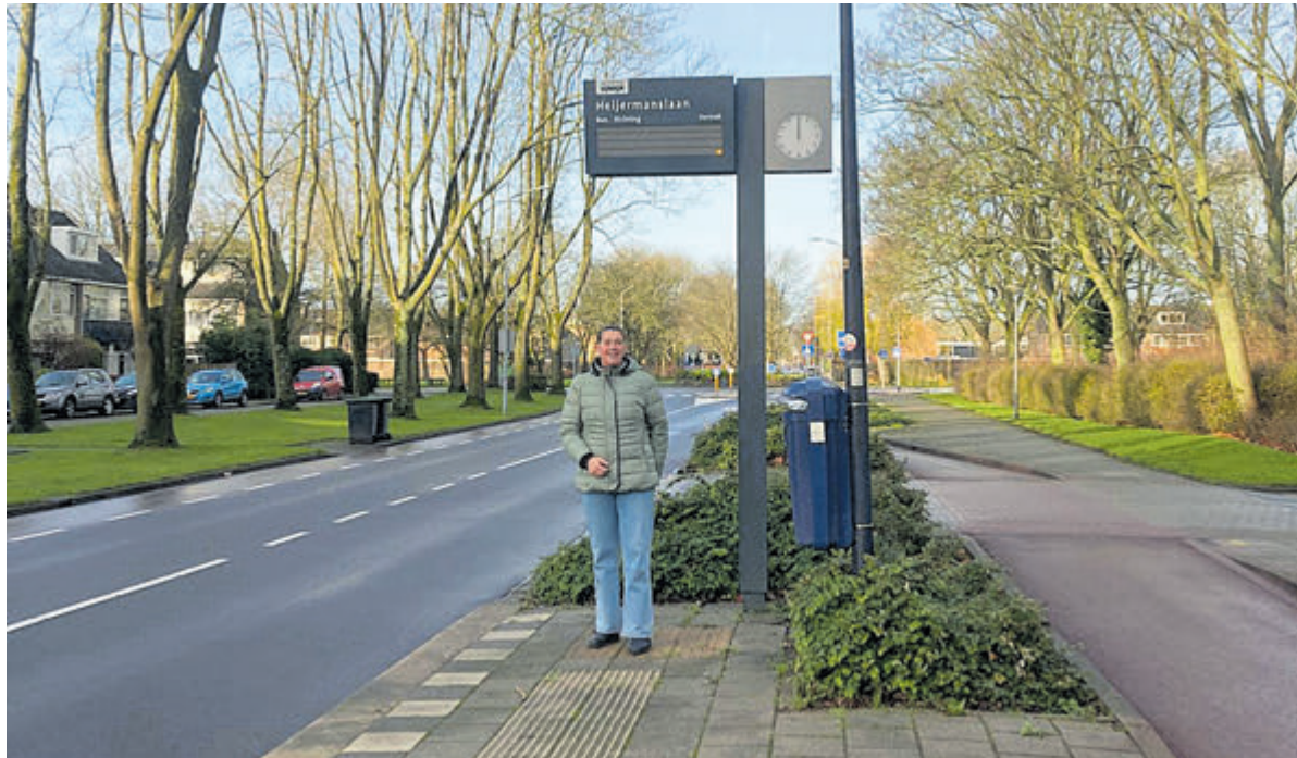
Gemeentebelangen blijft zich inzetten voor een fijnmazig en toegankelijk openbaar vervoer in Uithoorn. Foto aangeleverd.