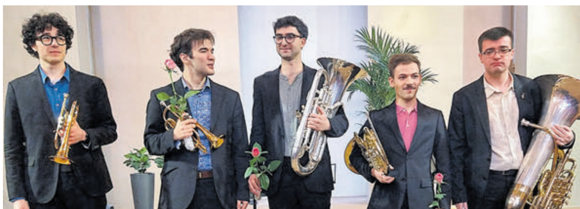
Vijf sublieme jonge koperblazers van het Conical Brass Ensemble. Foto is aangeleverd.

Op 16 februari geeft acteur Steyn de Leeuwe bij de SCAU zijn solovoortelling 'Tofu Cowboy', een tragikomisch verhaal rond zijn ervaringen als gedwongen stilzitter in coronatijd.