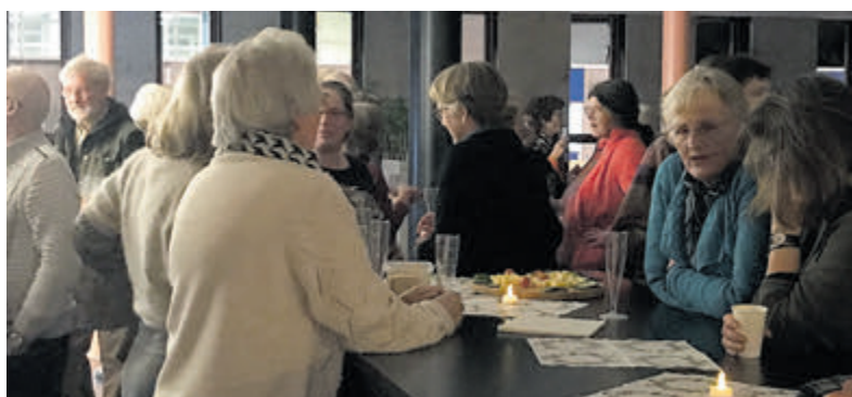
Een gezellige en drukbezochte nieuwjaarsborrel.