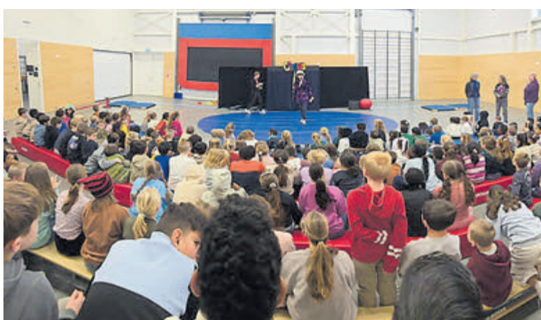
17 januari was het feest op IKC het Duet in Uithoorn. Foto is aangeleverd.

Benieuwd naar de winnende fotoserie? Deze staat in zijn geheel op de website van fotokringuithoorn.nl.