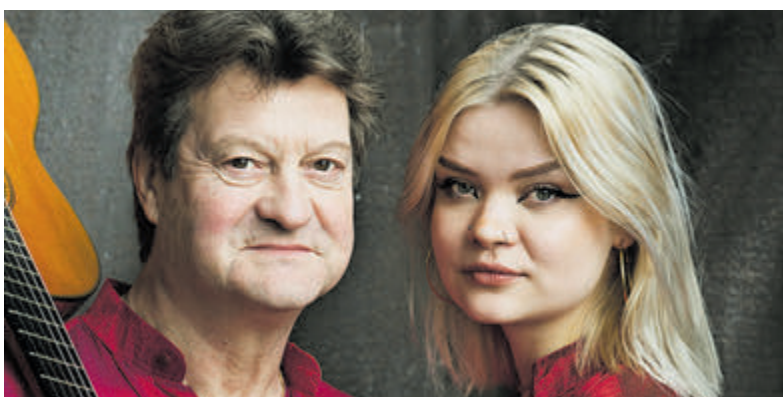
Optreden van vader en dochter.

brugge ook in de toekomst gevrijwaard zal blijven van windturbines. Maar ook vlak buiten gemeente De Ronde Venen willen onze inwoners geen windturbines. Stichtse Vecht verzet zich tegen de komst van windturbines op haar grondgebied en zal gebruik maken van alle mogelijkheden daartoe. Gemeente De Ronde Venen sluit zich daarbij aan.