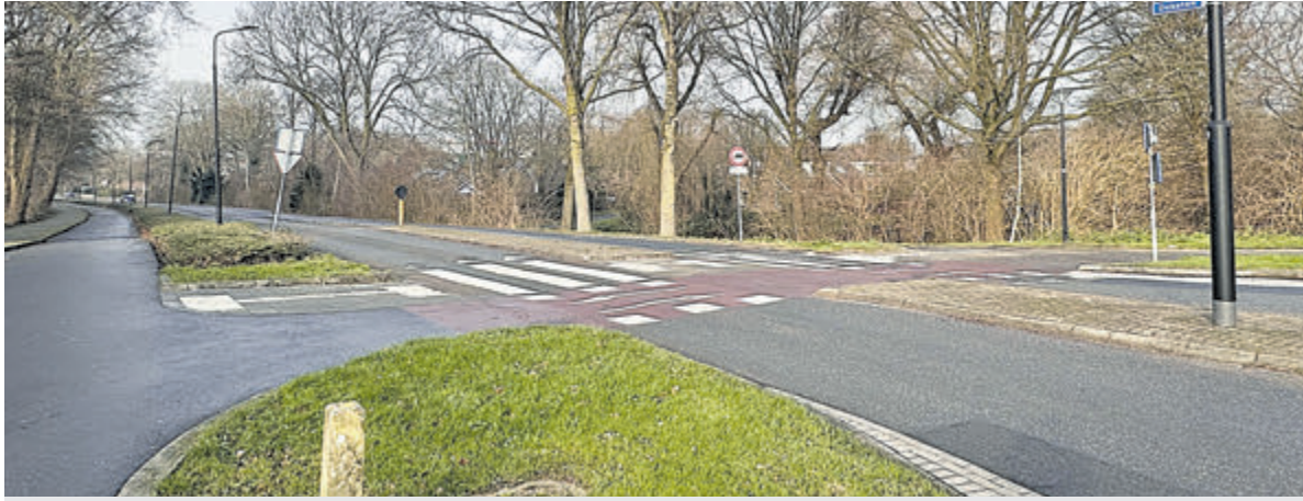
De Dukaton in Mijdrecht.