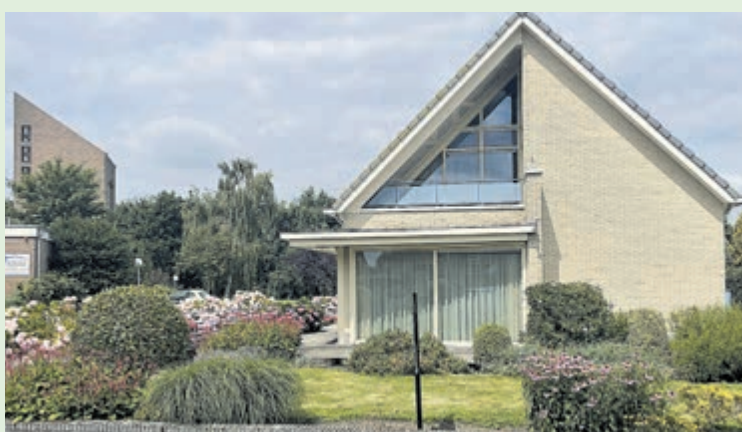
De Boterdijk in 2024.