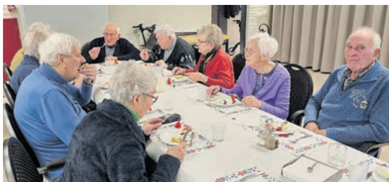
Eten met gasten in de buurtkamer. Foto is aangeleverd.