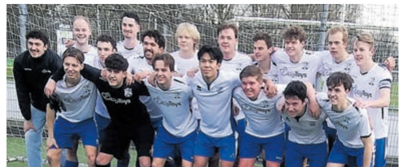
Het vriendenteam van Hertha 4. Foto is aangeleverd.