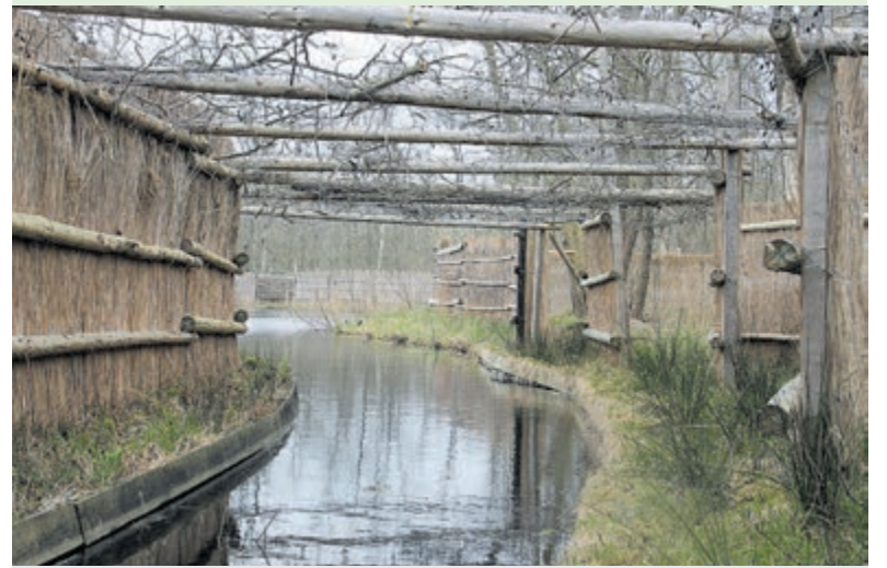
Eendenkooien hebben altijd iets mysterieus. Foto is aangeleverd.

In deze lezing geven gepassioneerde vrijwilligers van Natuurmonumenten inzicht in de eeuwenoude eendenjacht. Eenden bejagen was een beproefde methode voor onze voorouders om in hun levensonderhoud te voorzien. Ze ontwikkelden langzaam de eendenkooi als een vangtechniek die enkele eeuwen stand hield. Ontdek via hen het verborgen juweel van het Utrechtse landschap: de ruim 200 jaar oude eendenkooi Breukeleveen! Leer het authentieke kooikershuisje en het rijke kooibos kennen. Deze eendenkooi is gelegen in het polderlandschap tussen Tienhoven en Hollandsche Rading, een gebied met een rijke historie en een fascinerende schoonheid. Sijmonsma en Van Looveren vertellen over de geschiedenis, de eendenkooi en het landschap. Deelnemers aan de lezing kunnen aanvullend een excursie naar de eendenkooi volgen, de zaterdag na de lezing in de middag.