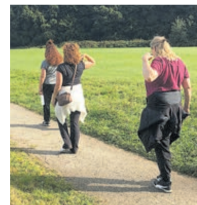
Beweegprogramma 'Aandacht voor Jezelf' voor mantelzorgers. Foto is aangeleverd.

Deelnemers moeten ongeveer vijf kwartier kunnen wandelen op soms hobbelige paden. Draag comfortabele kleding in laagjes en schoenen met een goed profiel. Begeleiding wordt verzorgd door een gecertificeerde leef- en bewegcoach. Deelname is gratis. Aanmelden voor deze bijeenkomst kan via www.mantelzorgenmeer.nl of via info@mantelzorgenmeer.nl .