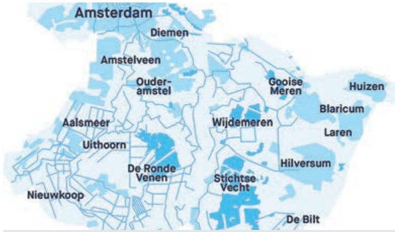
Subsidie voor groen en water weer beschikbaar in het beheergebied Amstel, Gooi en Vecht. Foto is aangeleverd.