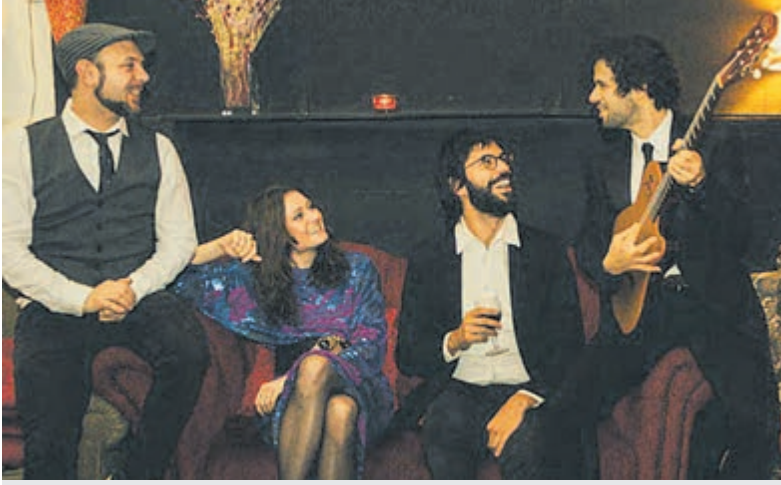
Lunchconcert met FADOpelos2 bij Buitenplaats Kameryck. Foto is aangeleverd.