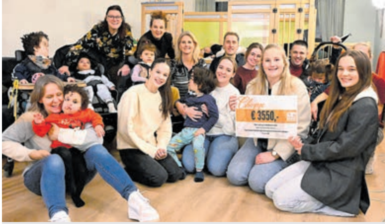
Vanwege de privacy zijn de gezichtjes van enkele kindjes onherkenbaar gemaakt.