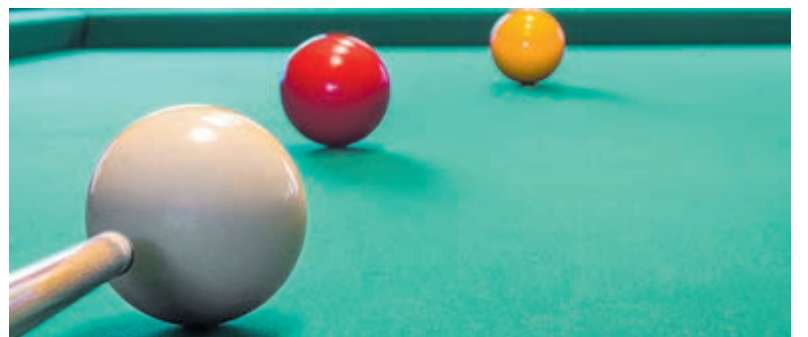
De tweede helft van de biljartcompetitie is gestart. Foto is aangeleverd.

We verzamelen om 09.00 uur bij de spoordijk aan de Demmerikse kade, Vinkeveen. Meer informatie: zie website. We vinden het fijn als je je aanmeld om te weten hoeveel mensen er komen.