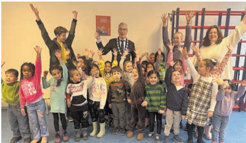
De burgemeester wordt enthousiast ontvangen op basisschool 't Startnest.

Al met al is er zicht op een betere en vooral mooiere toekomst voor de inwoners van de omgeving van de Prinses Christinalaan en kunnen er straks weer een aantal woningzoekenden blij gemaakt worden met een nieuwbouwwoning. Kunnen we straks weer met een fijn gevoel door een mooie straat in Uithoorn lopen en rijden.