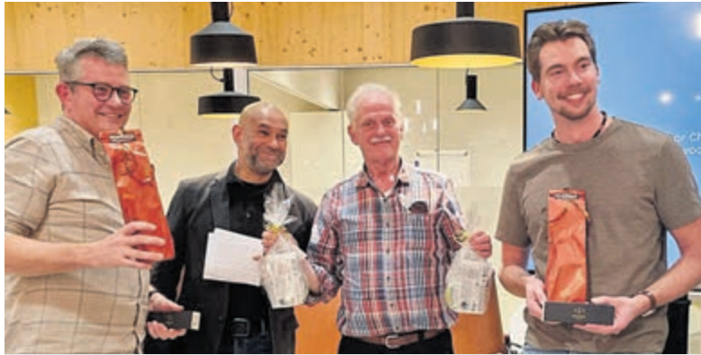
Een gegraveerde pen, gedoneerd door kantoorboekhandel Van Hilten, een fles wijn gesponsord door De Wijnschuur en een leuk cadeaupakketje. Foto is aangeleverd.

Onderdeel van Regio Media Groep B.V. www.regiomediagroep.nl