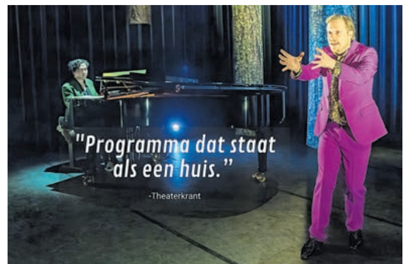
Met 'Uit de klauwen' heeft Nederkoorn een voorstelling gemaakt die staat als een huis. Foto is aangeleverd.

echt en brengt dus ook gevaar en angsten. Langzaam komt bij de voormalige stadsbewoner ook het besef dat hij niet boven die natuur staat, maar er onderdeel van moet worden. Met 'Uit de klauwen' heeft Nederkoorn een voorstelling gemaakt die staat als een huis. Hij vertelt niet 'zomaar' een verhaal. Bij Nederkoorn zit onder de oppervlakte altijd een diepere laag. De wolf dringt zijn habitat binnen, de ratio die hij als stadsbewoner had over het samenleven met het dier maakt plaats voor emoties en zorgen. Hij gaat naar een dierentuin om het dier beter te leren kennen en zijn angsten ervoor te overwinnen. Vul voor wolf 'asielzoeker' of 'immigrant' in en maak van dierentuin 'asielzoekerscentrum' en daar heb je zowaar die diepere en actuele betekenis van het verhaal.