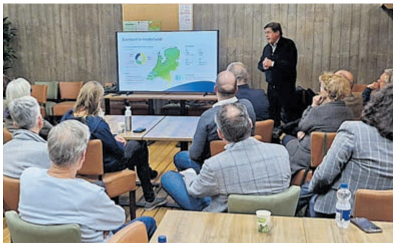
De gemeenteraad bracht een bezoek aan Vireo in De Kwakel. Foto is aangeleverd.