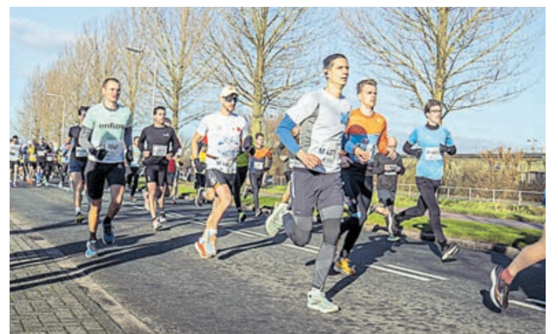
Veel enthousiaste lopers.

De langste afstand, de 10 Engelse mijlen, ging zelfs langs de schilderachtige Amstel. Voor de jongste deelnemers was er de 1 km Gezzinsloop, speciaal voor kinderen tot en met 11 jaar. Het evenement was een groot succes dankzij de inzet van vele vrijwilligers en de steun van sponsors. Elke deelnemer ontving een leuk aandenken en er waren prijzen voor de snelste lopers.