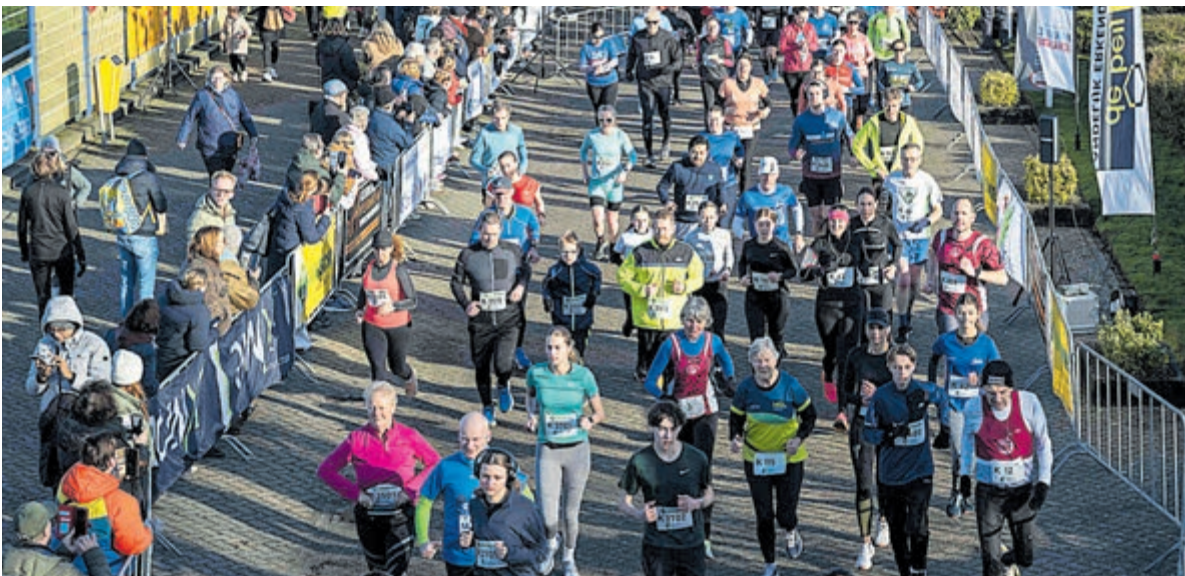
De start van Uithoorns Mooiste - De Loop. Foto is aangeleverd.

Hoofdsponsor Zorg en Zekerheid was niet alleen tevreden over het feit dat zoveel lopers op deze manier gestimuleerd worden om op een gezonde manier te bewegen maar ook over de uitstekende organisatie door atletiekvereniging AKU. De vereniging mag er trots op zijn dat meer dan 125 vrijwilligers klaar stonden om dit evenement tot een succes te maken.