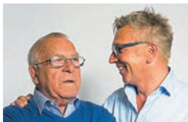
Project 'Samen is beter dan alleen' van start. Foto is aangeleverd.

Met dit programma wil KBO-NH mensen bewust maken dat zorg in het vooruitzicht kan liggen; dat de persoonlijke cirkel van groot belang is voor de zelfredzaamheid en de mogelijkheid om langer thuis te blijven wonen; en dat zaken rondom de laatste levensfase besproken, vastgelegd en gedeeld kunnen/ moeten worden met familie en huisarts. De Social Scan omvat informatie en concrete hulpmiddelen voor