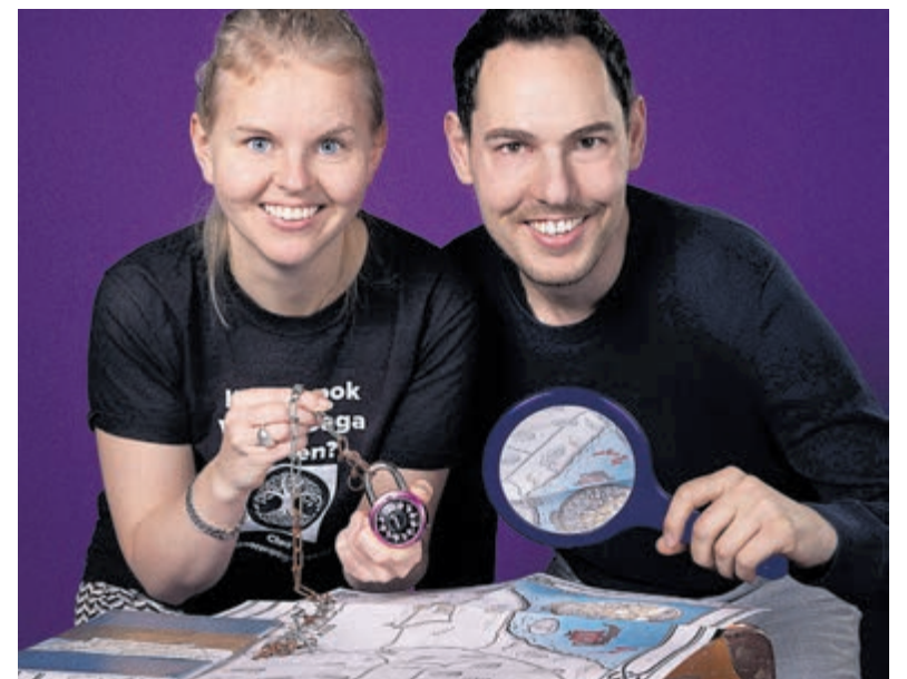
WaouW Outdoor Escape Games is genomineerd voor de Ondernemingsverkiezing Noord-Holland in de categorie De Belofte. Foto is aangeleverd.

top 30 van de provinciale verkiezing. Gewaardeerd werd dat deze jonge ondernemers met hun games mensen samenbrengen, hen spelenderwijs over de omgeving en geschiedenis leert en laat genieten van de prachtige omgeving. Hun visie is ook duidelijk: van de telefoon af, met elkaar op pad en echt even tijd samen doorbrengen. Zeer belangrijk, zeker in deze tijd. Binnenkort brengt een jury een bedrijfsbezoek om te bepalen of het bedrijf doorgaat naar de top 10 en uiteindelijk naar de finale.