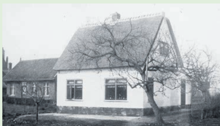
De Boterdijk in 1948.