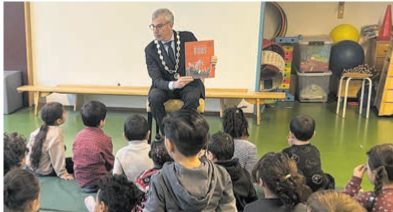
Kinderen van De Vuurvogel luisteren aandachtig naar de burgemeester.

meer voordelen voor hun taalontwikkeling. Daar is al veel onderzoek naar gedaan. Bovendien is het een prach-