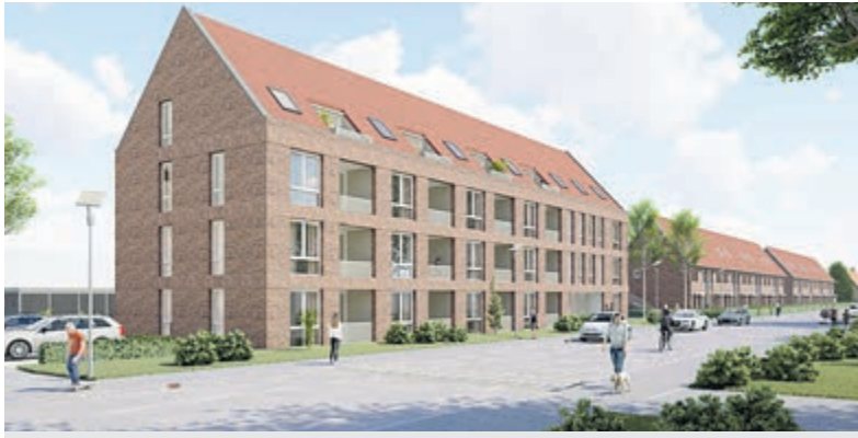
Toekomstperspectief. Foto is aangeleverd.