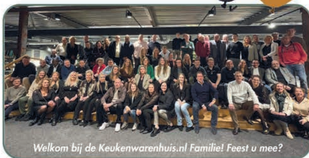
Welkom bij de Keukenwarenhuis.nl Familie! Feest u mee?

Met trots nodigen wij u graag uit om deze week op ons jubileumfeest te komen. Profiteer nu van onze jubileum acties, in de grootste keukenshowrooms van Nederland, met de allernieuwste keukenmodellen met keukens voor ieder budget in alle kleuren. Nu ook zelfs duizend luxe keukens welke binnen 7 dagen leverbaar zijn!