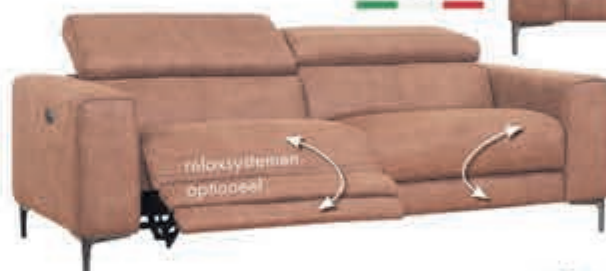
2.5/2 zits Sahara Stijlvolle bank met diverse relaxmogelijkheden. In stofcategorie 1. Ook in andere bekledingen en kleuren leverbaar. Uit onze Mancini topcollectie.

normaal 199,- nu 164,46 MET 21% BTW KORTING