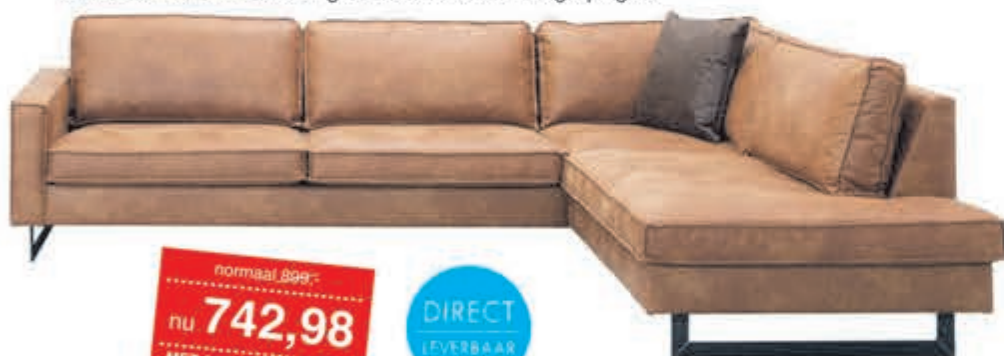
Woonlandschap Mexico Hoekbank in stof Supreme. Leverbaar in diverse bekledingen en kleuren. Kan ook gespiegeld.

normaal 899,- nu 742,98 MET 21% BTW KORTING