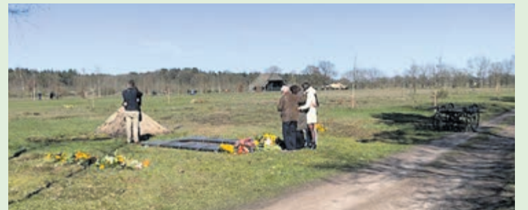
Tekst en foto's zijn geplaatst met volledige instemming van de betrokkenen.