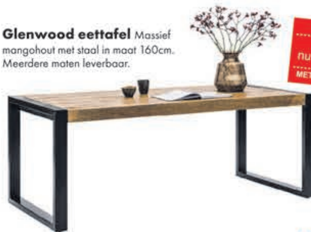
Glenwood eettafel Massief mangohout met staal in maat 160cm. Meerdere maten leverbaar.

normaal 599,- nu 495,04 MET 21% BTW KORTING