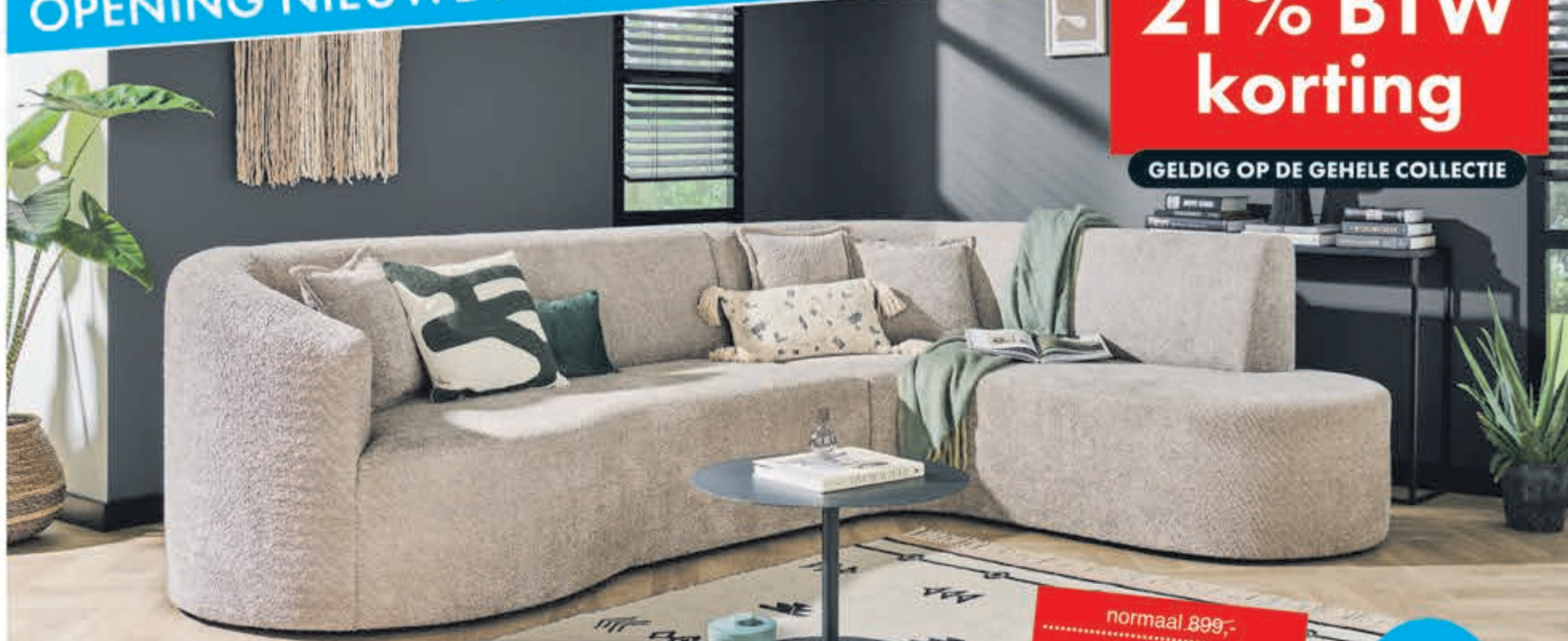
Woonlandschap Salvador Hoekcombinatie met mooie organische vormen. Leverbaar in diverse bekledingen en kleuren. Kan ook gespiegeld. In stof Supreme:

normaal 899,- nu 742,98 MET 21% BTW KORTING