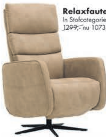
Relaxfauteuil Pedro In Stofcategorie 1, elektrisch 2 motoren 1299,- nu 1073,55. Manueel:

normaal 799,- nu 660,33 MET 21% BTW KORTING