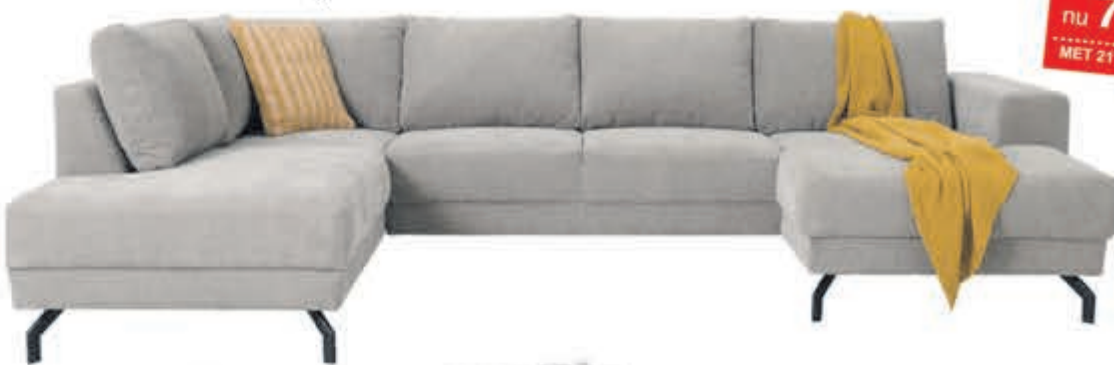
Hoekbank Capri In stof Supreme. Als Terminal-1+Hoek+2+Longchair: normaal 1249,- nu 1032,23. Leverbaar in diverse bekledingen en kleuren. Als Terminal-1+Hoek+2:

normaal 849,- nu 701,65 MET 21% BTW KORTING