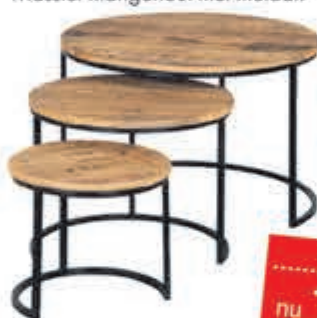
Shelby salontafelset Set van 3 tafels. Massief mangohout met metaal.