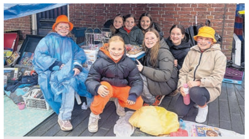
Alle foto's zijn aangeleverd.