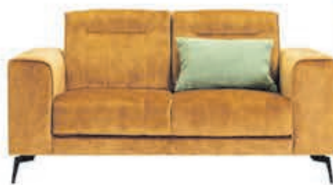
2½+2 zits Matera Trendy bankstel in stof Supreme. Diverse bekledingen en kleuren mogelijk.

normaal 599,- nu 495,04 MET 21% BTW KORTING