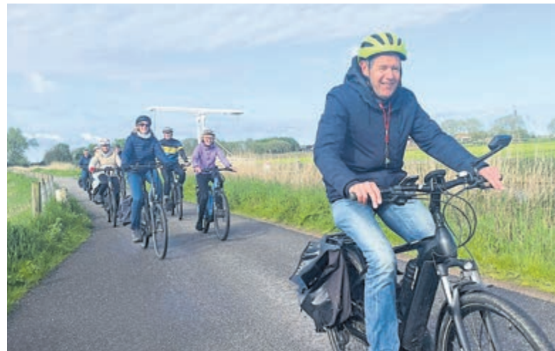
Onderweg met de nieuwe E-bike groep.