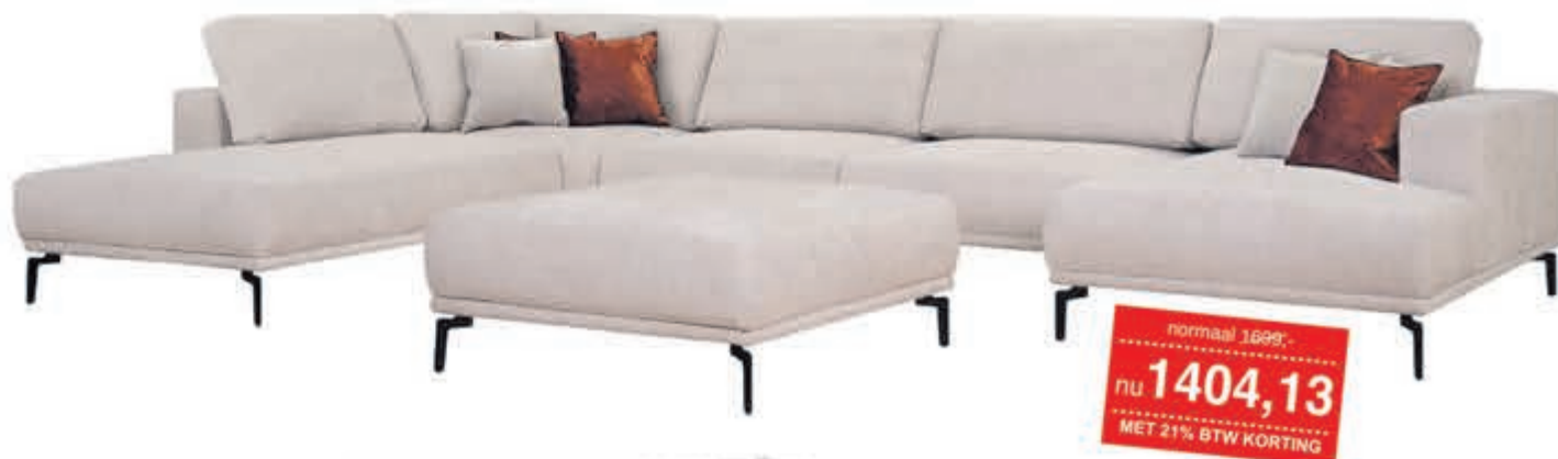
Hoekbank Riviera In stof Supreme. Leverbaar in diverse bekledingen en kleuren. Als Terminal-1+Hoek+2½+Longchair: normaal 2399,- nu 1982,64. Als Terminal-1+Hoek+2½:

normaal 1899,- nu 1404,13 MET 21% BTW KORTING