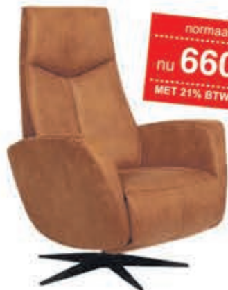
Relaxfauteuil Reno Heerlijke design relaxfauteuil. Manueel in Cat. 1 Leder.

normaal 799,- nu 660,33 MET 21% BTW KORTING