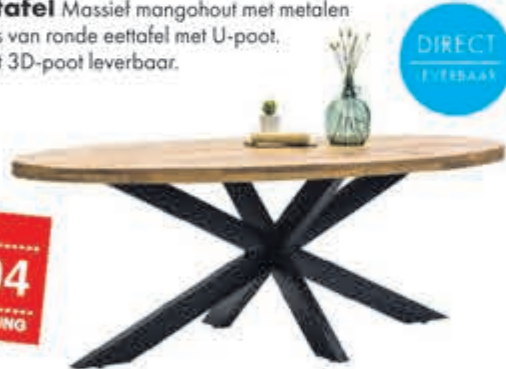
Melbourne eettafel Massief mangohout met metalen onderstel. Prijs op basis van ronde eettafel met U-poot. Ook als ovale tafel met 3D-poot leverbaar.

normaal 599,- nu 495,04 MET 21% BTW KORTING