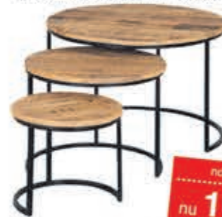
Shelby salontafelset Set van 3 tafels. Massief mangohout met metaal.

normaal 199,- nu 164,46 MET 21% BTW KORTING