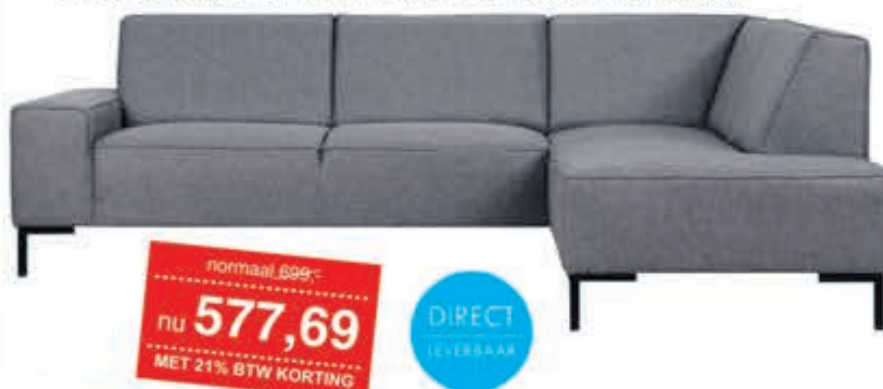
Woonlandschap Mondial Moderne hoekbank in Stofcategorie 1. Diverse bekledingen en kleuren leverbaar. Ook gespiegeld mogelijk.

normaal 699,- nu 577,69 MET 21% BTW KORTING