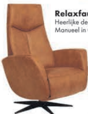
Relaxfauteuil Reno Heerlijke design relaxfauteuil. Manueel in Cat. 1 Leder: