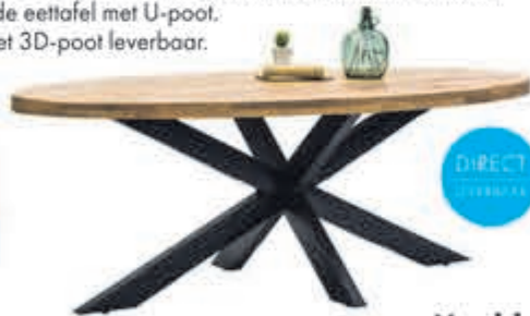
Melbourne eettafel Massief mangohout met metalen onderstel. Prijs op basis van ronde eettafel met U-poot. Ook als ovale tafel met 3D-poot leverbaar.