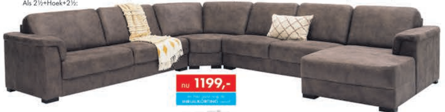
Hoekbank Lucca In Stofcategorie 1. Leverbaar in diverse bekledingen en kleuren. Als 2½+Hoek+2½+Longchair: nu 1599,-. Als 2½+Hoek+2½: