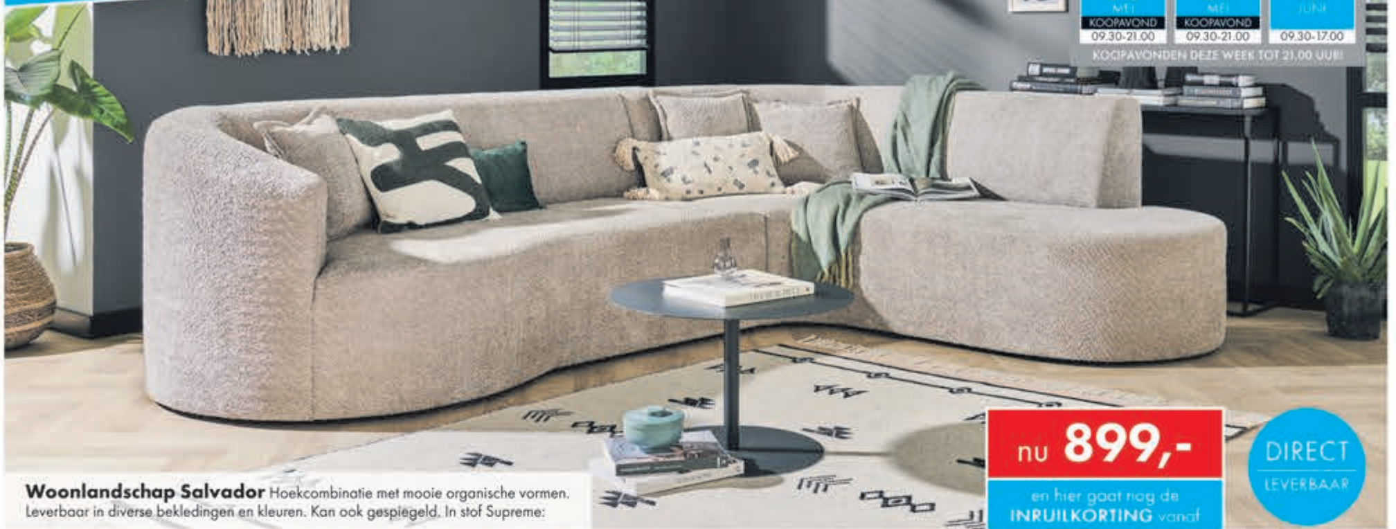
Woonlandschap Salvador Hoekcombinatie met mooie organische vormen. Leverbaar in diverse bekledingen en kleuren. Kan ook gespiegeld. In stof Supreme: