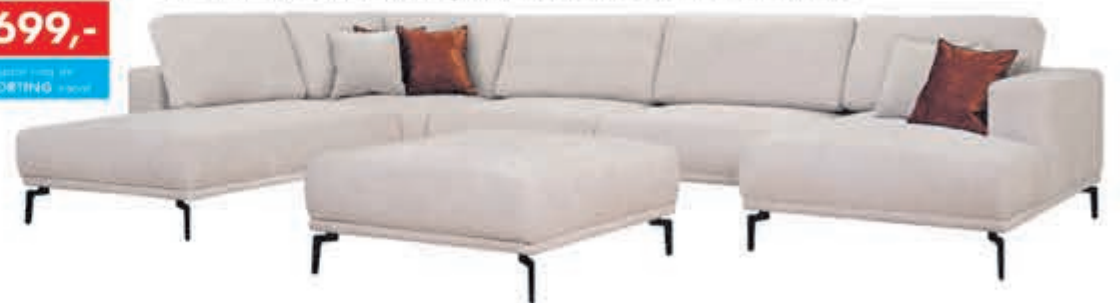
Hoekbank Riviera In stof Supreme. Leverbaar in diverse bekledingen en kleuren. Als Terminal-1+Hoek+2½+Longchair: nu 2399,-. Als Terminal-1+Hoek+2½: