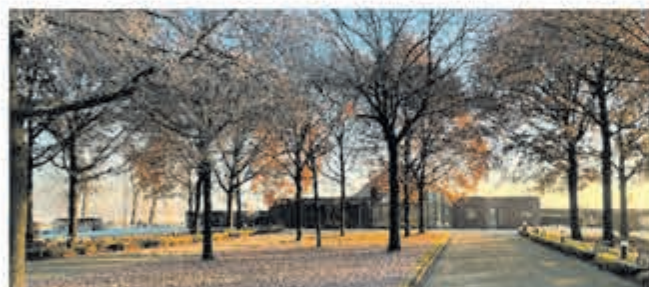
Uitvaartcentrum De Ronde Venen Ringdijk 4 - 3648 EB Wilnis