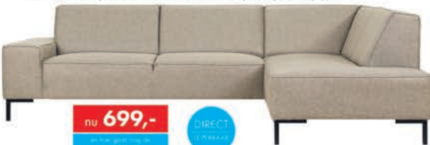
Woonlandschap Mondial Moderne hoekbank in Stofcategorie 1. Diverse bekledingen en kleuren leverbaar. Ook gespiegeld mogelijk.