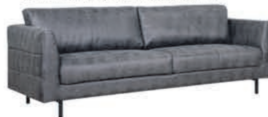
3+2 zits Buffalo Industrieel bankstel met patroonstiksel op de zijkant. Leverbaar in diverse bekledingen en kleuren. In Stofcategorie 1: