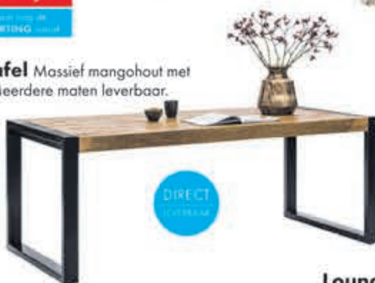
Glenwood eettafel Massief mangohout met staal in maat 160cm. Meerdere maten leverbaar.