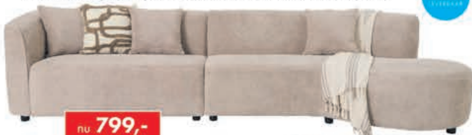
Loungebank Cliff Moderne loungebank met ronde longchair. Leverbaar in diverse bekledingen. In afgebeelde bouclé-stof snel leverbaar. In stof Supreme: