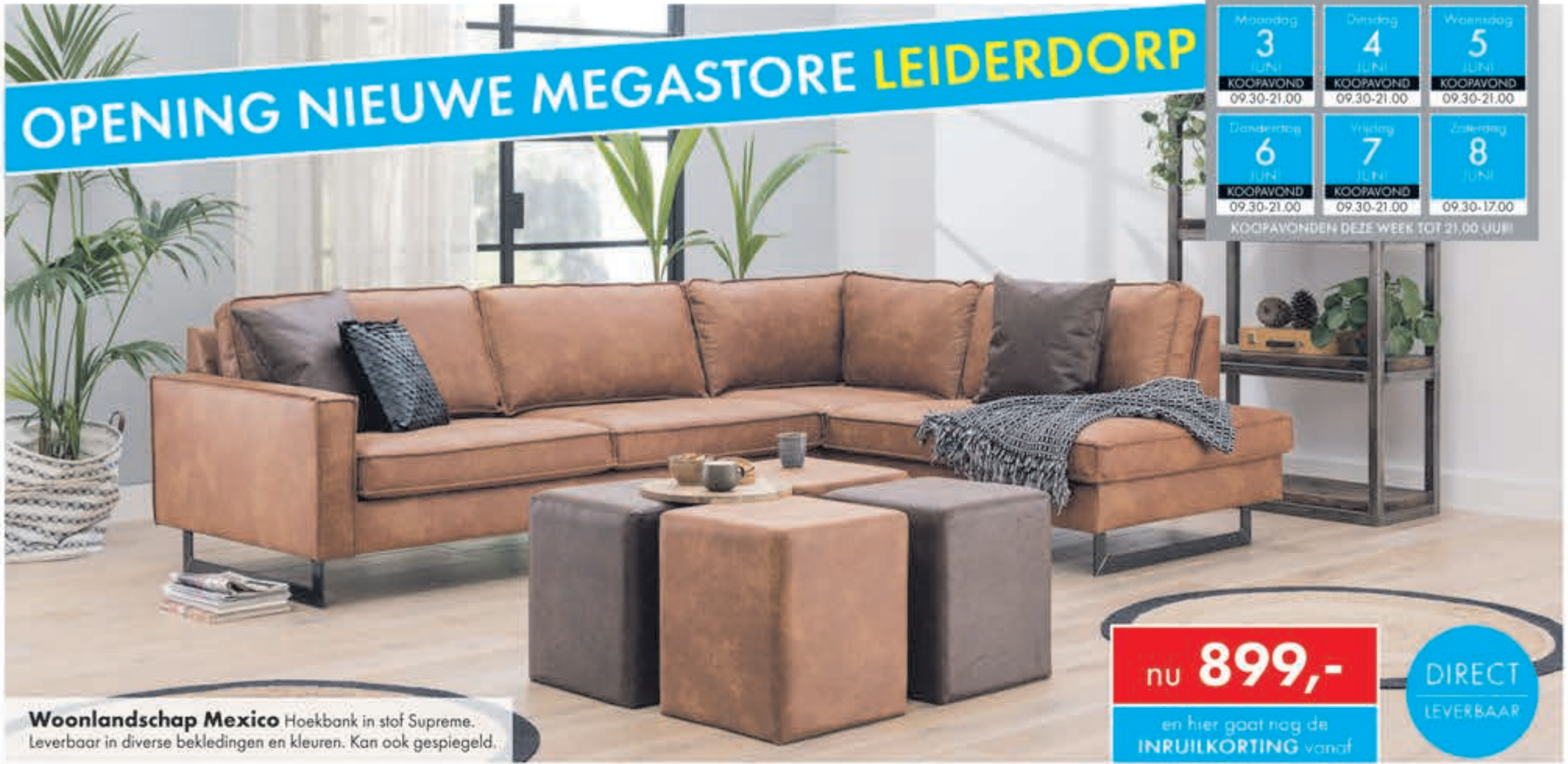
Woonlandschap Mexico Hoekbank in stof Supreme. Leverbaar in diverse bekledingen en kleuren. Kan ook gespiegeld.