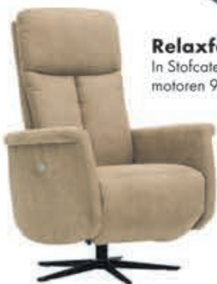
Relaxfauteuil Ascari In Stofcategorie 1, elektrisch 2 motoren 999,-. Manueel: