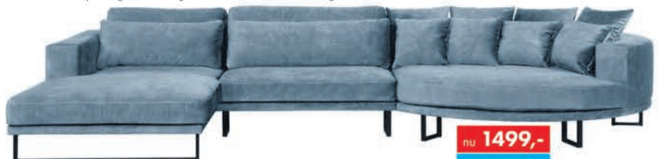
Loungebank Provence In stof Supreme. Moderne loungebank met slanke poot. Als Longchair+1½ XL+Eiland rond: nu 1999,-. In vele opstellingen, bekledingen en kleuren leverbaar. Als Longchair+Eiland rond: