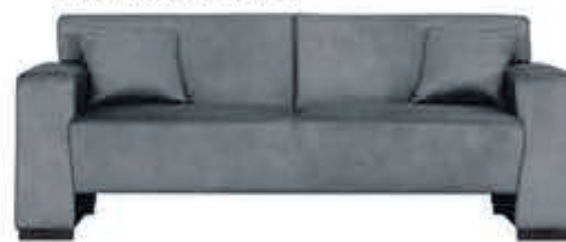
3+2 zits Toledo Bankstel in stof Supreme incl. sierkussens. Leverbaar in diverse bekledingen en kleuren.