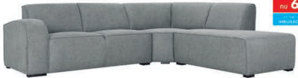
Woonlandschap Firenze In stof Supreme. Als 2½+Hoek+1-Terminal: nu 999,-. Leverbaar in diverse bekledingen, kleuren en opstellingen. Als 2½+Longchair: