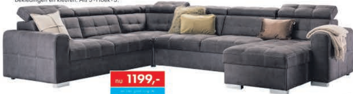
Hoekbank Island In stof Supreme. Als 3+Hoek+3+Longchair: nu 1699,-. Leverbaar in diverse bekledingen en kleuren. Als 3+Hoek+3:

nu 1199,- en hier gaat nog de INRUILKORTING vanaf