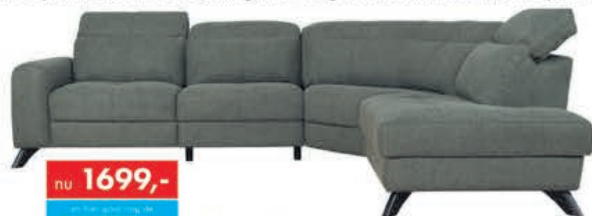
Hoekbank Santiago Moderne hoekbank met hoofdsteunen en optioneel elektrisch relaxsysteem. In verschillende opstellingen, bekledingen en kleuren leverbaar. In stof Supreme:

nu 1699,- en hier gaat nog de INRUILKORTING vanaf