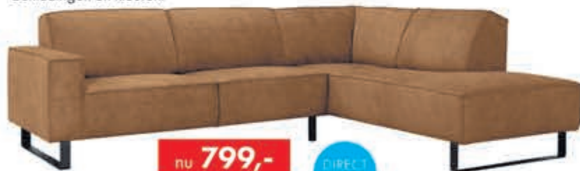
Woonlandschap Amante In stof Supreme. Ook leverbaar in andere bekledingen en kleuren.

nu 799,- en hier gaat nog de INRUILKORTING vanaf