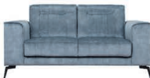
2½+2 zits Matera Trendy bankstel in stof Supreme. Diverse bekledingen en kleuren mogelijk.