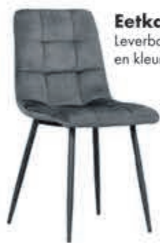
Eetkamerstoel Trentino Leverbaar in diverse bekledingen en kleuren. In stof Supreme:

DIRECT LIVABLE nu 69,- en hier gaat nog de INRUILKORTING vanaf