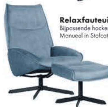
Relaxfauteuil Malaga Bijpassende hocker mogelijk. Manueel in Stofcategorie 1:

nu 599,- en hier gaat nog de INRUILKORTING vanaf