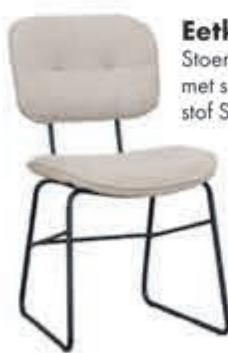
Eetkamerstoel Pacific Stoere industriële eetkamerstoel met slank metalen onderstel in stof Supreme.

DIRECT LIVABLE nu 129,- en hier gaat nog de INRUILKORTING vanaf