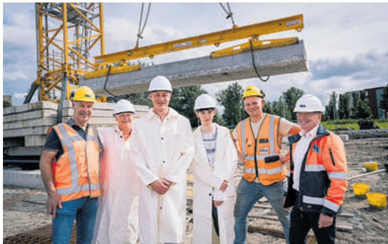
In Kootpark-Oost biedt de nieuwe ALDI straks ook woonruimte aan jongvolwassenen.