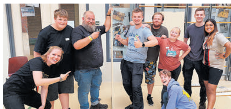
(Een deel van) het vrijwilligers team.