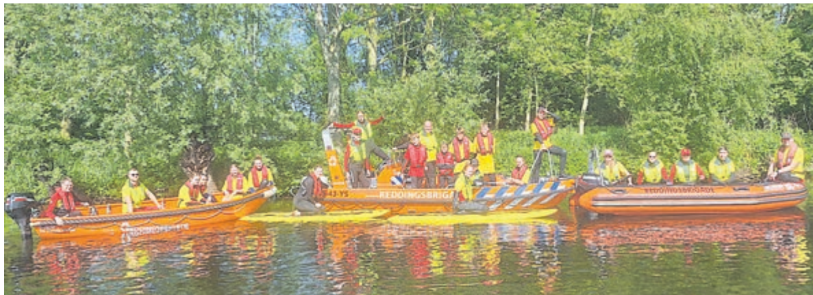
Reddingsbrigade De Ronde Venen tijdens de Lifeguard-opleiding in Vinkeveen deze zomer, samen met Reddingsbrigade Amstelveen. Foto is aangeleverd.