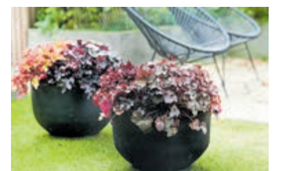
Purperklokje, een echte aandachtstrekker.

Zonder al te veel moeite kun je maximaal genieten van herfstbloeiers. Het belangrijkste is regelmatig de uitgebloeide bloemen weg te halen. De planten maken dan vanzelf nieuwe bloemen aan. Als je planten in potten zet, zorg dan altijd voor een gat in de bodem. Overtollig (giet)water kan dan eenvoudig wegvloeien en zo voorkomt dat de planten onverhoopt 'verdrinken'. Ga voor meer tips en ideeën naar www.mooiawatplantendoen.nl .