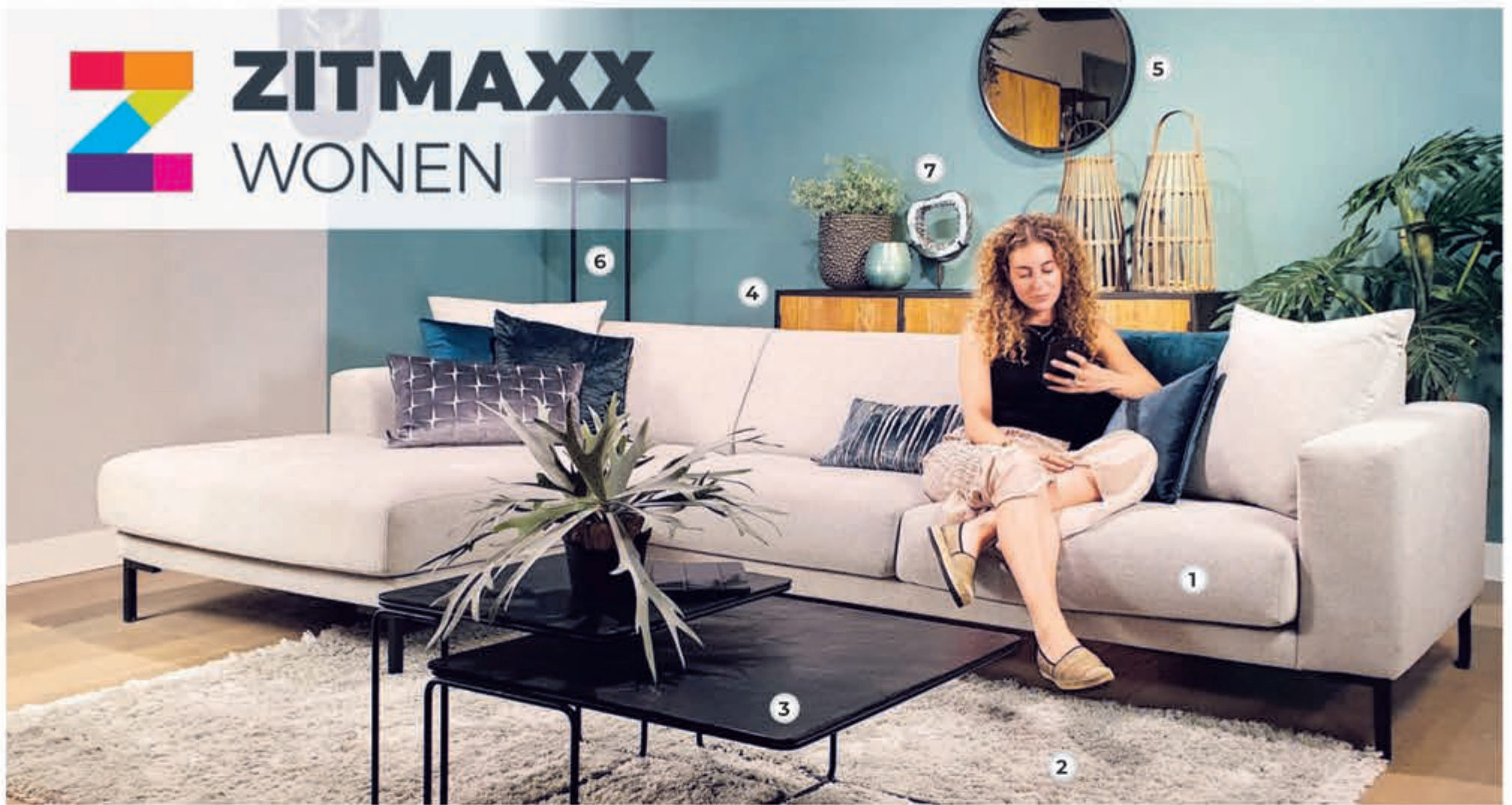
► 1. Loungebank GUETTA zoals afgebeeld v.a. 999,- | ► 2. Vloerkleed VERDE v.a. 139,- | ► 3. Salontafelset SCOTT 350,- | ► 4. Dressoir FELINO TOFF 759,- | ► 5. Spiegel MAERON 167,- | ► 6. Vloerlamp RECTANGLE 269,- | ► 7. Decoratie NORA 87,- |