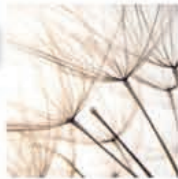
◀ Schilderij HARMONY 246,-