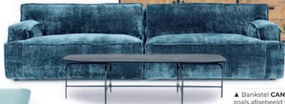
▲ Bankstel CANDY zoals afgebeeld v.a. 698,-