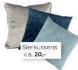
Sierkussens v.a. 20,-