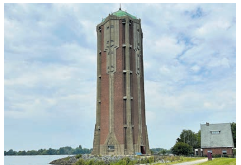
De watertoren in Aalsmeer.

De watertoren aan de Westeinder bezoeken kan deze maand augustus iedere zondag tussen 13.00 en 17.00 uur. De klim naar boven kost € 1,- voor kinderen en € 2,- voor volwassenen.