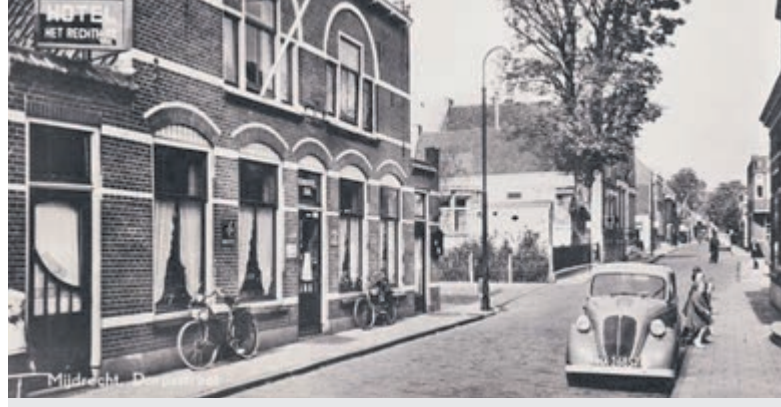
Nostalgisch Mijdrecht: Het Rechthuis.