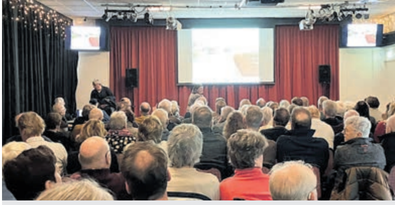
Nostalgische Filmavond in Wilnis.