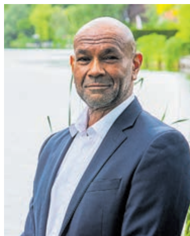
Wethouder José de Robles.

uithoorn staat alle informatie. Tip: op onze website www.uithoorn.nl/ laatgeengeldiggen staan nog meer regelingen voor inwoners en ondernemers met een krappe beurs. Kijk waar je recht op hebt! Het is ook mogelijk om vragen te stellen aan ons Sociaal Team: 0297- 513 111. Tussen 09.00 en 10.30 uur.