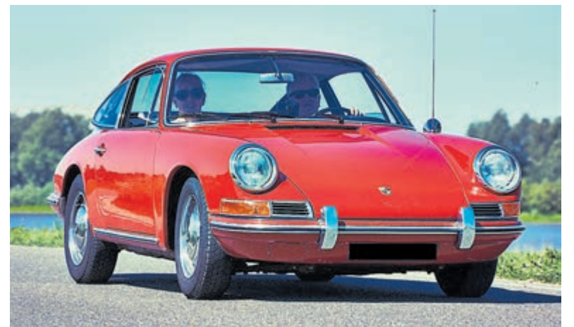
Oldtimer: Porsche 912 1966.