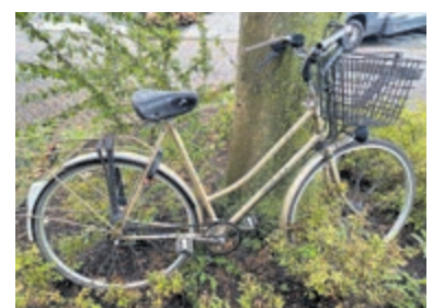
Wie is zijn of haar fiets kwijt? Foto is aangeleverd.

Mijdrecht - In de Wipmolen in Mijdrecht staat al gedurende een aantal weken een damesfiets. Zij lijkt eenzaam en verlaten, maar het kan natuurlijk ook zijn dat zij op vakantie is en de eigenaresse niet weet waar zij uithangt. Bent u dus uw fiets al gedurende de hele zomer al kwijt, dan weet u waar zij op vakantie is.