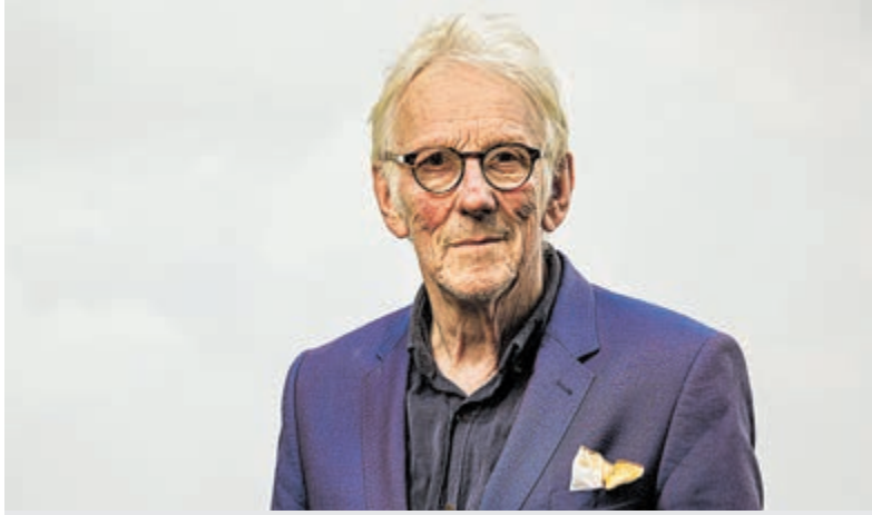
Freek de Jonge.