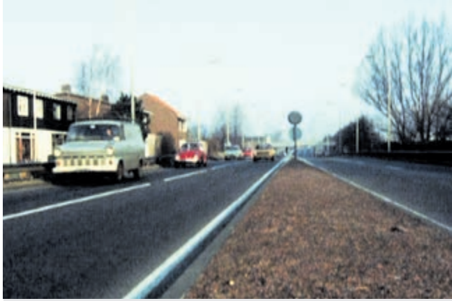
De Burgemeester Kasteleinweg in 1976.