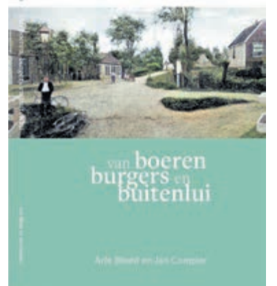
Illustratie: Cover Waverveen boek