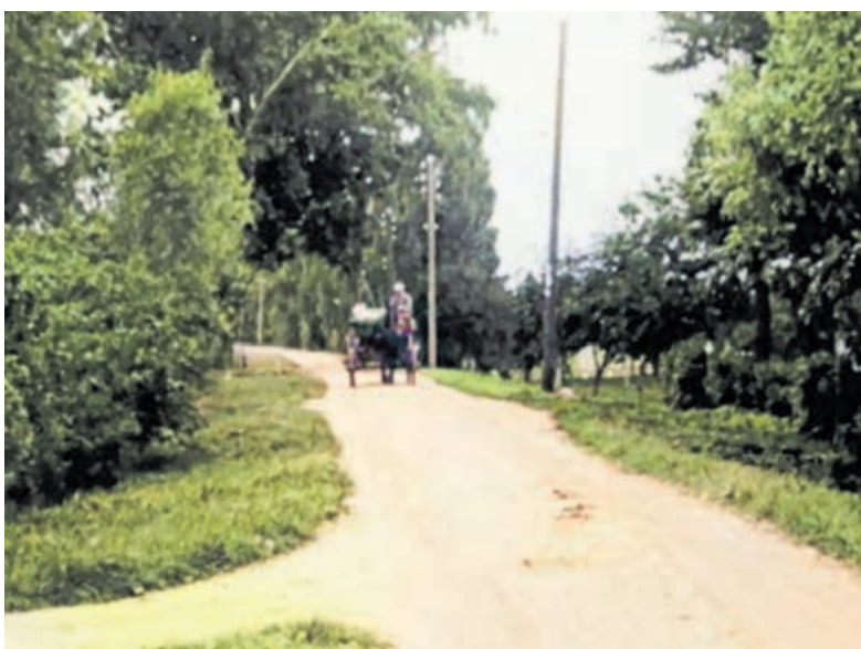
De Cliffordweg gezien vanaf de Veldweg rond 1930. Met links de grote populieren die in de 18e eeuw door de beroemde botanicus Linnaeus zouden zijn geplant voor het rechthuis. De bomen zijn in 1970 verwijderd omdat ze door de ouderdom gevaarlijk begonnen te worden.