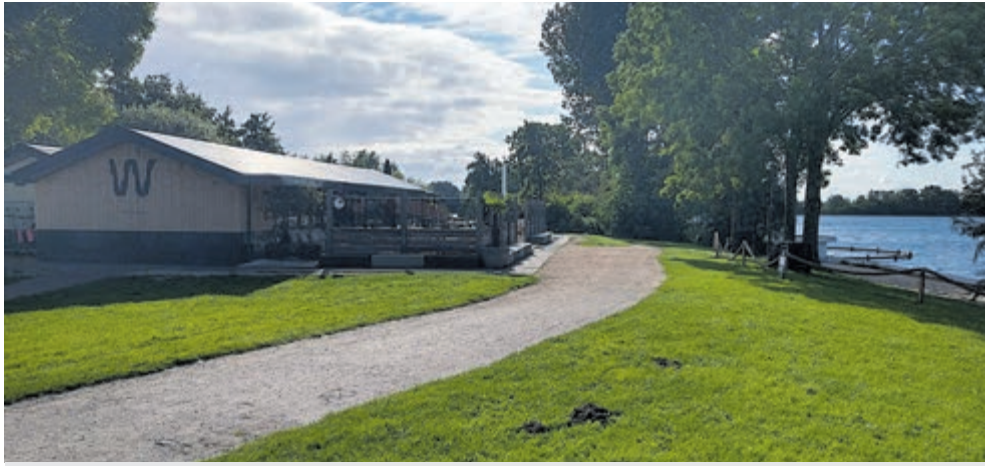
Eiland 1 met restaurant