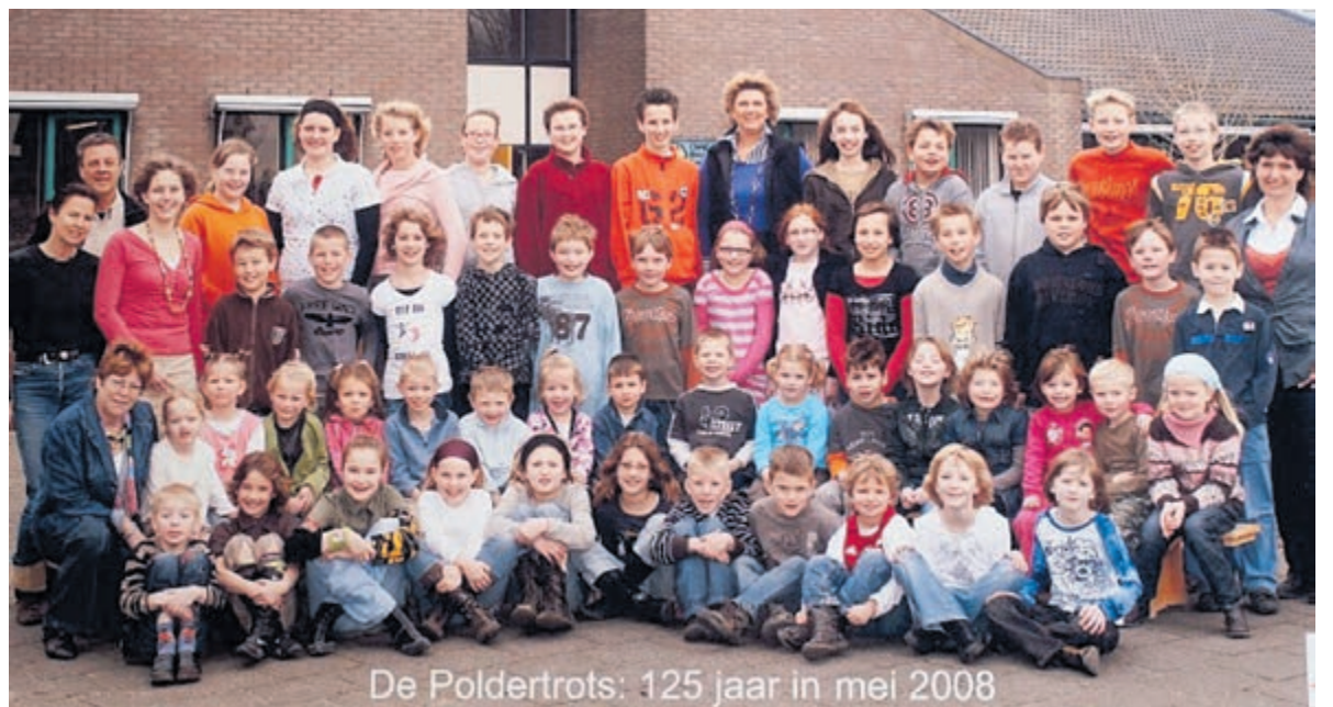
De Poldertrots: 125 jaar in mei 2008