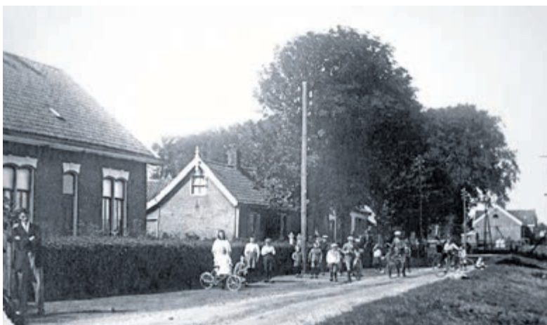
De Hoofdweg in de buurtschap Gemaal in de richting van de brug over de Waver rond 1930. Het aanzien is nu totaal veranderd (links staan de panden Hoofdweg 18 en 20).

Belangstelling wekken voor de geschiedenis van De Ronde Venen in de ruimste zin. Onze vereniging geeft gelegenheid tot onderzoek naar eigen voorouders, stimuleert de aandacht voor oude panden en via de Stichting Proosdijer Publicaties verzorgen we uitgaven over de geschiedenis van De Ronde Venen. Zoals het boek 'Waverveen: van boeren, burgers en buitenlui', binnenkort à € 24,50 verkrijgbaar via de lokale boekhandels of via www.proosdijerlanden.nl/publicaties . Het visitekaartje van de vereniging is het keurig verzorgde, inhoudelijk ter zake kundig en historisch verantwoorde tijdschrift: de Proosdijkroniek. Leden ontvangen elk kwartaal dit fraai vormgegeven blad met een grote diversiteit aan artikelen over de historie van onze omgeving.