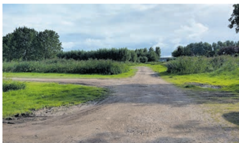
Hier zou het hotel moeten komen