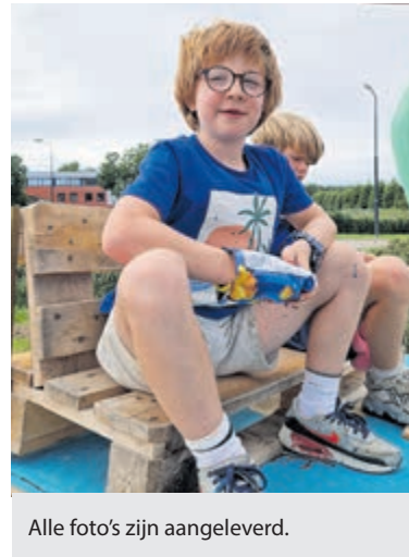
Alle foto's zijn aangeleverd.